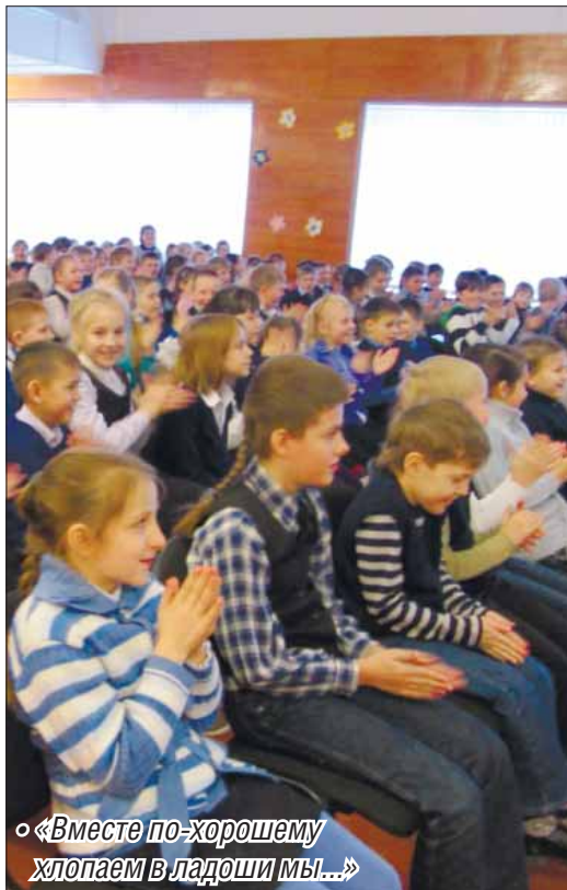
«Вместе по-хорошему хлопаем в ладоши мы...»

Уроки джаза органично вписались в расписание начальных классов школы №8