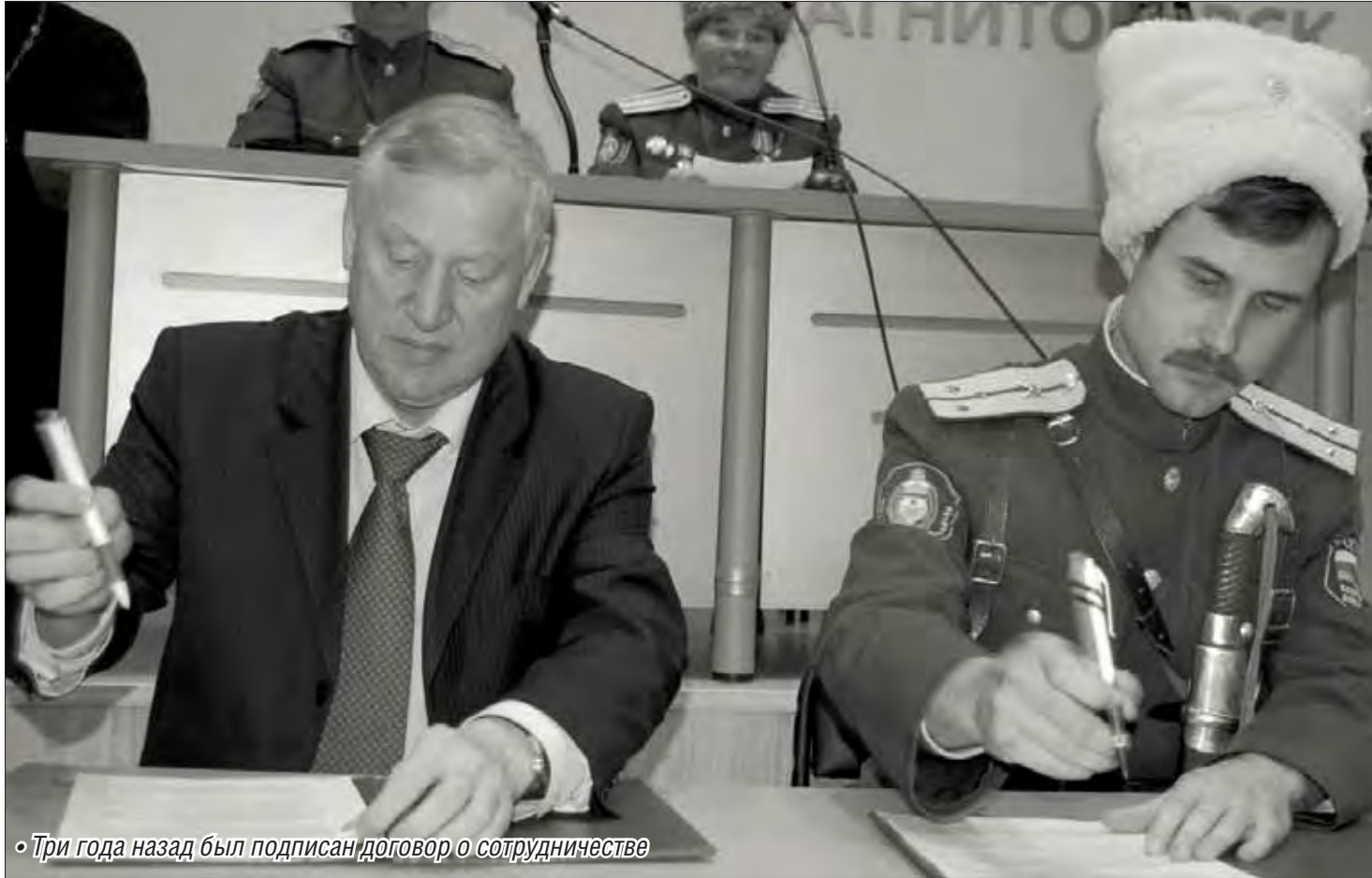
• Три года назад был подписан договор о сотрудничестве

Казачи молитвой поминают родственников, погубленных во времена красного террора