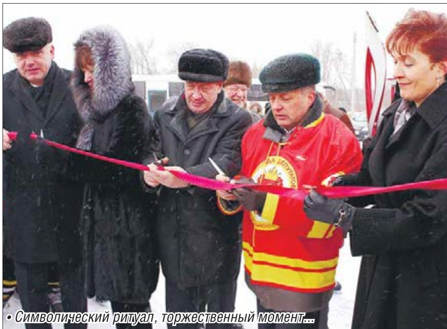
• Символический ритуал, торжественный момент...

В понедельник в посёлке Димитрова появилось своё хоккейное поле