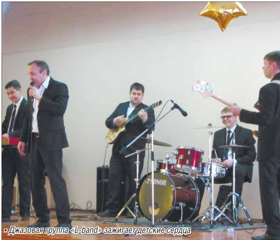
«Джазовая группа «L-band» зажигает детские сердца»