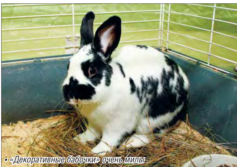
• «Декоративные бабочки» очень милы!