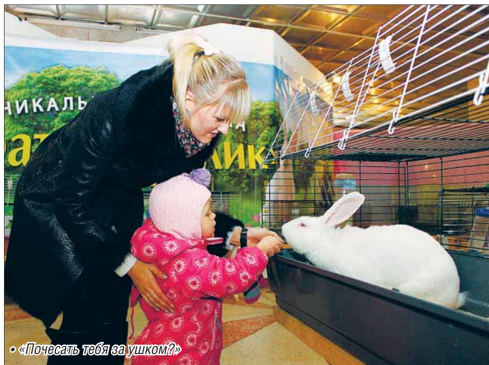
• «Почесать тебя за ушком?»