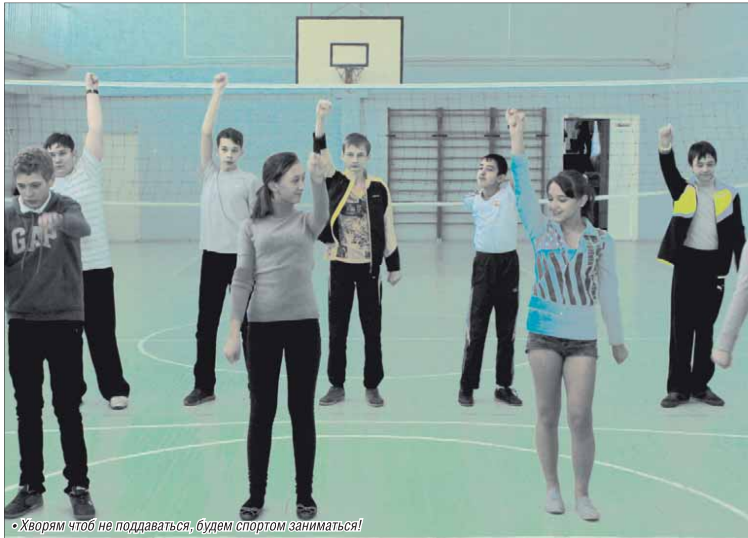
• Хворям чтоб не поддаваться, будем спортом заниматься!

О том, как не только получить хорошее образование, но и сохранить здоровье, давно задумываются в магнитогорской школе №54