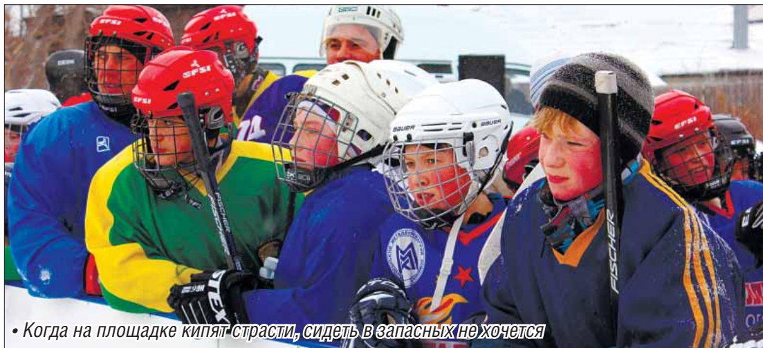
• Когда на площадке кипят страсти, сидеть в запасных не хочется

– Мы очень рады, что теперь у нас есть такое спортивное сооружение. Нашим детям будет где заниматься хоккеем, – говорили растроганные жители поселка, глядя, как спортсмены в полной хоккейной амуниции томятся в желании поскорее освоить залитый лед.