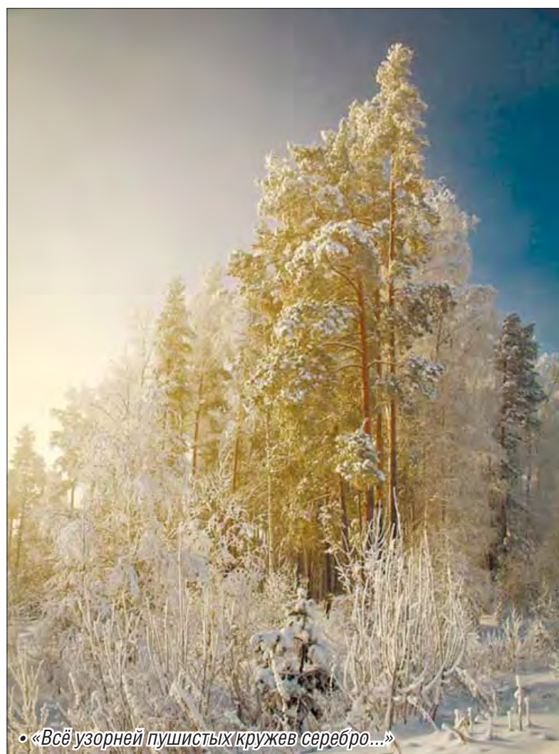
• «Всё узорней пушистых кружев серебро...»