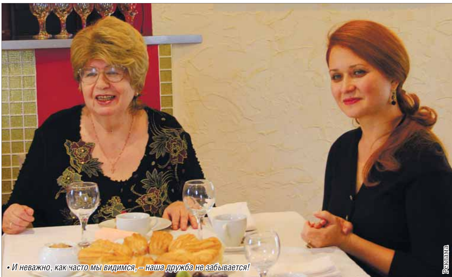
• И неважно, как часто мы видимся, — наша дружба не забывается!

Новогодние праздники позади, но у большинства из нас они надолго сохранятся в памяти