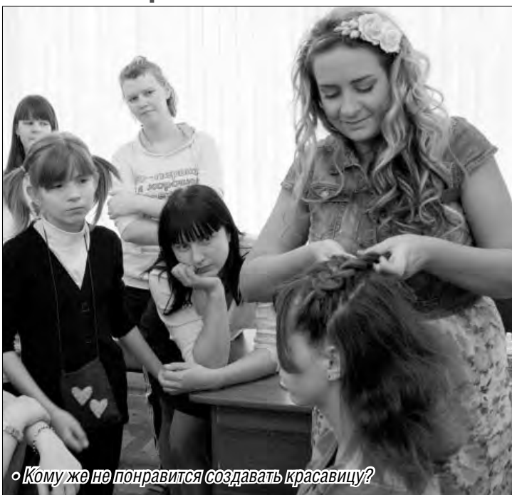
◦ Кому же не понравится создавать красоту?

– У нас уже проходили такие мероприятия, – говорит педагог-организатор детского до-