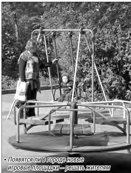
«Появятся ли в городе новые игровые площадки – решать жителям»

Игровые площадки всегда привлекают ребятню