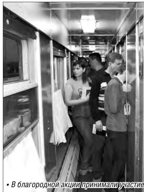
• В благородной акции принимали участие как постоянные доноры, так и новички