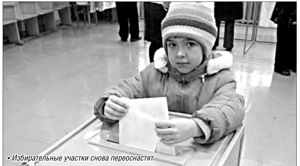
• Избирательные участки снова перевооружают

По его словам, пропадет необходимость отвозить протоколы в территориальные избирательные комиссии на бумаге и на электронном носителе. Процесс заметно ускорится. Сначала члены участковой комиссии поставят на протоколе электронные подписи, что придаст данным юридическую силу. Система, как пояснили в ЦИК, сразу «увидит» протокол с фамилиями конкретных лиц, чьими подписями он будет скреплен. Таким образом достигается предель-