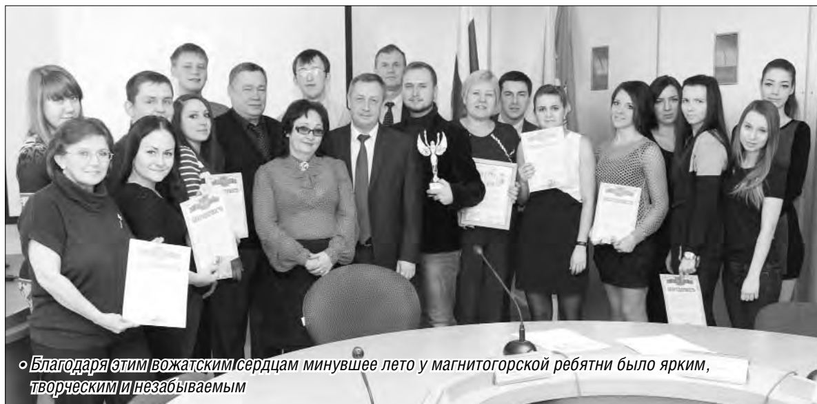
◦ Благодаря этим вожатским сердцам минувшее лето у магнитогорской ребятни было ярким, творческим и незабываемым