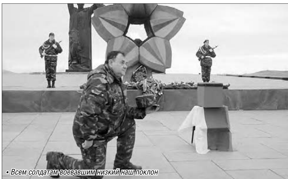
• Всем солдатам, воевавшим, низкий наш поклон

Карельские поисковики нашли останки солдата, который ушел на войну из Магнитогорска