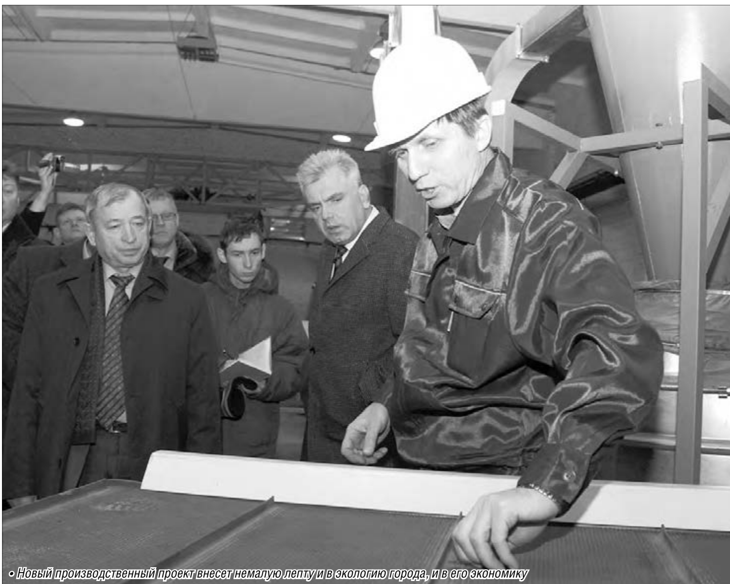
• Новый производственный проект внесет немалую лепту и в экологию города, и в его экономику

В Магнитогорске ввели в строй технологическую линию по утилизации и переработке автомобильных покрышек