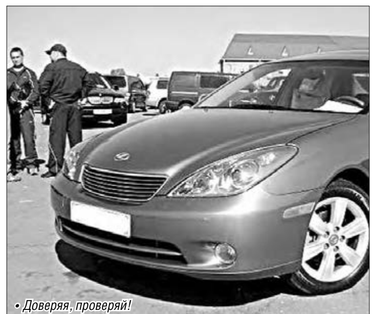
• Доверяя, проверяй!