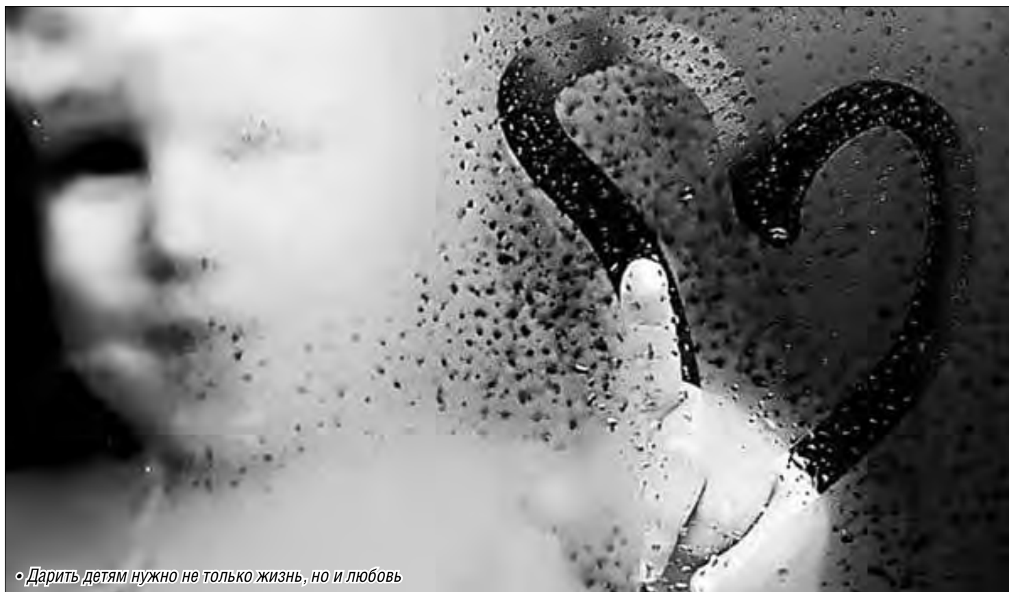
• Дарить детям нужно не только жизнь, но и любовь