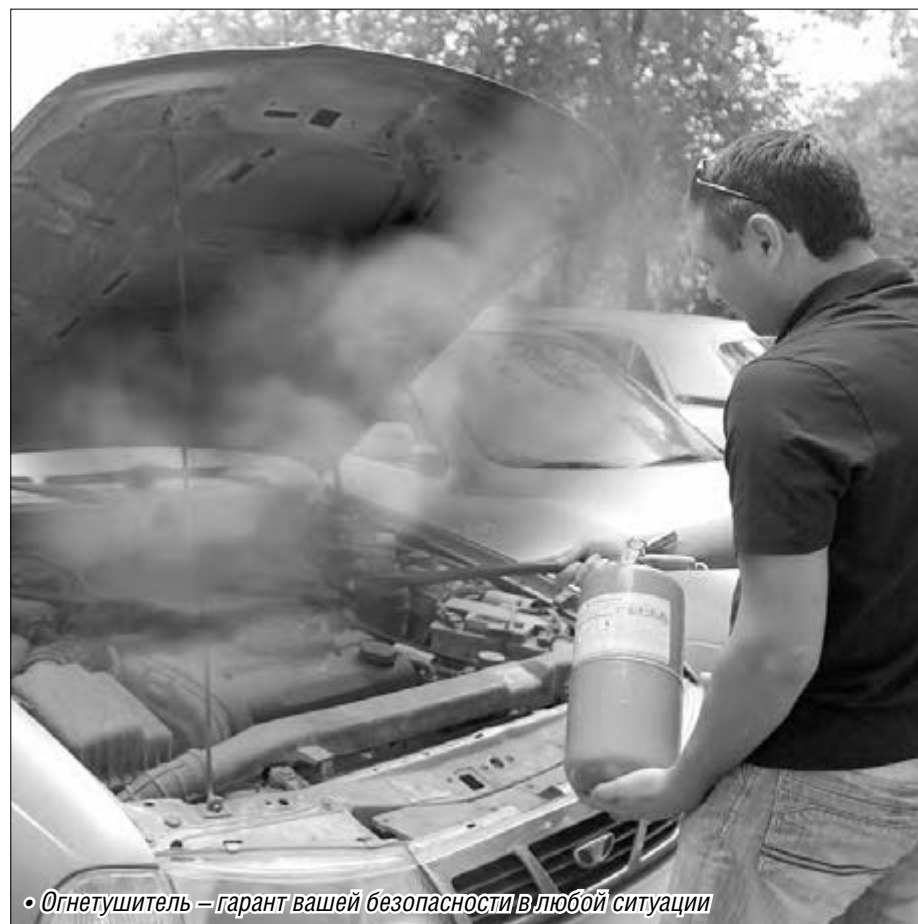
«Огнетушитель – гарант вашей безопасности в любой ситуации»

Валентина ПАВЛОВА