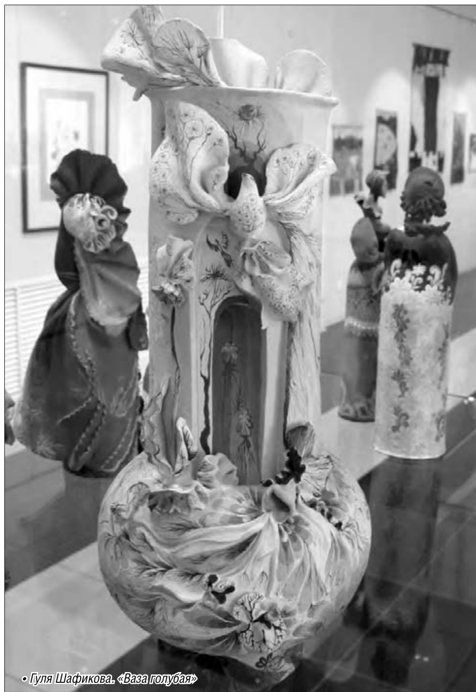
• Гуля Шафикова. «Ваза голубая»

Но то, что мы увидели на новой выставке «Откровение» в Магнитогорской картинной галерее, как будто сошло с небес – талантливо, необычно и божественно красиво.