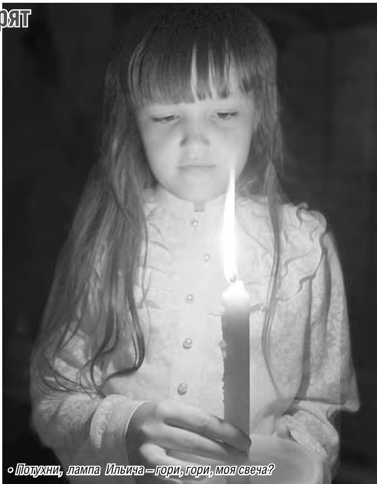
«Полуночи, лампа Ильича – гори, гори, моя свеча?»

Для расчета социальных норм региональным властям придется провести условную перепись населения либо заказать в подразделении Росстата изыскания и на основании полученных данных определить, насколько экономно население, какой именно тариф можно будет применить и сколько граждане готовы платить. Так, по данным Росстата, средняя магнитогорская семья из трех человек, проживающая на жилплощади в 54 квадратных метра, в месяц потребляет от 115 до 170 кВт. Таким образом, при умении экономить такая семья сможет уложиться в соцнорму. По условиям проекта в рамках экономичности должны оказаться примерно 80 процентов местных потребителей. В соответствии с новыми условиями средний коэффициент потребления для одинокого домовладельца составит 96 кВт/ч, 146 кВт/ч – для двух человек, 166 кВт/ч – для трех, 186 кВт/ч – для четырех и 206 кВт/ч – для пяти и более.