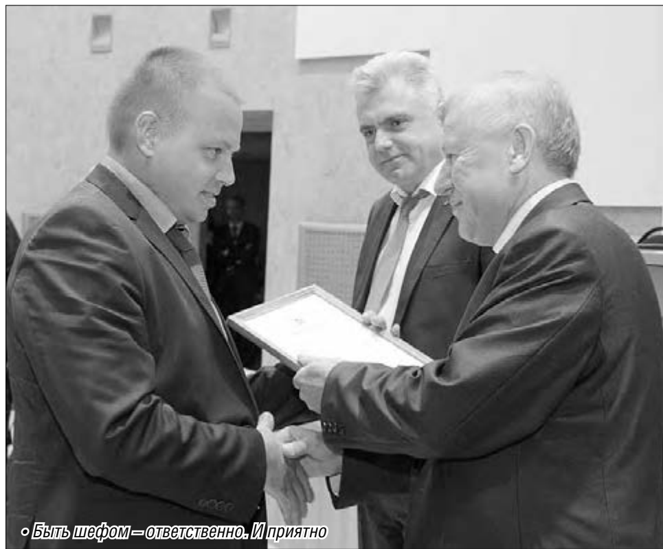
«Быть шефом – ответственно. И приятно»

За социальное партнерство со школами благодарственные письма глава горо-