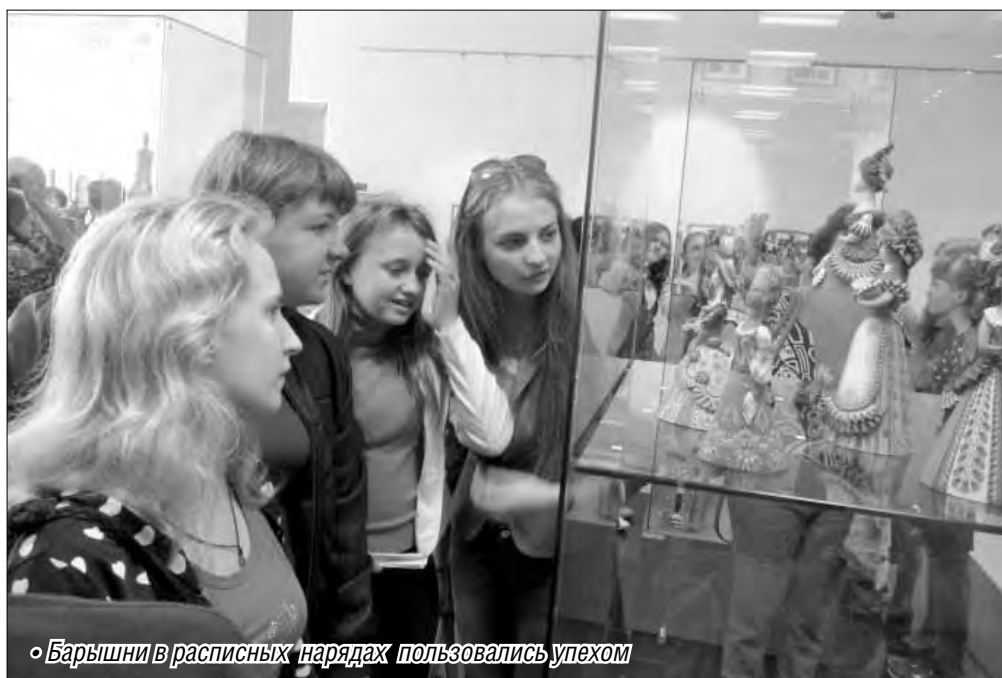
• Барышни в расписных нарядах пользовались успехом