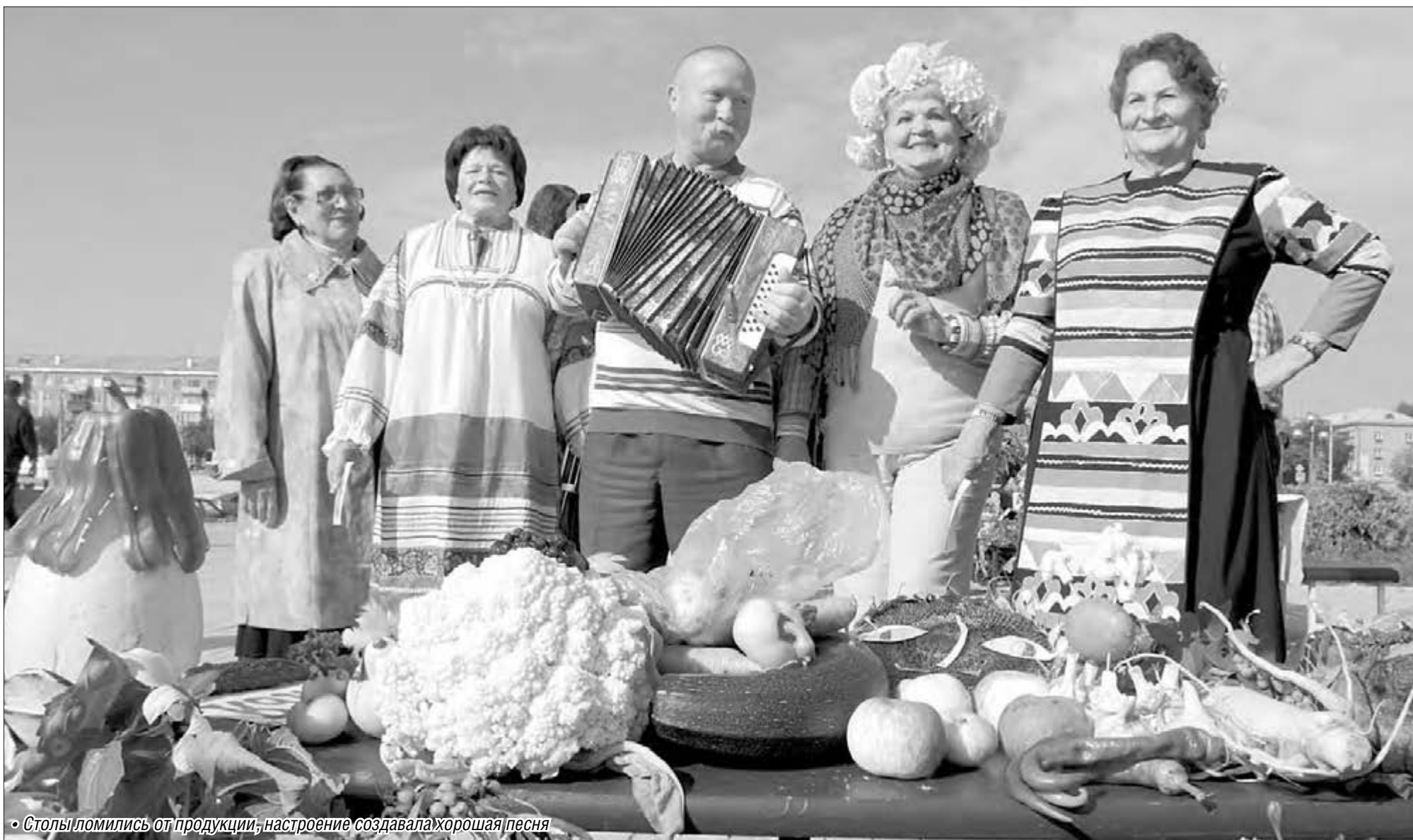
• Столы ломались от продукции, настроение создавала хорошая песня

В самых экстремальных условиях садоводы Магнитогорска умудряются выращивать неплохие урожаи. Это показала традиционная выставка-конкурс «Дары осени».