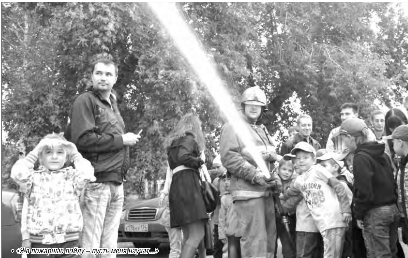
«Я в пожарные пойду – пусть меня научат...»

Первоклашки смогли примерить шлем полицейского и побывать внутри «скорой» во время праздника на Центральном стадионе