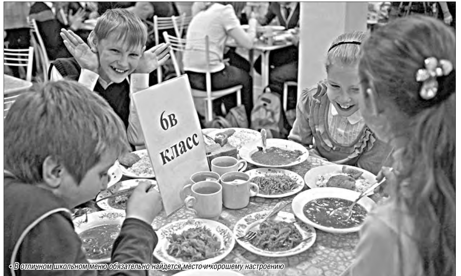
• В отличном школьном меню обязательно найдется место и хорошему настроению

Школьники на переменах всегда с удовольствием бегут в столовую