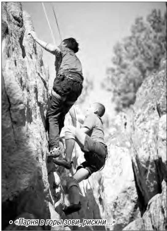
«Парня в горы зови, риски...»

Анастасия МАСЛАКОВА