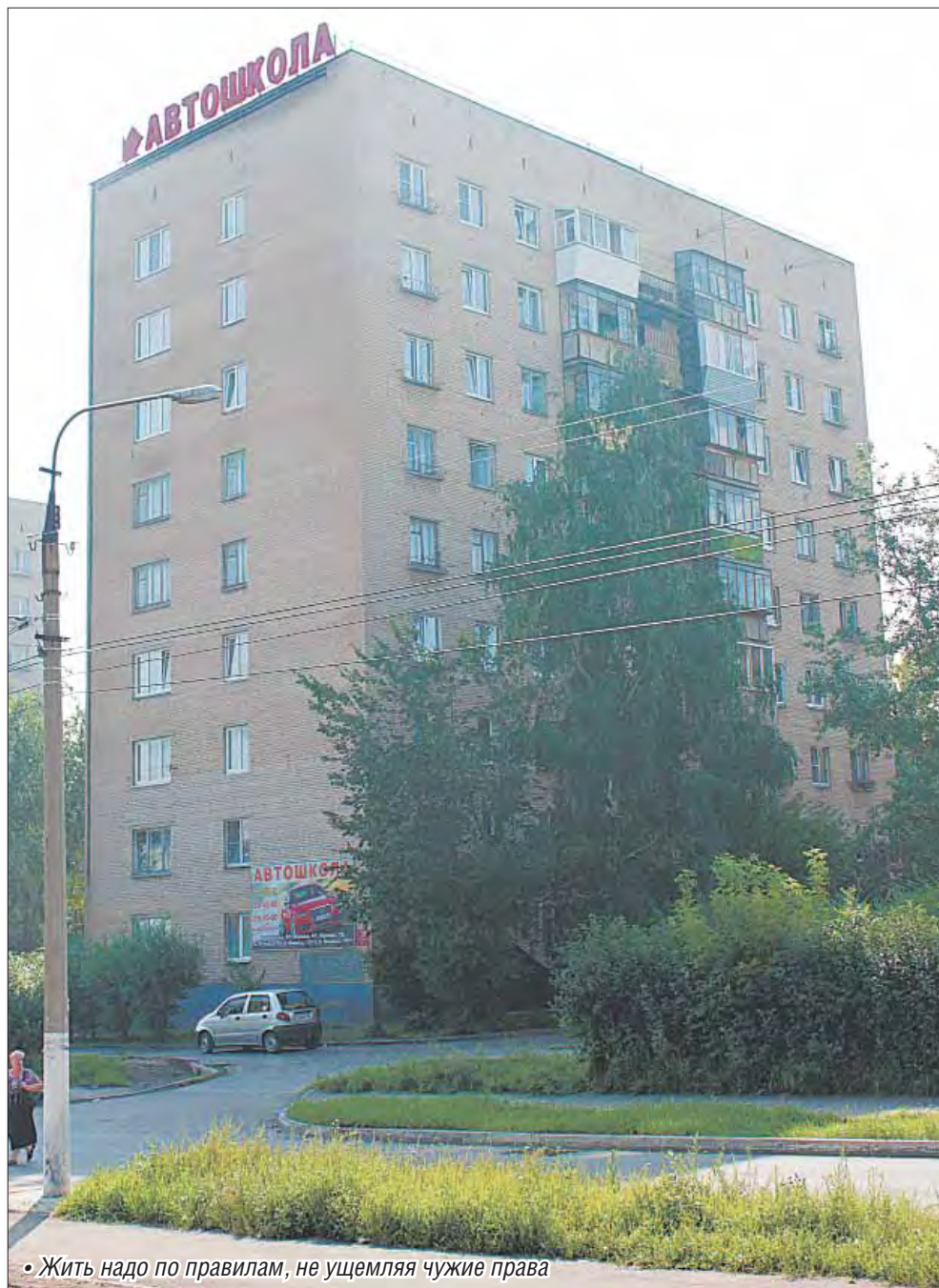
• Жить надо по правилам, не ущемляя чужие права

на строительство спорного объекта на крыше было утверждено органами местного самоуправления, но с условием – начать работы можно лишь при получении согласия собственников квартир, а еще нужно было заручиться положительным заключением на объект от органов санэпиднадзора. Такое согласование коммерсант даже получить не стал.