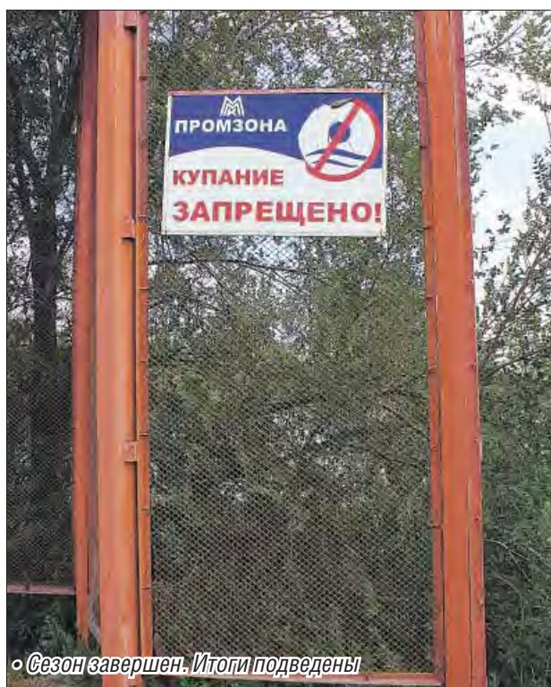
• Сезон завершен. Итоги подведены

Суд обязан установить факт соблюдения градостроительных или строительных норм. Несоблюдение их, даже незначительное, может быть основанием для удовлетворения исков, если нарушается право собственности истца. Кстати, ответчик заявлял в своих возражениях, что антенно-мачтовое сооружение не является строительным объектом, поэтому к нему нельзя применять нормы Градостроительного кодекса. Да, согласился с таким утверждением высший суд, но это не значит, что не надо соблюдать санитарно-эпидемиологические правила.