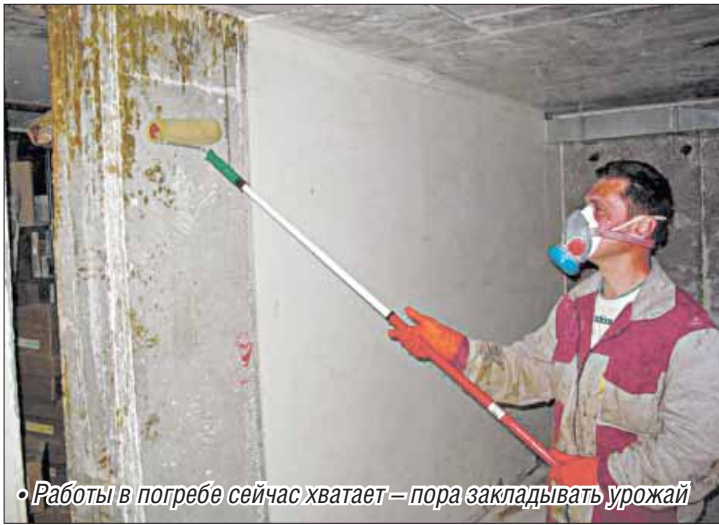
• Работы в погребе сейчас хватает – пора закладывать урожай

Однако существует способ еще более простой. Необходимую для просушки погреба воз-