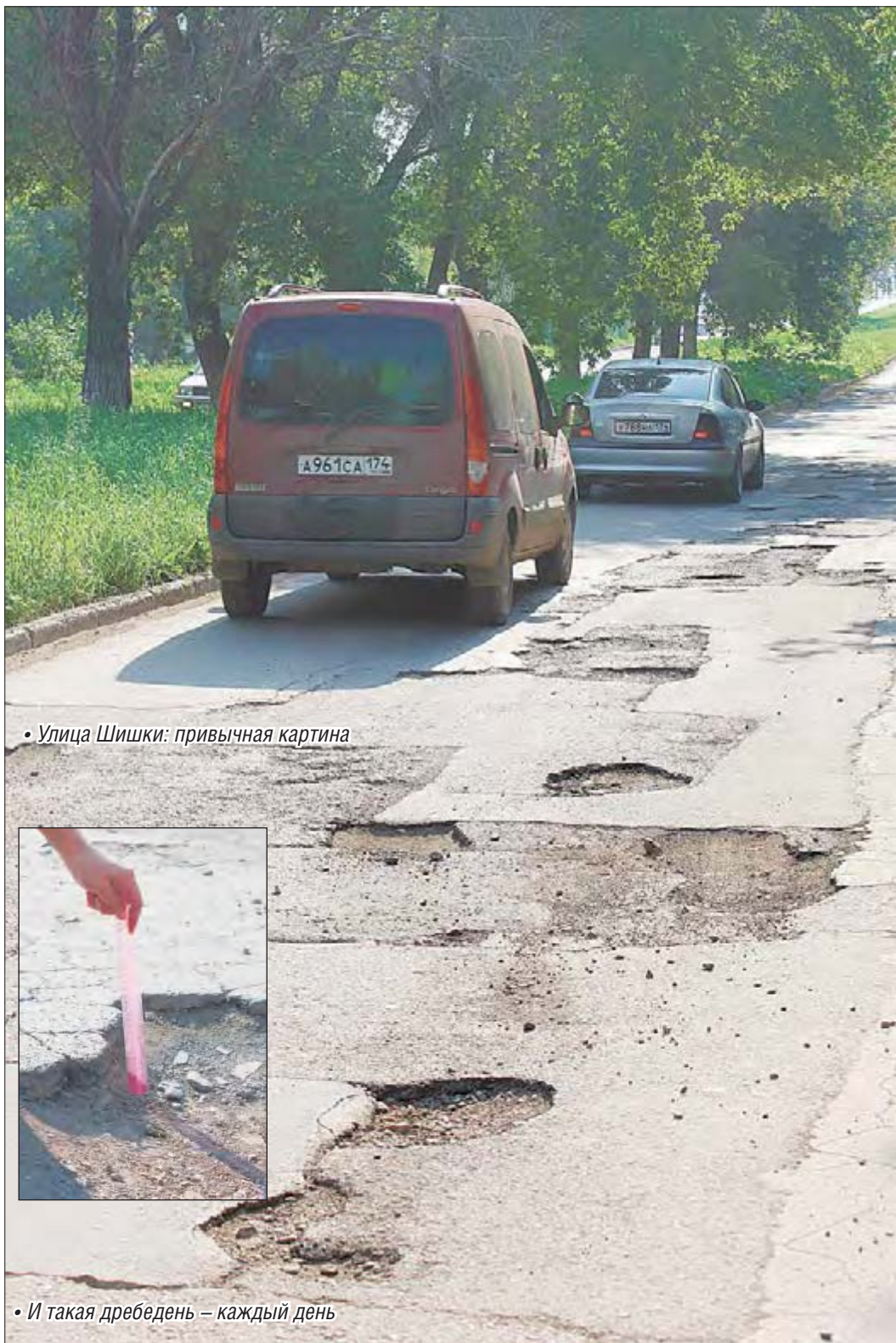
• Улица Шишки: привычная картина

Продолжается ямочный ремонт городских дорог