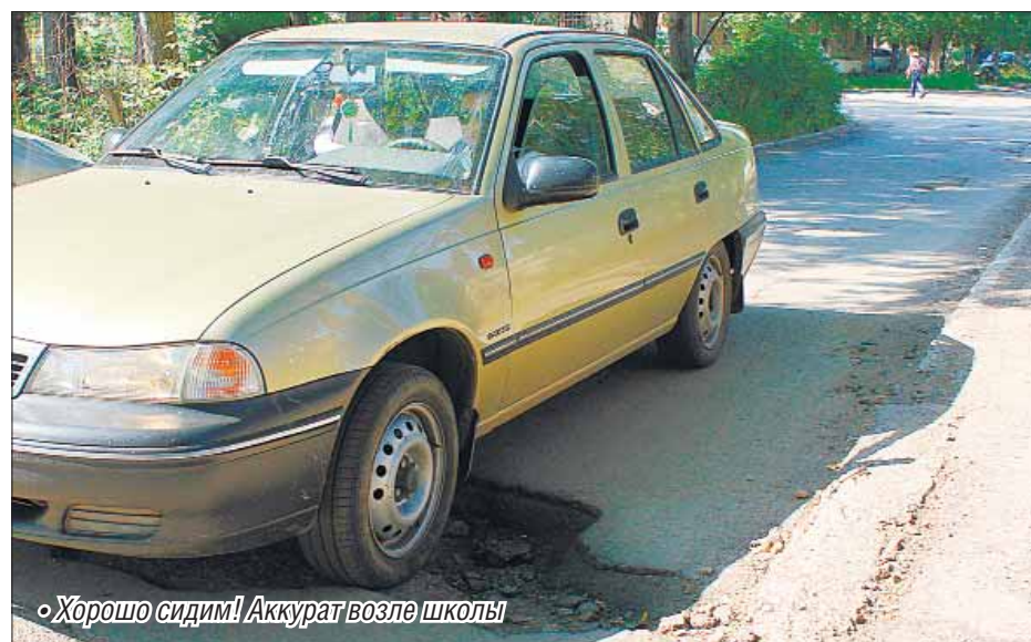
• Хорошо сидим! Аккурат возле школы

Однако горожан не покидает ощущение, что ям меньше не становится.