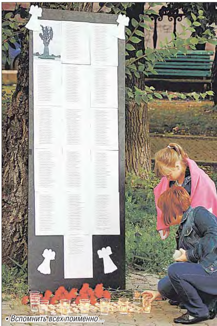
• Вспомнить всех поименно...