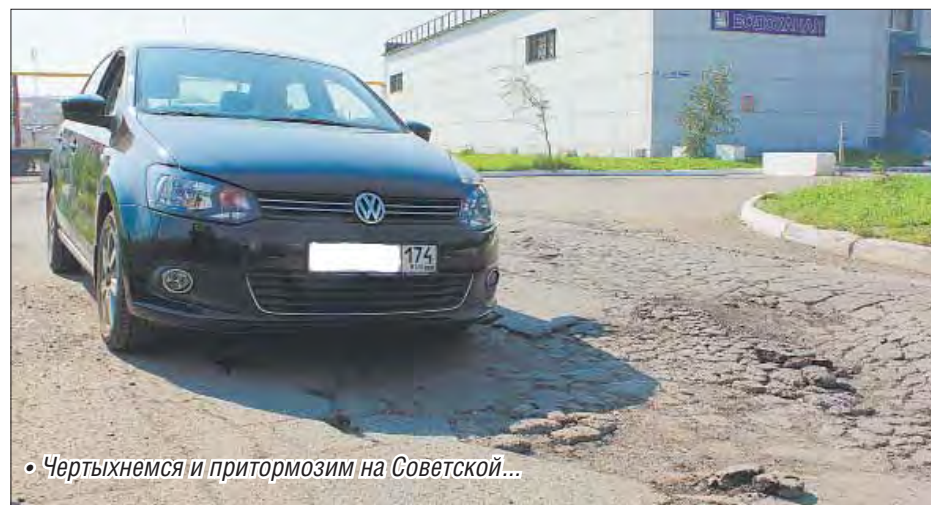
• Чертыхнемся и притормозим на Советской...