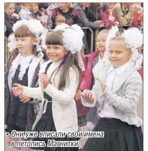
• Они уже вписали свои имена в летопись Магнитки