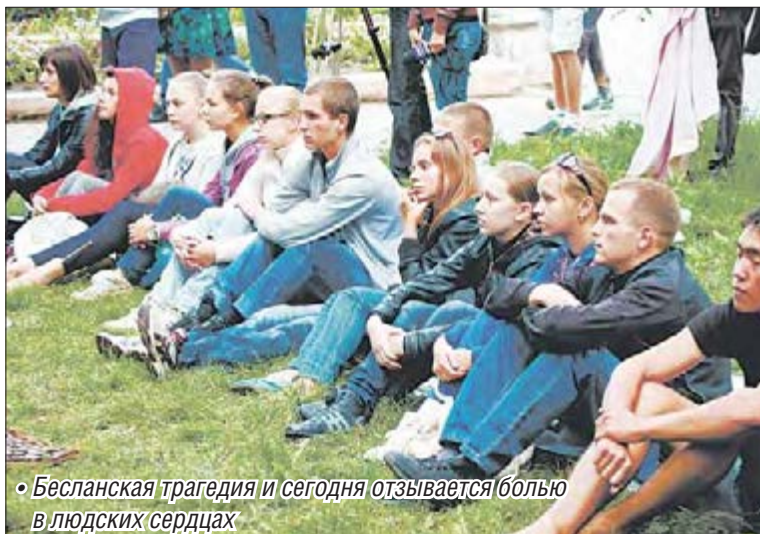
• Бесланская трагедия и сегодня отзывается болью в людских сердцах

За последние два с лишним десятка лет Россию сотрясало от террористических актов не десятки, а сотни раз. Около двух десятков злодеяний совершались на территории Москвы. Самые страшные – взрывы домов на улице Гурьянова в 1999 году, где погибли 94 человека, и на Каширском шоссе, где погиб 121 человек. Целая серия взрывов домов по всей стране прошла в 1994 году. 14 июня 1995 года – Буденновск: погибло 136, ранено 419 человек. Всего за 1995-й в стране совершено 14 актов террора, в 1996-м – 17. В двухтысячные террористы вовсе распоясались: в 2001 году по официальным данным совершено 320 терактов, в 2002-м – 360, среди них – захват театрального центра на Дубровке 23 октября, где из 800 заложников погибли 117. В 2003 году на территории России совершен 561 теракт, в 2004-м – 265, среди них – захват заложников в школе №1 Беслана. Во второй половине двухтысячных годов разгул террористов пошел на спад: 2006 год – 112 терактов, 2007 – 48, 2008 – 2... Но и по сей день эта проблема остается актуальной и находится на особом контроле силовых структур.