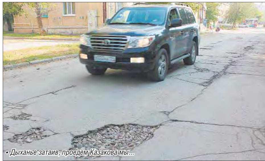
• Дыханье затаив, проедем Казакова мы...