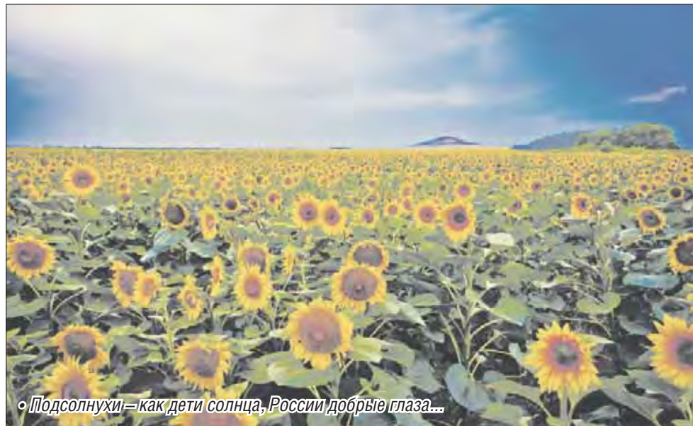
• Подсолнухи – как дети солнца, России добрые глаза...

По дороге у моего велосипеда спустило колесо. Я сначала испугалась, охватил страх – одна, никого рядом. Начала думать, как справиться и с собой, со своим страхом, и с решением проблемы. Подняла голову, огляделась вокруг, и вдруг, как в сказке, словно знак свыше – увидела поле с подсолнухами, желтое-желтое. И как же раньше я ездила мимо и никогда не замечала такой красоты совсем недалеко от дома, удивительная вещь! Может быть, и не колесо тому виной, а просто это был шанс спокойно оценить, насладиться, остановившись, отре-