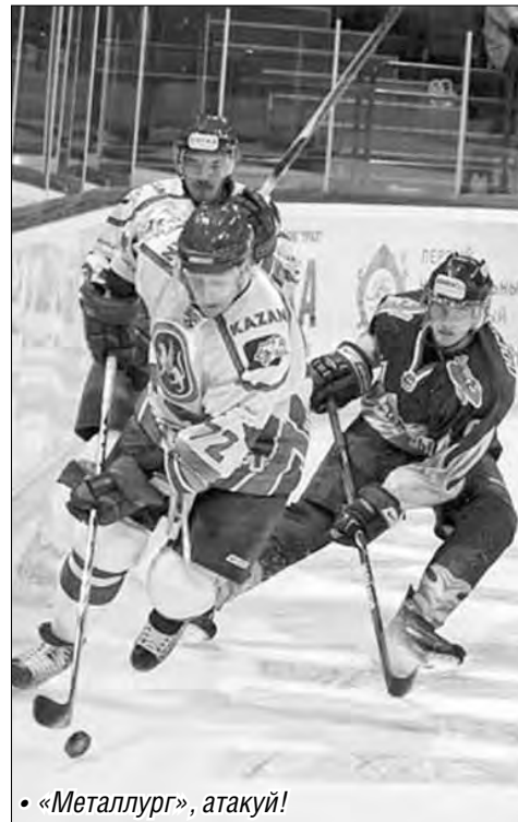
• «Металлург», атакуй!

На большом аппаратном совещании в администрации города первым вопросом стал новый хоккейный сезон в Магнитогорске.