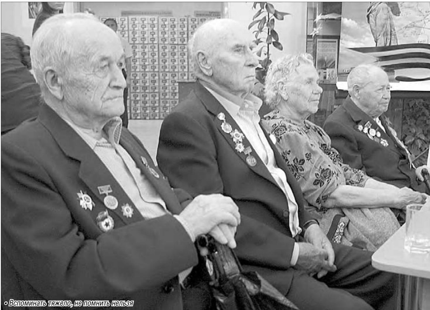
«Вспоминать тяжело, но помнить нельзя»

В библиотеке имени Бориса Ручьева состоялся праздник, посвященный одному из крупнейших событий в отечественной истории.