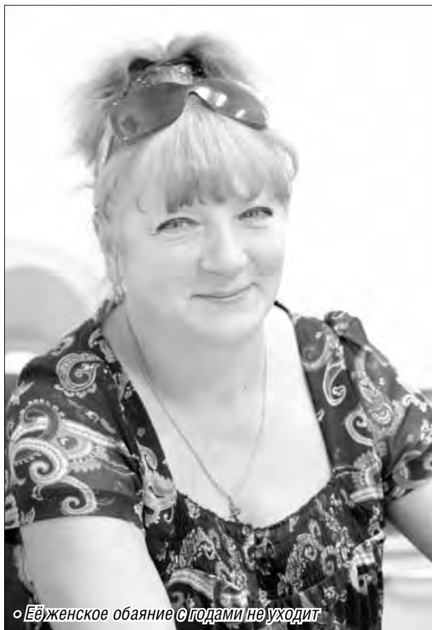
«Её женское обаяние с годами не уходит»

В День российского кино перевернем несколько страниц его истории