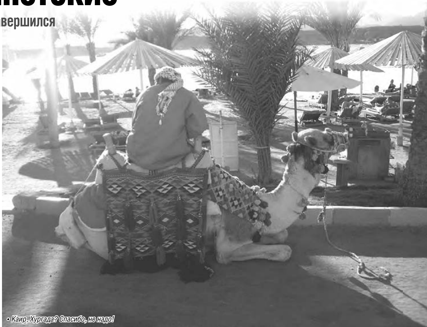
• Каир, Хургада? Спасибо, не надо!

приобрела в конце июля в турфирме без всяких проблем. Ее только предупредили, что в Египте не все спокойно. Самолет, привезший рискованное семейство домой, был полон, но вечером снова улетал с новой партией «экстремалов».