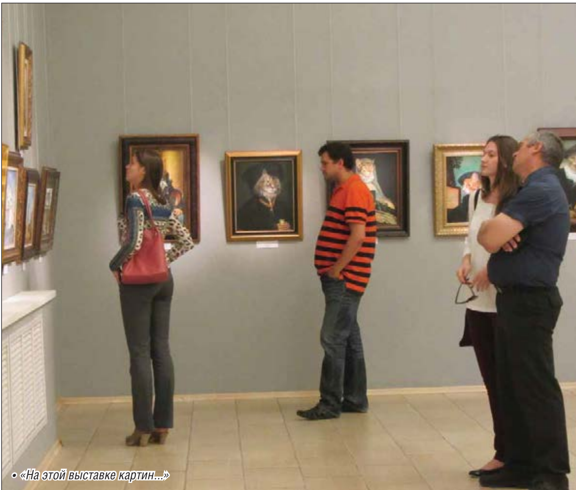
• «На этой выставке картин...»

Затейливым вензелем «S. Nikas» подписаны 83 полотна, украшающих картинную галерею