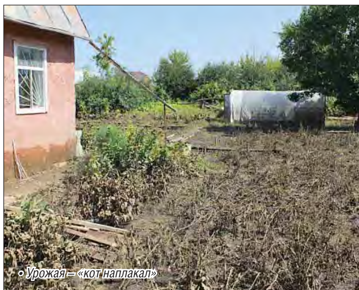
Урожай – «кот наплакал»