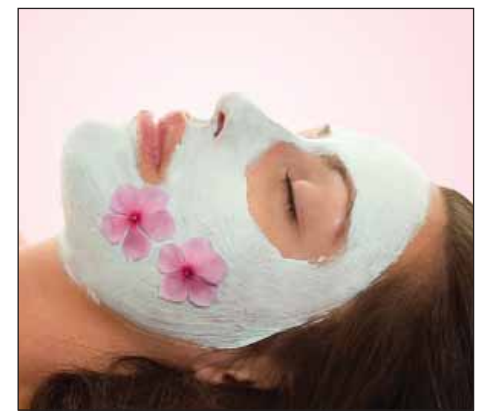
Выпуск подготовила Ирина СОРОКИНА

Травяная маска. Смешать по 1 ч. л. размолотых в кофемолке ароматных трав – мяты, укропа, ромашки, шалфея, лепестков роз, липового цвета – и заварить в 1,5 л кипятка. Отжатую травяную массу наложить на лицо салфеткой, смоченной в полученном настое. Снять через 25-30 минут маску, припудрить лицо.