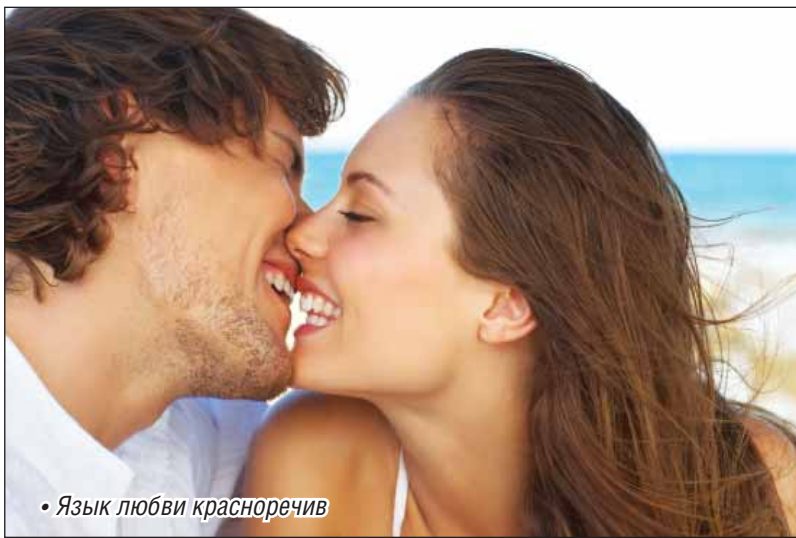
• Язык любви красноречив

А еще почаще дарите друг другу подарки и делайте что-нибудь приятное. Пусть у вас будут понятные и известные только вам двоим ритуалы. Они – как сигнальные флажки: я помню о тебе, я люблю тебя, я хочу доставить тебе радость. В счастливых браках подобное внимание продолжается не только в первый год супружества, но и во все последующие.