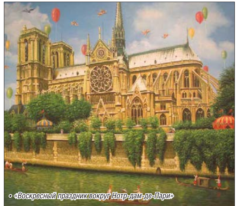
• «Воскресный праздник вокруг Нотр-дам-де-Пари»

Уровень мастерства художника позволяет ему работать успешно в самых разных жанрах – портреты, пейзажи, сюрреалистич-