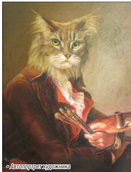
• Автопортрет художника