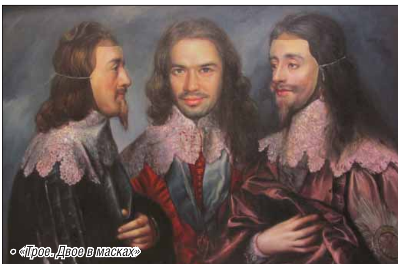
• «Трое. Двое в масках»