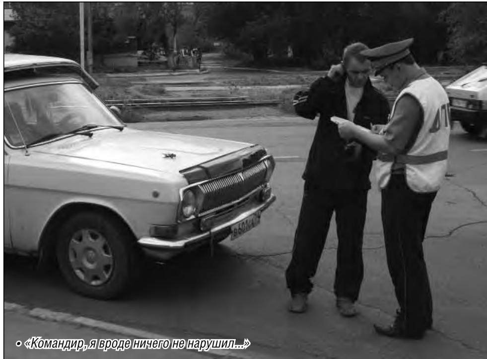
«Командир, я вроде ничего не нарушил...»

Из пояснений, содержащихся в протоколе об административном правонарушении, суд определил, что причина, по которой совершил остановку водитель, не являлась вынужденной в том смысле, который предусмотрен Правилами дорожного движения