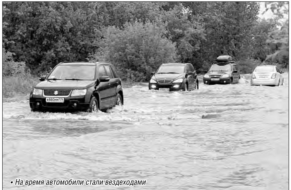
• На время автомобили стали вездеходами

Уровень воды в водохранилище, по словам Олега Жестовского, регулировался в текущем режиме. Так, 10 августа вынужденной мерой, которая позволила исключить возникновение новых чрезвычайных ситуаций, стал сброс 350 кубических метров