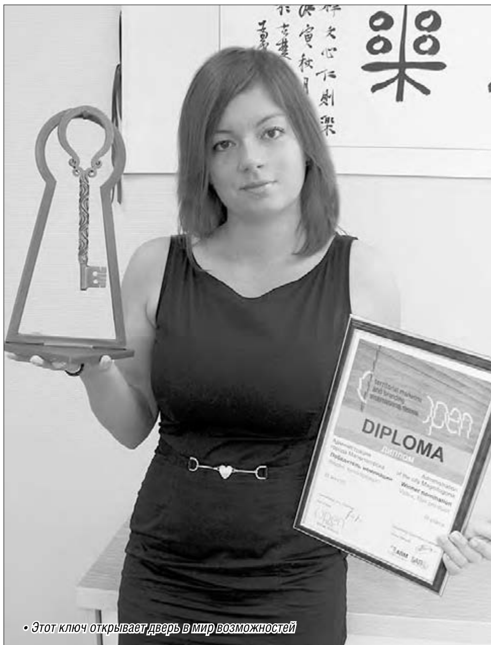
• Этот ключ открывает дверь в мир возможностей