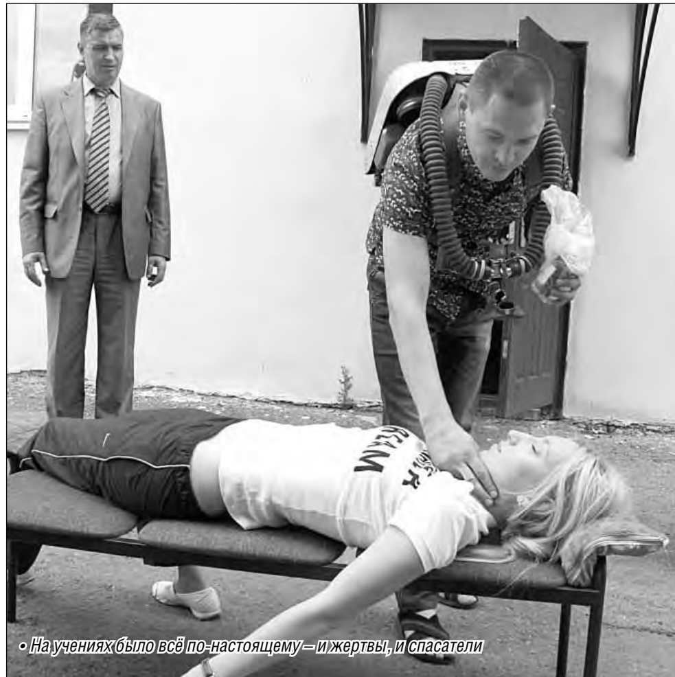
• Научениях (было всё по-настоящему – и жертвы, и спасатели)

На первом этапе ребятам из доменного цеха предстояло ответить на 60 вопросов – своеобразный профессиональный тест на знания. Успевали газовщики раньше окончания 45 минут – срока, который был отведен для решения тестов. И сразу же перешли к еще одной теоретической части состязания. На этот раз работникам доменного цеха предстояло выполнить расчеты