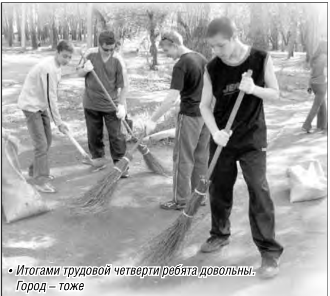
• Итогами трудовой четверти ребята довольны. Город – тоже