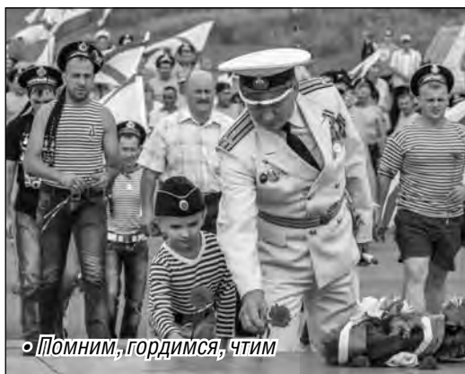
• Помним, гордимся, чтим

В минувшее воскресенье на мемориальной площади возле Вечного огня состоялся торжественный митинг, посвященный годовщине отечественного Военно-Морского флота. Погода не помешала, обошлось без дождя. Да и был бы, разве моряков водой напугаешь?