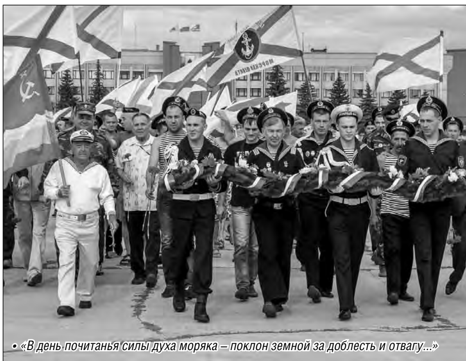
• В день почитания силы духа моряка – поклон земной за доблесть и отвагу...

Есть немало ярких свидетельств морской доблести жителей города металлургов