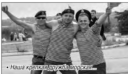
• Наша крепкая дружба морская...