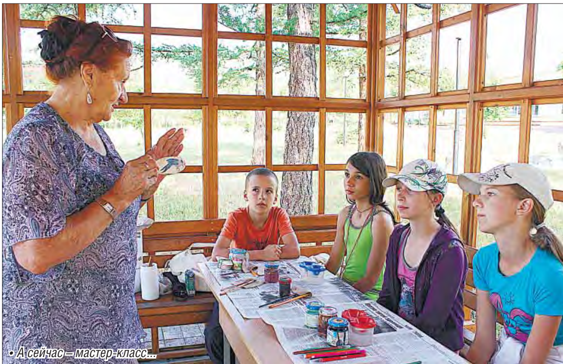
• А сейчас – мастер-класс...

На Банном продолжается веселое детское лето