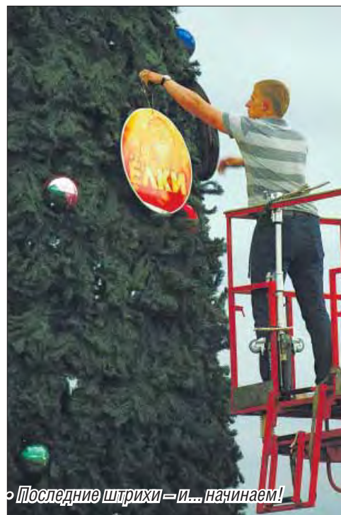
• Последние штрихи – и... начинаем!