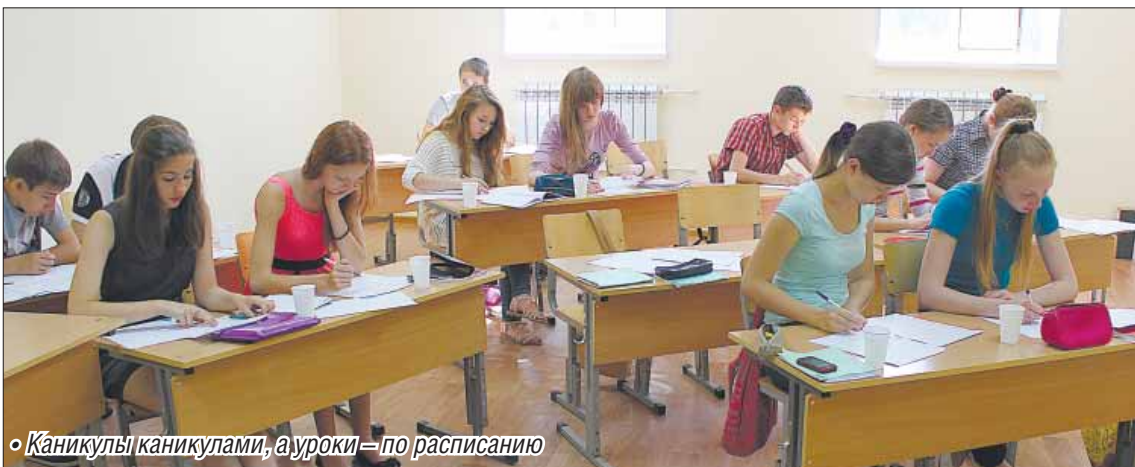
• Каникулы каникулами, а уроки – по расписанию