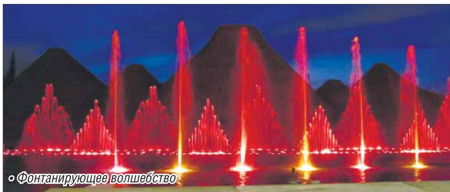
• Фонтанирующее волшебство

Гостеприимный Протарас – полёт души, отрада глаз!