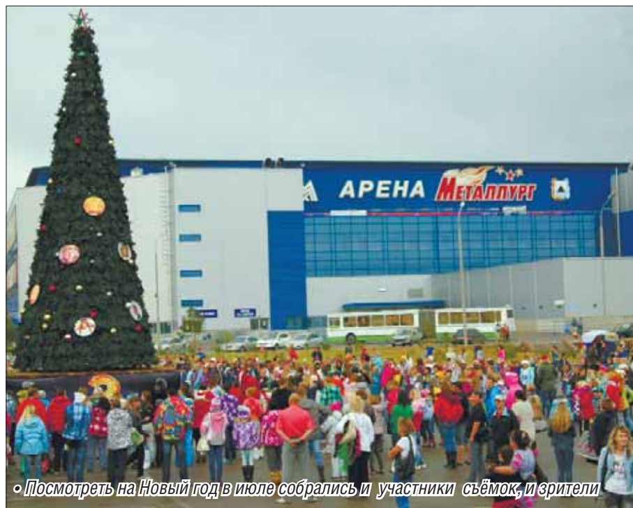
• Посмотреть на Новый год в июле собрались и участники съёмки, и зрители