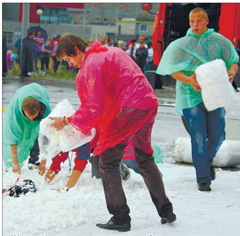
• Уфимский снег свою задачу выполнил – всё получилось натурально