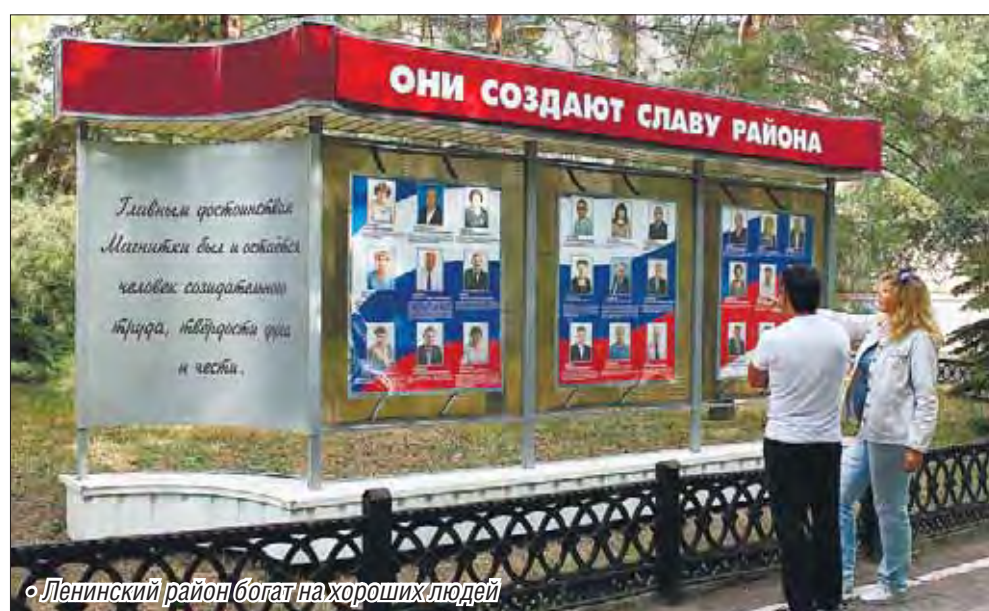
• Ленинский район богат на хороших людей

Не обошли стороной и работников образования, учреждений культуры, социальной защиты, спорта, правоохранительных органов, ветеранских организаций.