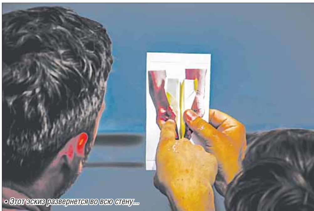
• Этот эскиз развернется во всю стену...

Стены домов в Магнитогорске разрисуют иностранцы