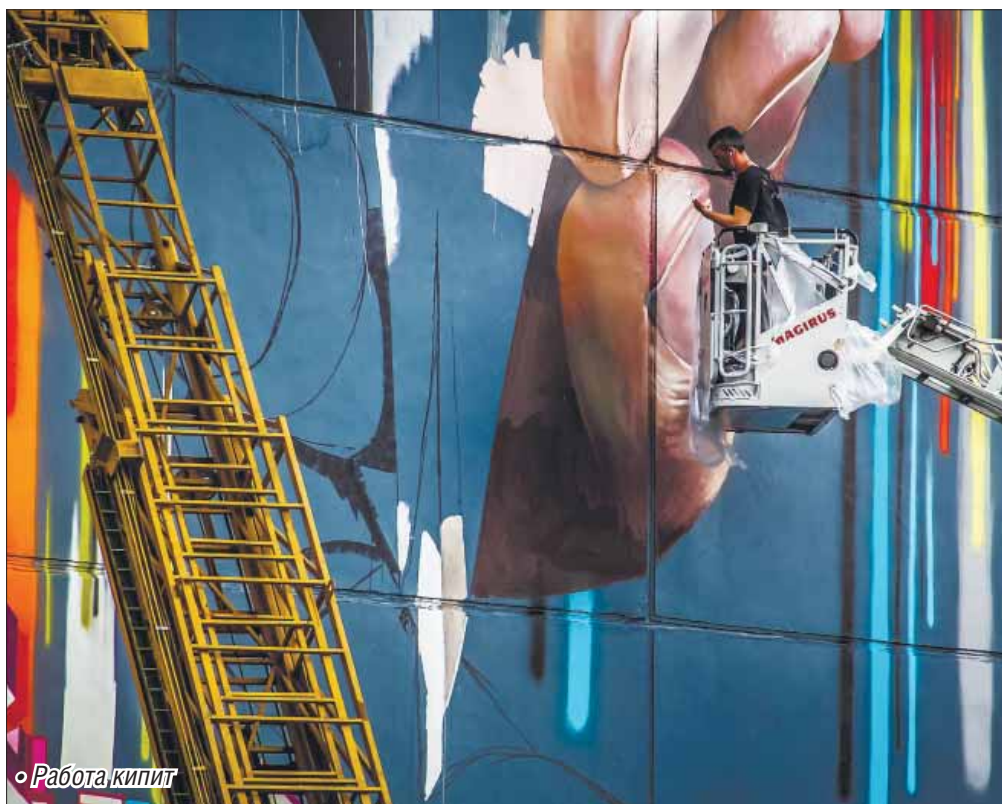
• Работа кипит