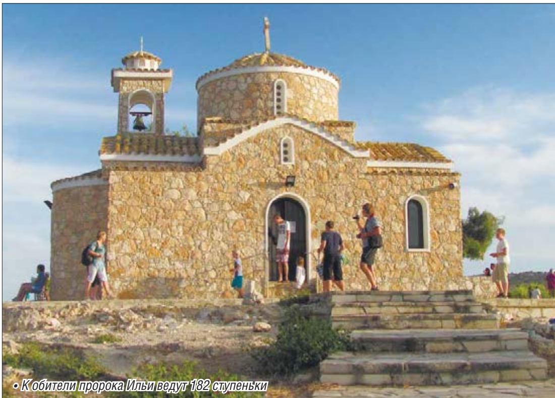
• К обителя пророка Ильи ведут 182 ступеньки

Еще в автобусе по дороге из аэропорта гид, восхваляя красоты и достопримечательности Кипра, заверил не успевших очухаться после перелета туристов, что уж чего не должны мы упустить, так это шоу «Волшебные танцующие фонтаны».