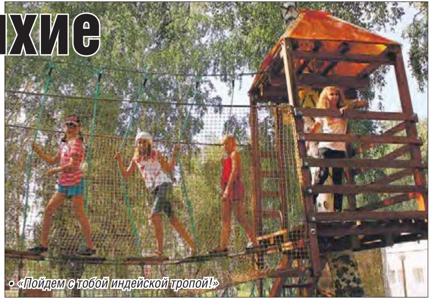
• «Пойдем с тобой индейской тропой!»