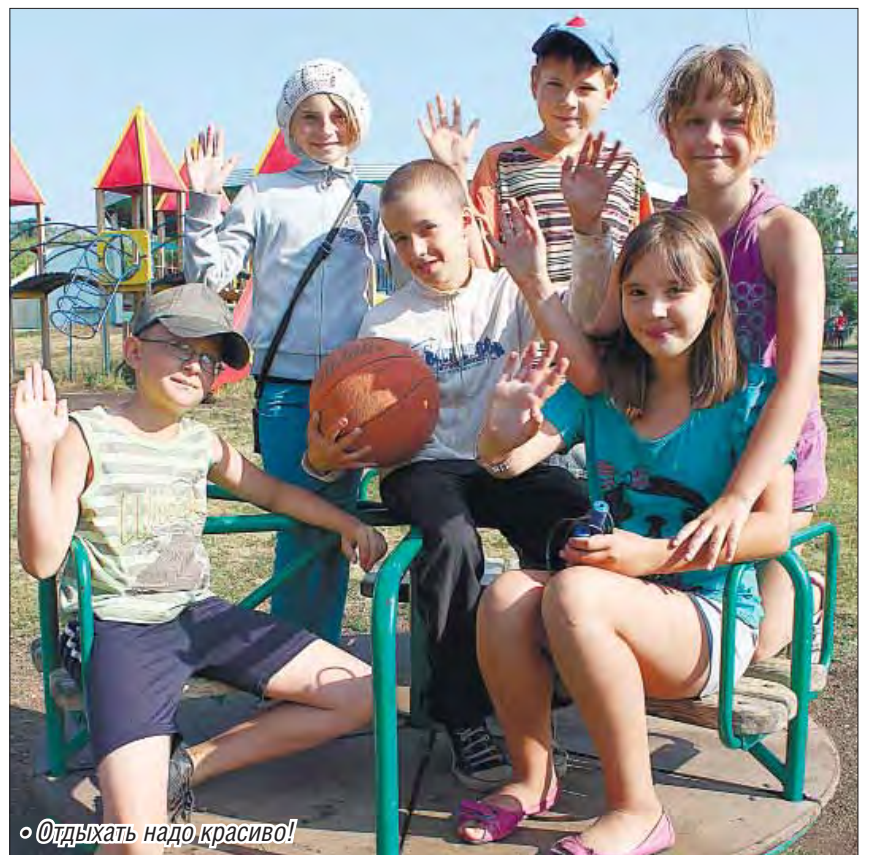
• Отдыхать надо красиво!

«Уральские зори» – необычный оздоровительный центр, поскольку здесь не только отдыхают и развлекаются, но и учатся.