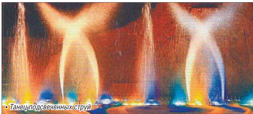
• Танец подсвеченных струй