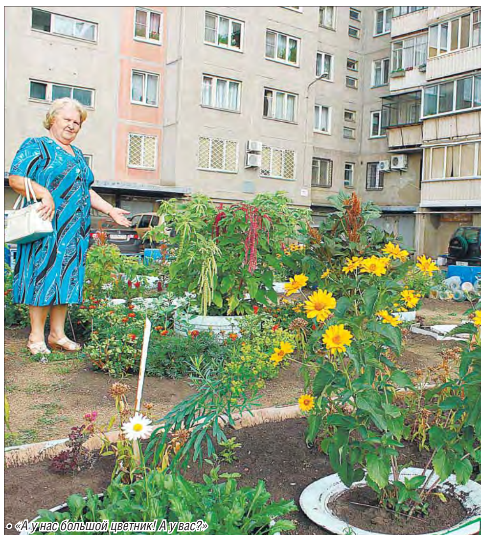
«А у нас большой цветник! А у вас?»

– Большинство обращений в комитет касаются именно благоустройства, поэтому и было принято решение о создании ко-