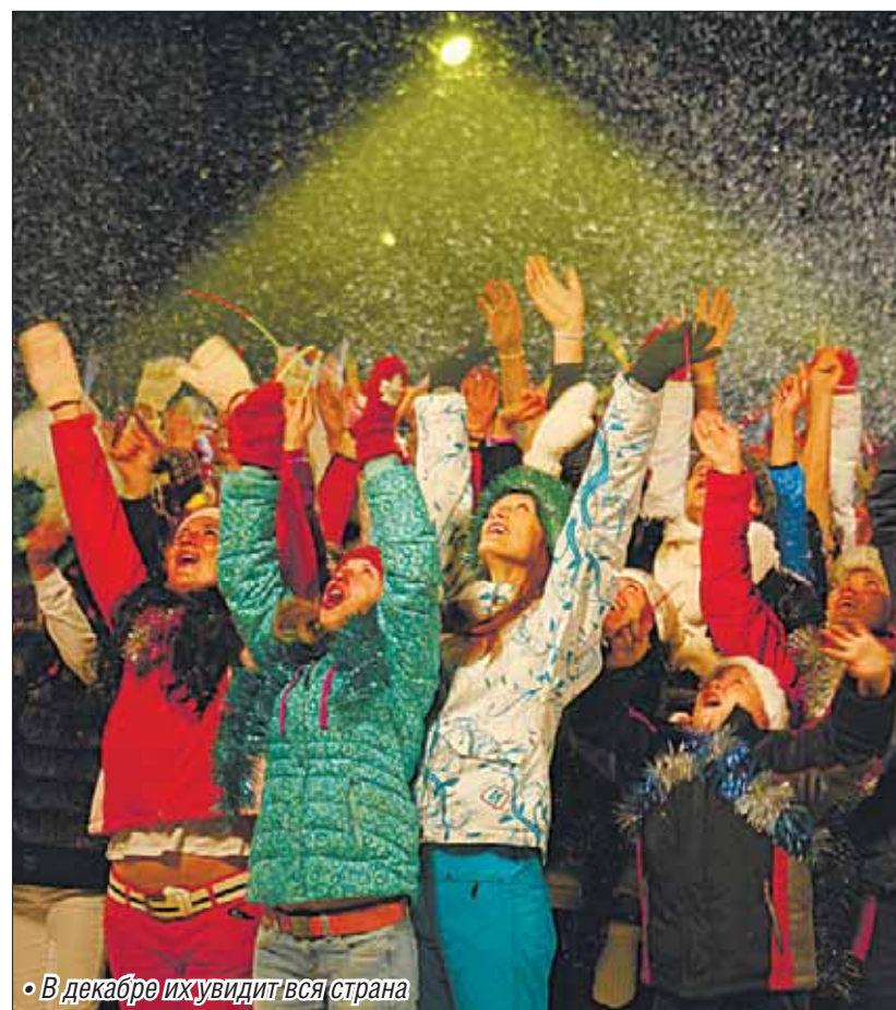
• В декабре их увидит вся страна