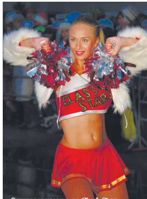
• Отличное настроение от «Classic Stars»