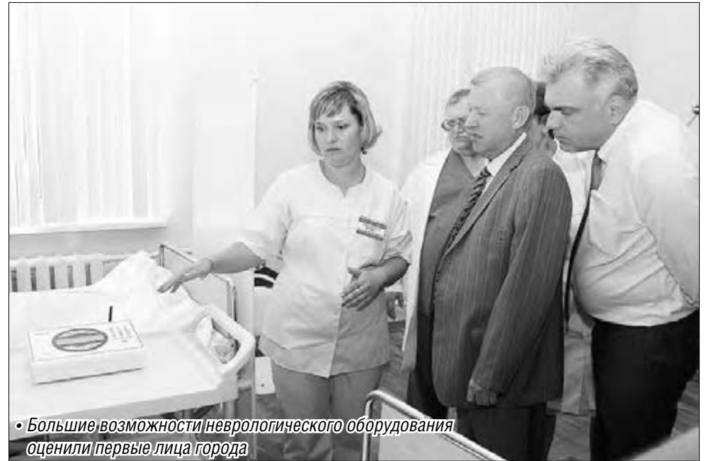
• Большие возможности неврологического оборудования оценили первые лица города

– Сегодняшнее событие – это первый шаг реализации программы модернизации, в рамках которой в 2014 году на базе медсанчасти будет открыт региональный сосудистый центр для лечения больных