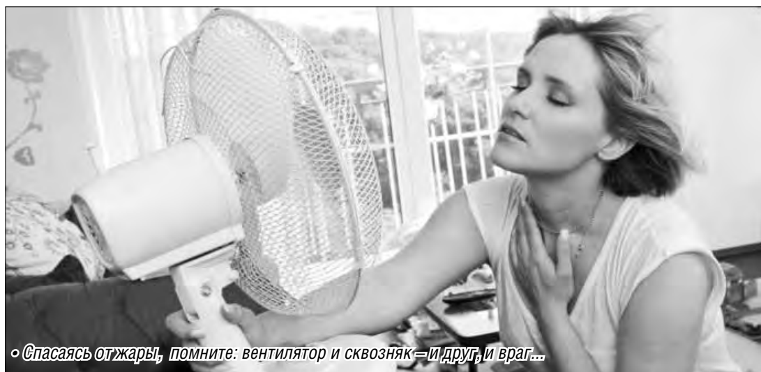
«Спасаясь от жары, помните: вентилятор и сквозняк – и друг, и враг...»

Общественный транспорт в жару превращается в филиал адского пекла