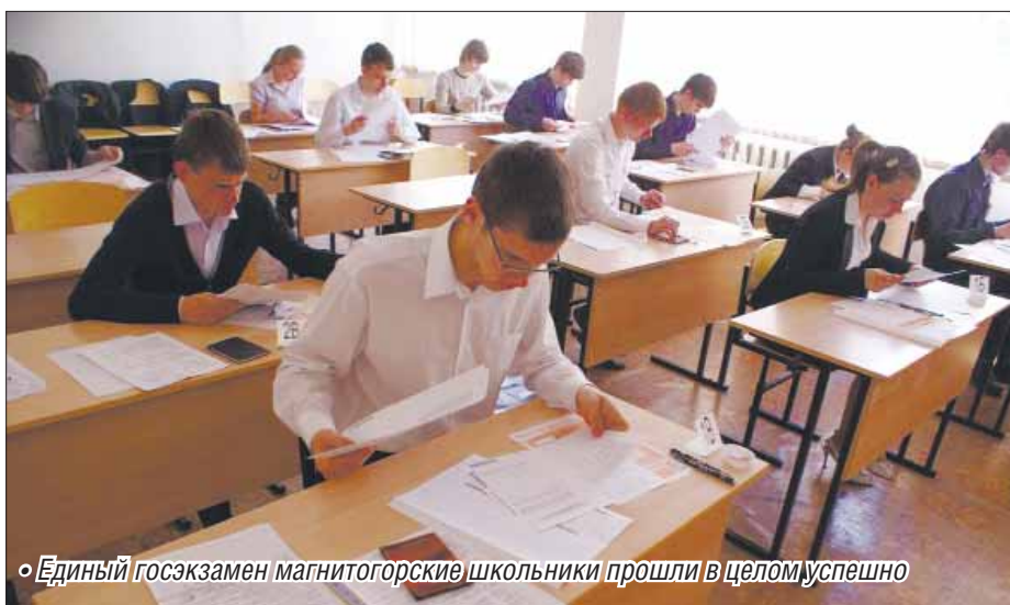
• Единый госэкзамен магнитогорские школьники прошли в целом успешно

25 выпускников Магнитки показали отличные результаты, получив 100 баллов на ЕГЭ. Больше всего стобалльников по химии – 13 и информатике – пятеро. Если брать итоги по Челябин-