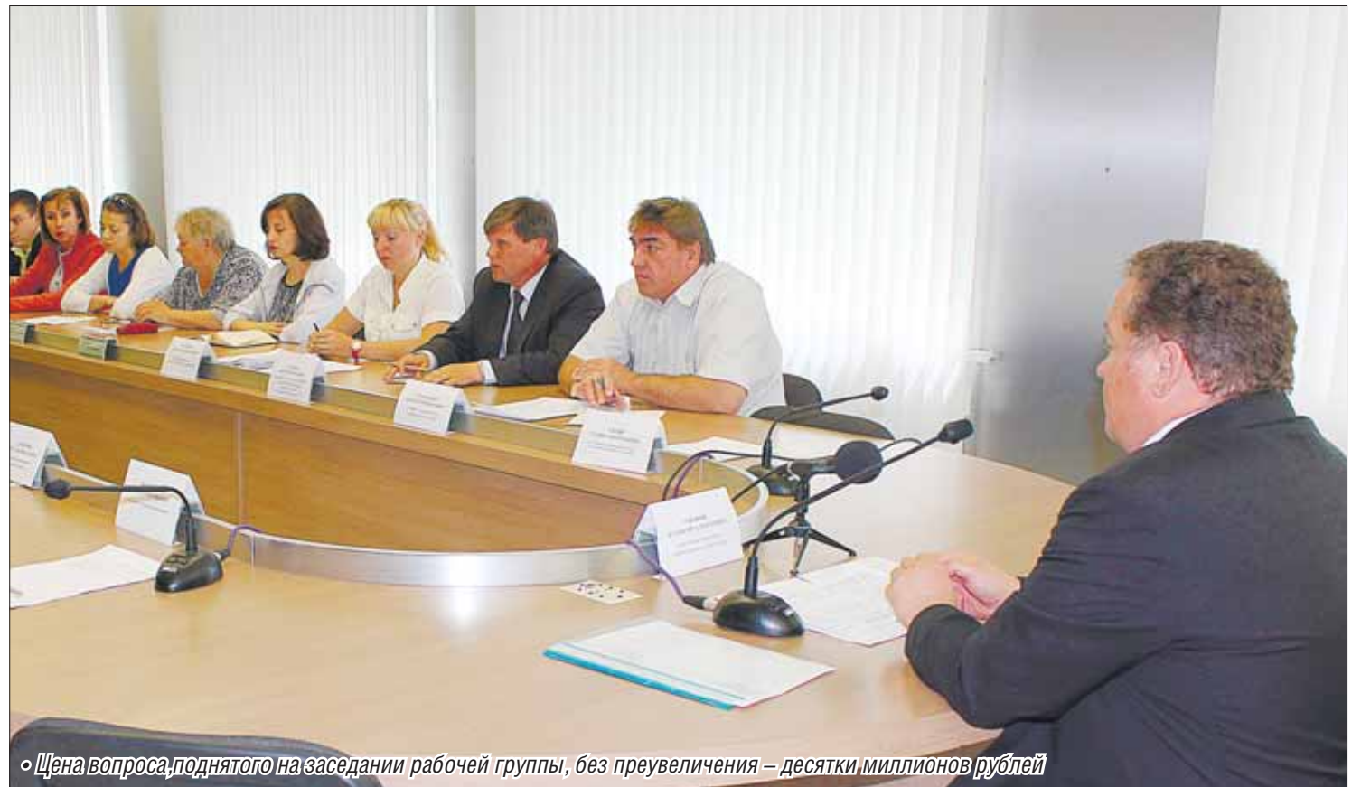
«Цена вопроса, поднятого на заседании рабочей группы, без преувеличения – десятки миллионов рублей»

В администрации города прошло очередное заседание рабочей группы по вопросам нарушения трудового законодательства и задолженности в бюджет.