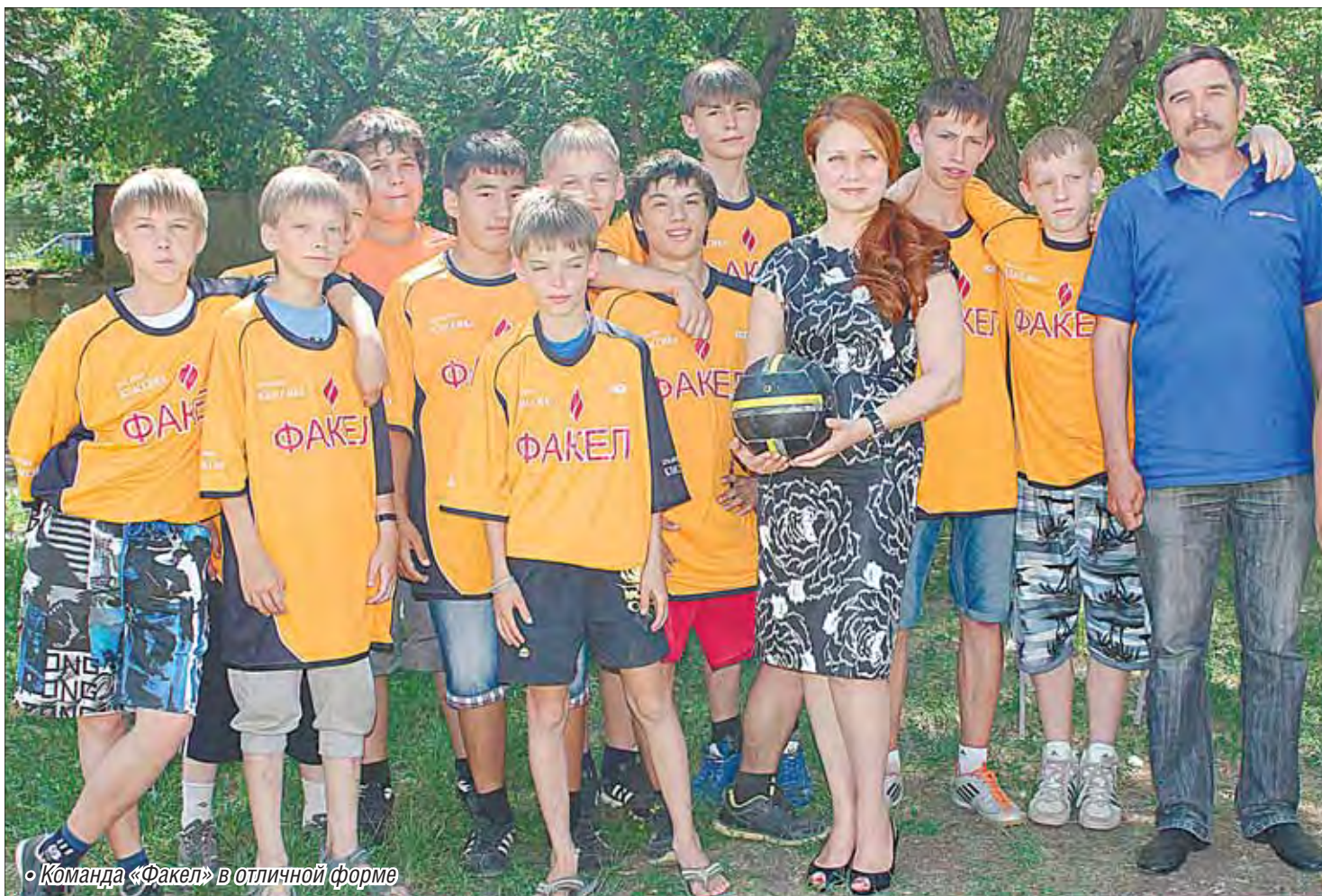
• Команда «Факел» в отличной форме

Одна из серьезных проблем, с которыми летом нередко сталкиваются родители: чем занять детей