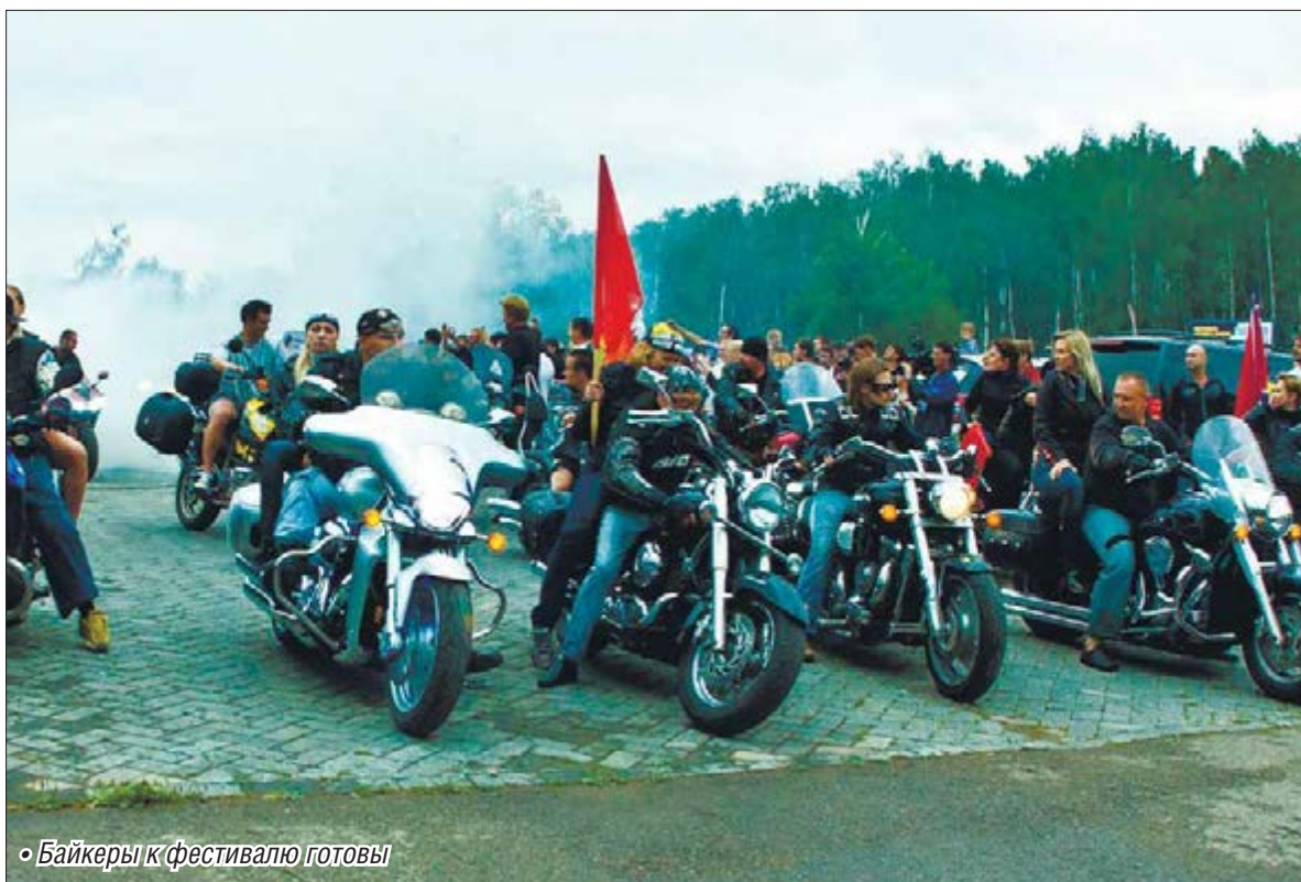
• Байкеры к фестивалю готовы

В половине пятого стартует спортивная часть фестиваля. На нескольких площадках можно будет увидеть представителей разных видов спорта. Веселые старты ждут любителей здорового образа жизни: развлекательная программа для семейных команд «Олимпийский резерв» – за лучшие выступления гарантируются призы. В 17 часов – показательные выступления спортсменов городских федераций по различным видам спорта, в 17.30 – велосипеди-