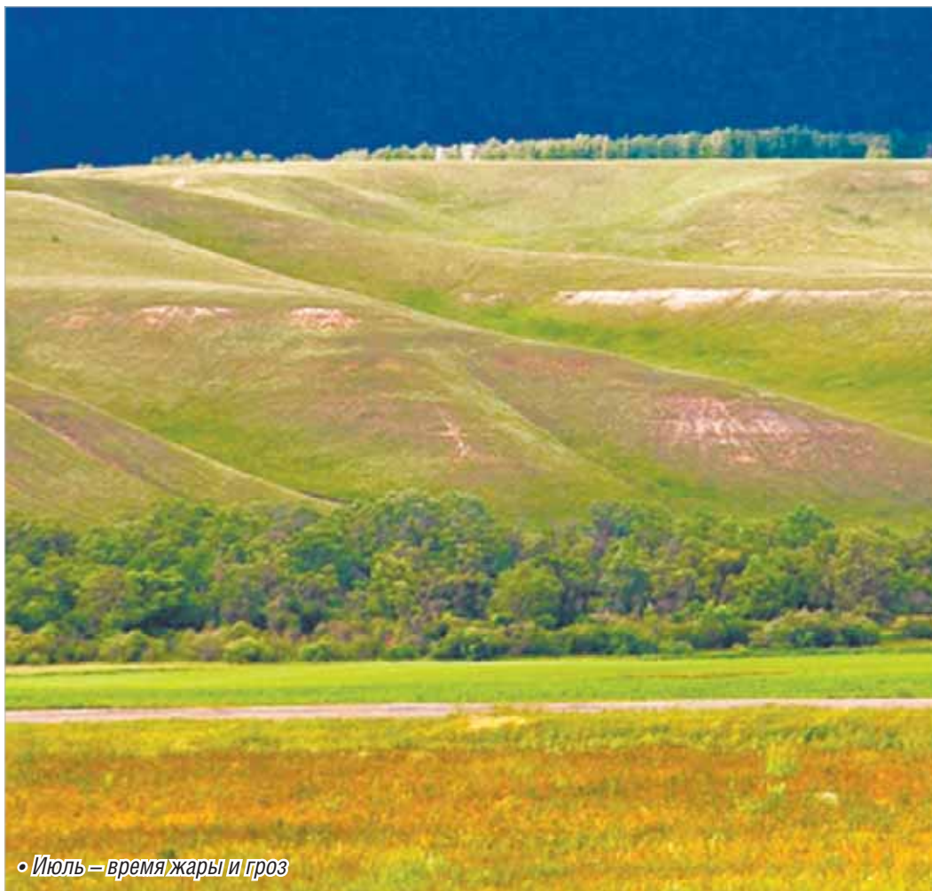
• Июль – время жары и гроз

6 июля по народному календарю – канун праздника Ивана Купалы. В этот день купание совершается в особо торжественной обстановке, с песнями. Купаются в реках, парятся в банях, употребляя при этом для исцеления от болезней лечебные и душистые травы, собираемые в этот же день или накануне. Считалось, что собранные с вечера и в ночь на