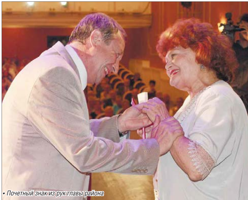
• Почетный знак из рук главы района

В этом году армия кавалеров Почетного знака Ленинского района пополнилась девятью именами. Среди них начальник отдела Центра повышения квалификации и информационно-методической работы Та-