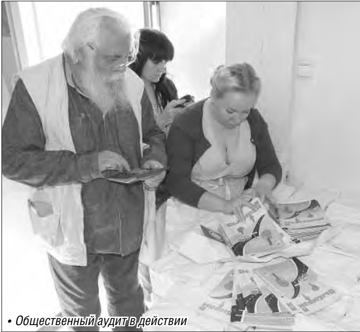
• Общественный аудит в действии

Тираж тринадцатого номера журнала «Выбирай соблазны большого города» пересчитали