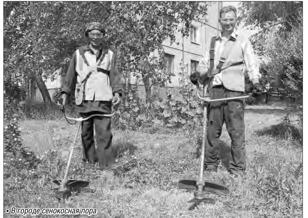
• В городе сенокосная пора

Еще одной темой обсуждения на аппаратном совещании стало потребление воды. То, что в жаркий период оно увеличивается со средних 150 до 160 тысяч кубометров в сутки – нормальное явление. Но уже который год в Магнитогорске существует проблема использования пожарно-питьевой воды для полива огородов в частном секторе – в левобережье, поселке Крылова. Запретить горожанам поливать свои посадки невозможно, выход один – искать возможности протянуть поливные водоводы. Поисковать эти возможности, просчитать,