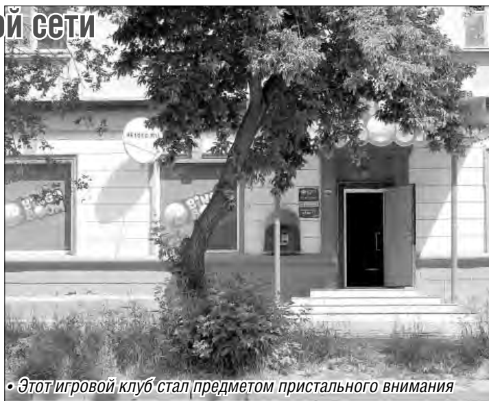
• Этот игровой клуб стал предметом пристального внимания