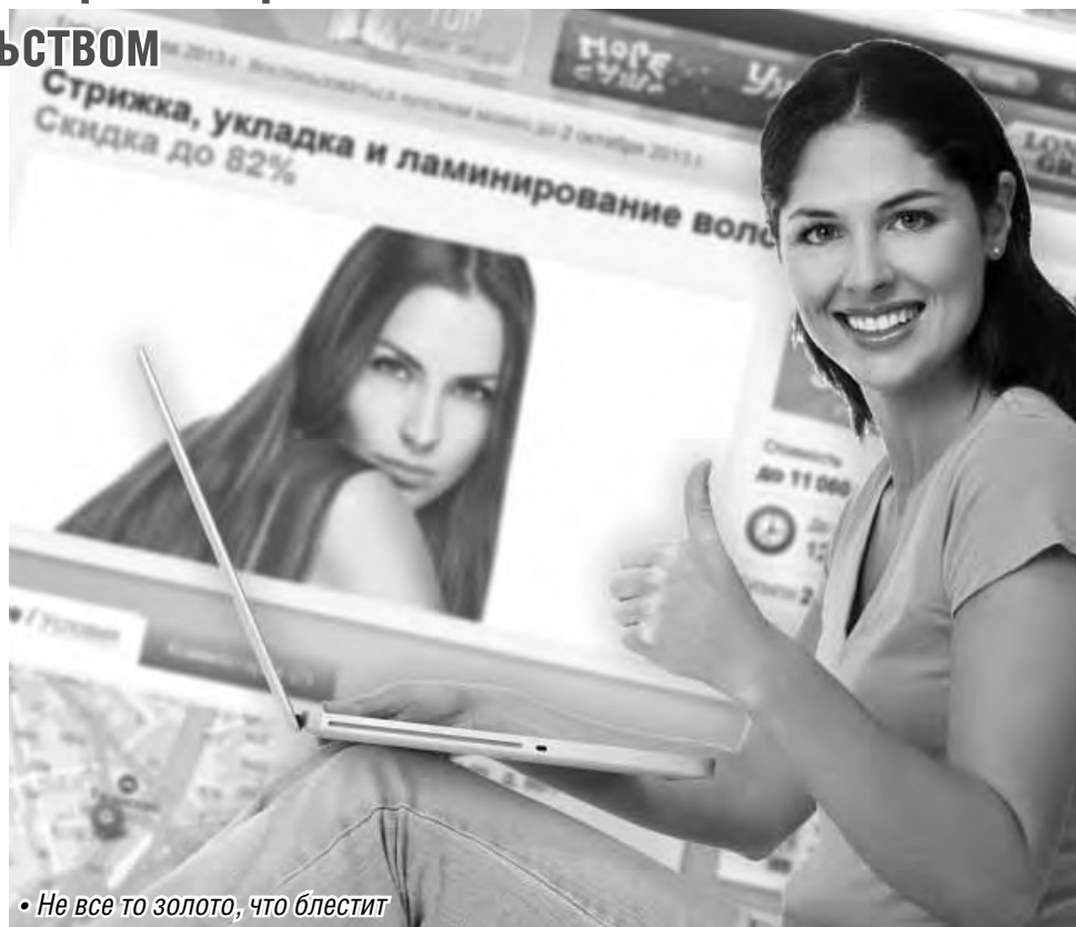
• Не все то золото, что блестит

– Купил купон на мойку автомобиля. Связался со специалистами мойки, согласовали время. Приехал – все отсеки за-