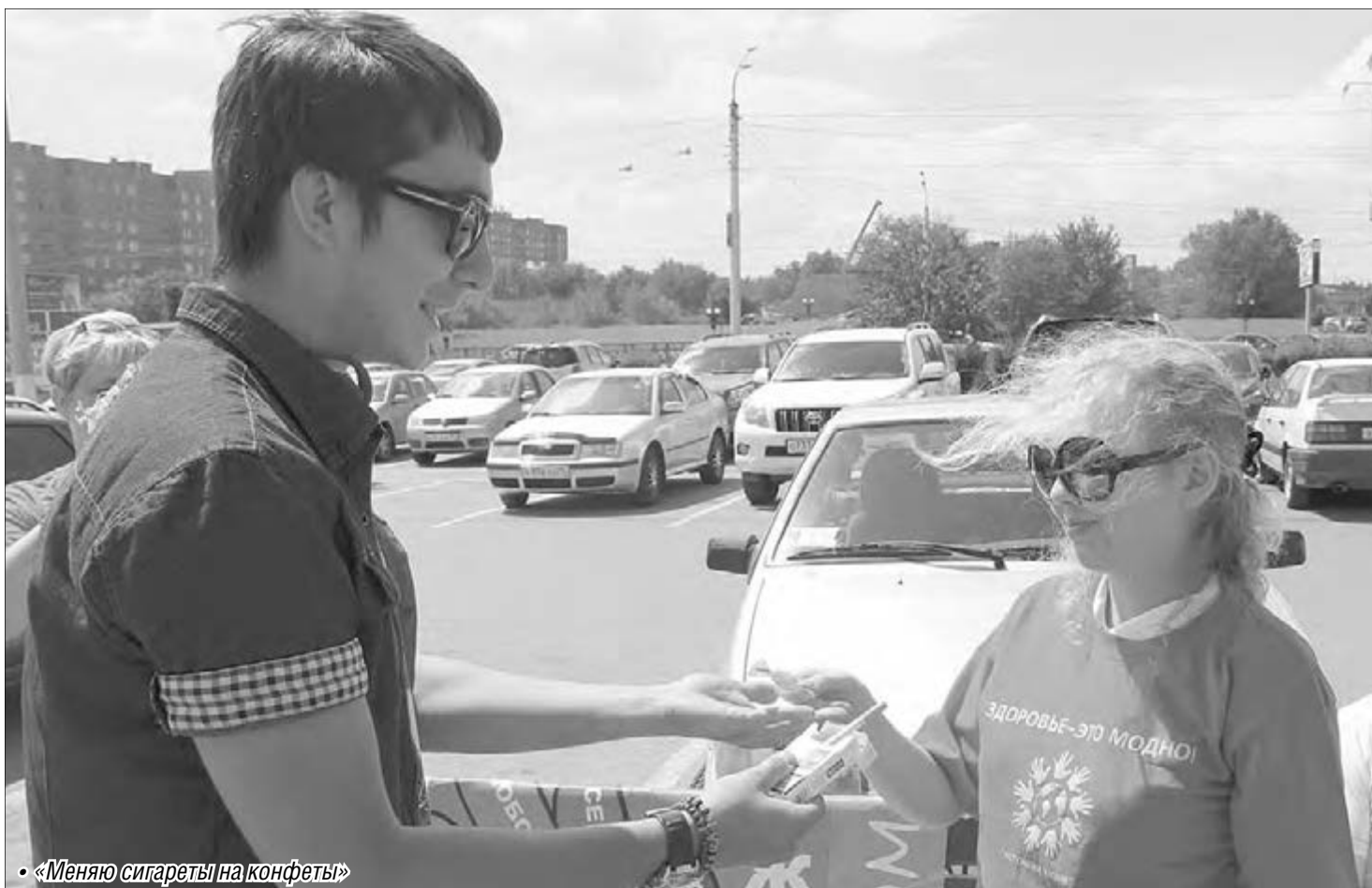
• «Меняю сигареты на конфеты»

В Магнитогорске День борьбы против употребления наркотиков отметили широкой пропагандистской деятельностью