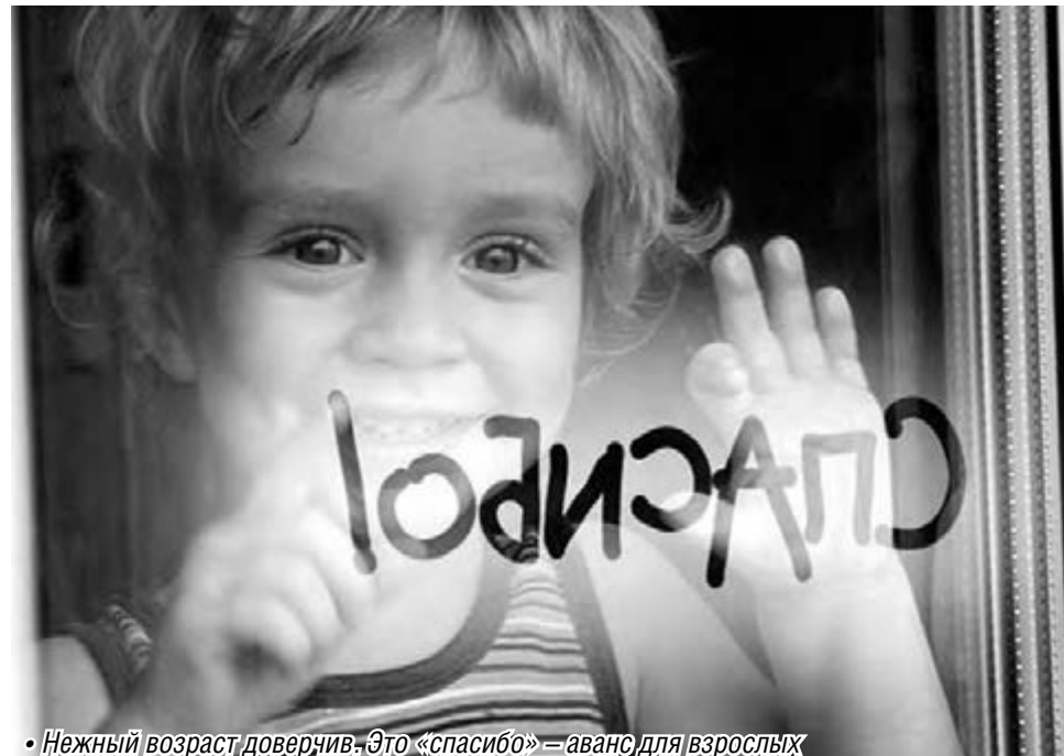
• Нежный возраст, доверчив. Это «спасибо» – аванс для взрослых

Главное изменение: создан специализированный жилой фонд, который призван охранять сирот от возможности попасть на уловки мошенников. По данным статистики, которые привела Ирина Михайленко, около 60 процентов детей-сирот лишаются жилья в первый год жизни в предоставленном жилье. По незнанию ребята меняют квартиры, отдают их в залог. В результате