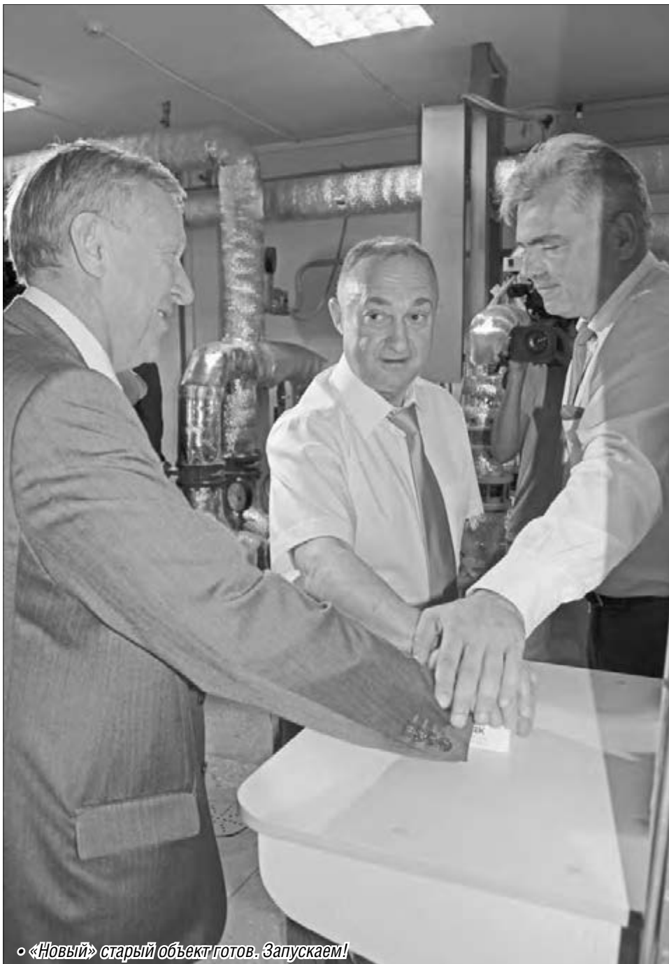
• «Новый» старый объект готов. Запускаем!