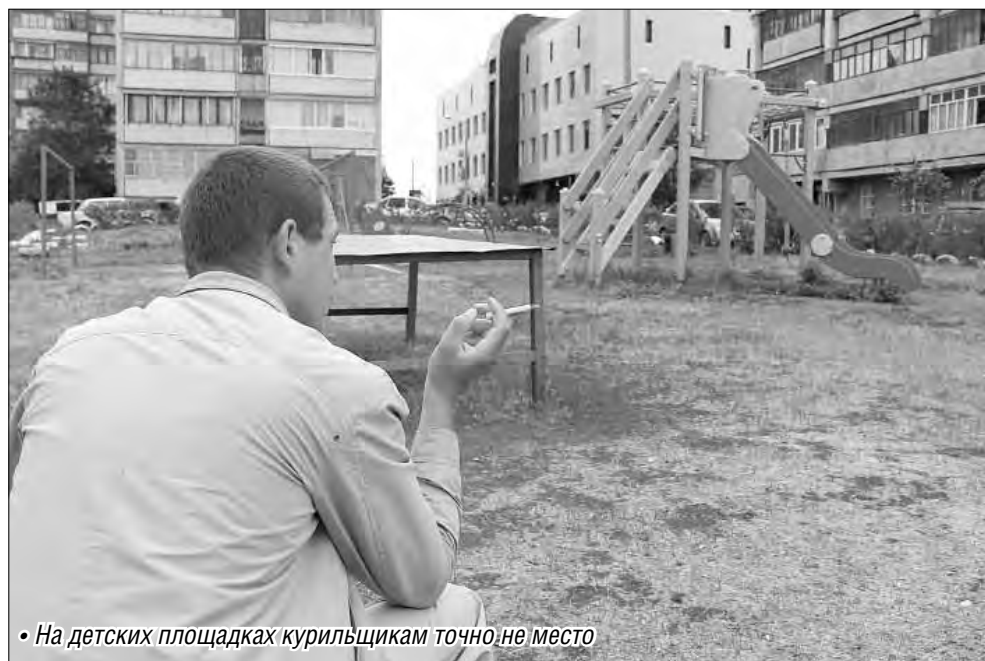
• На детских площадках курильщикам точно не место

В перечень попали вокзал и аэропорт. У входа в «железнодорожные ворота» города останавливается полицейский. Спрашиваем, нарушают ли наши граждане запрет на курение. Отвечает: на территории вокзала редко кто осмеливается закурить, но вот бороться с вредной привычкой среди посетителей аэропорта еще приходится. «А сами-то вы где курите?» – спрашиваем стража порядка, заметив в его руке зажигалку. «А я не курю», – уверенно отвечает полицейский. Оглядываемся по сторонам: на