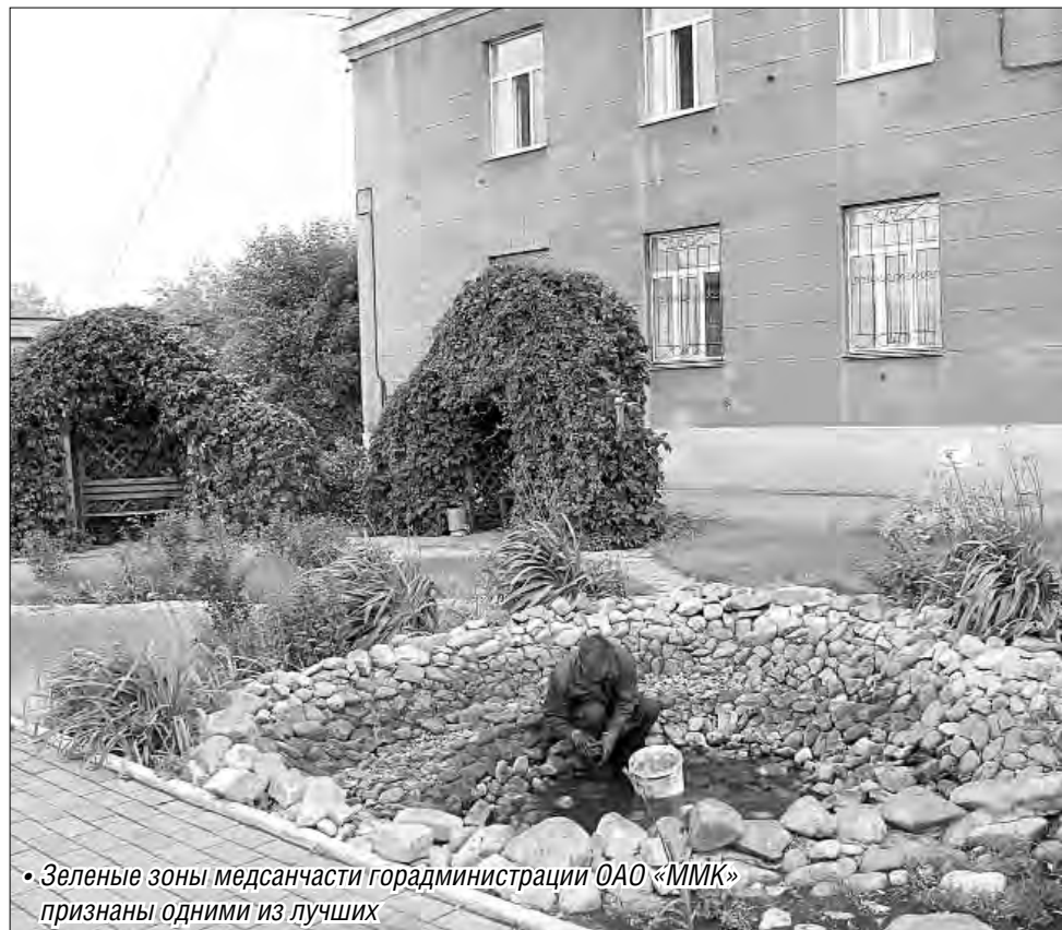
• Зеленые зоны медресанчасти горадминистрации ОАО «ММК» признаны одними из лучших

После чего глава города и спикер МГСД перешли к приятной миссии. В Магнитогорске весной состоялся смотр-конкурс «Чистый город». Провели смотр впервые, а участие в нем приняли не только организации, но и обычные горожане. На базе районных администраций пристально следили за этапами конкурса, а на прошлой неделе подвели итоги. В каждой из номинаций бы-