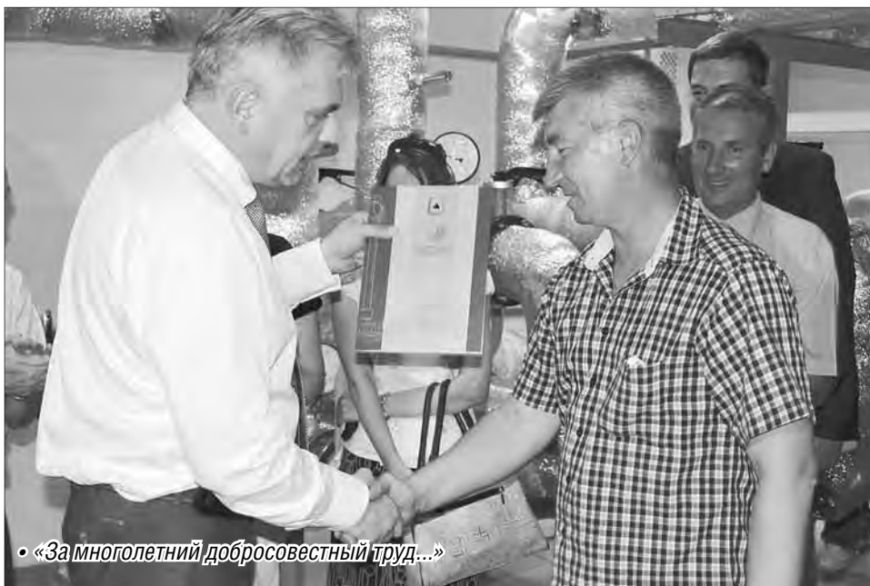
• «За многолетний добросовестный труд...»