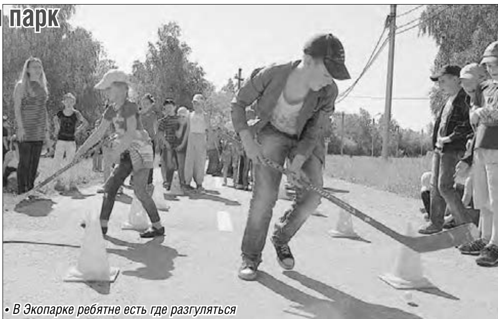
• В Экопарке ребятей есть где разгуляться