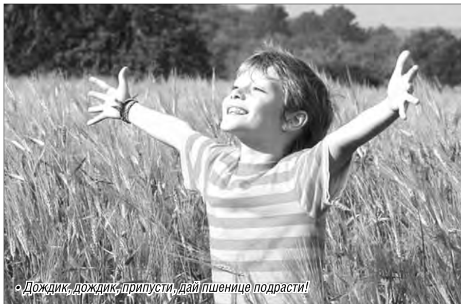
• Дождик, дождик, пропусти, дай пшенице подрасти!

Между тем среднемесячная температура воздуха в мае у нас была на один градус выше многолетней нормы в плюс 12,3 градуса – такое заключение поставили специалисты Магнитогорского метеобюро. Дневные максимальные температуры воздуха колебались в пределах от 11,5 (19 мая) до 29,3 градуса (27 мая). Последний заморозок в воздухе и на почве в минус два градуса был отмечен 23 мая. В остальное время минимальные ночные температуры воздуха изменялись в пределах от минус 0,8 градуса (1 мая) до плюс 14,1 градуса (31 мая). Одиннадцать майских дней были с осадками, один день – с грозой (17 мая). В целом за месяц выпало 17 мм осадков, что составило 49 процентов месячной нор-