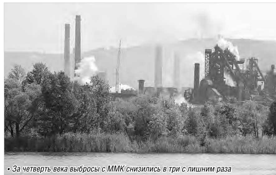
• За четверть века выбросы с ММК снизились в три с лишним раза

Сегодня – Всемирный день охраны окружающей среды