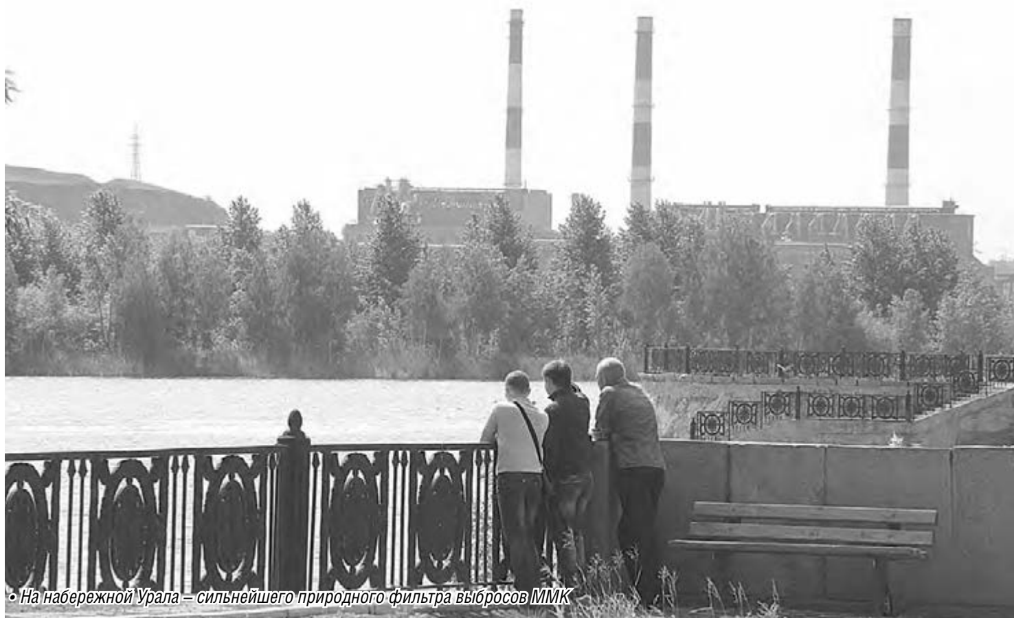
• На набережной Урала – сильнейшего природного фильтра выбросов ММК

Сегодня – Всемирный день охраны окружающей среды