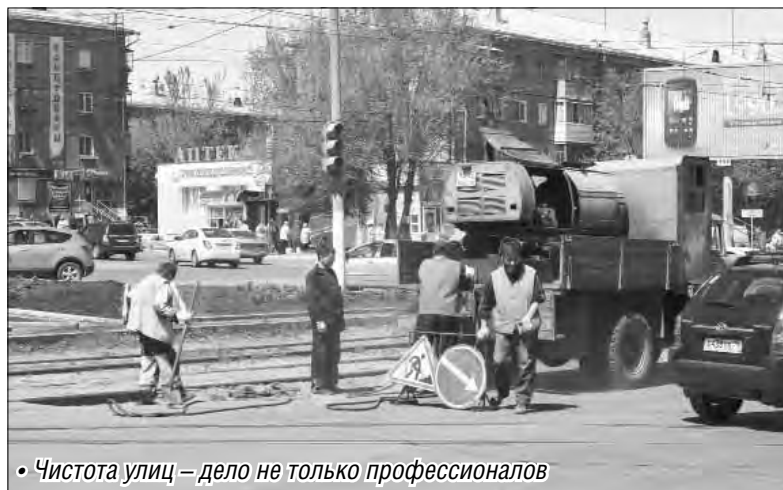
• Чистота улиц – дело не только профессионалов