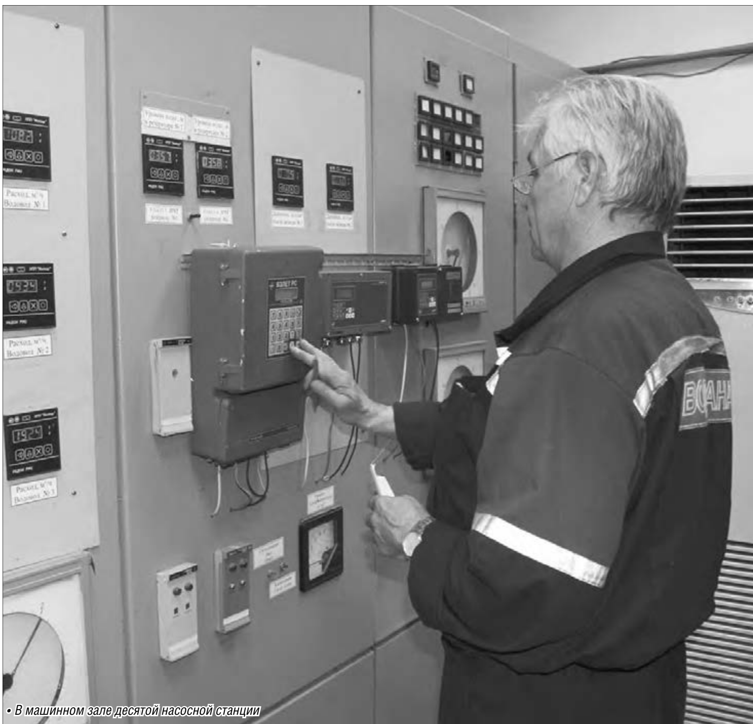
• В машинном зале десятой насосной станции

Руководство треста «Водоканал» запланировало глобальную реконструкцию на десятой насосной станции