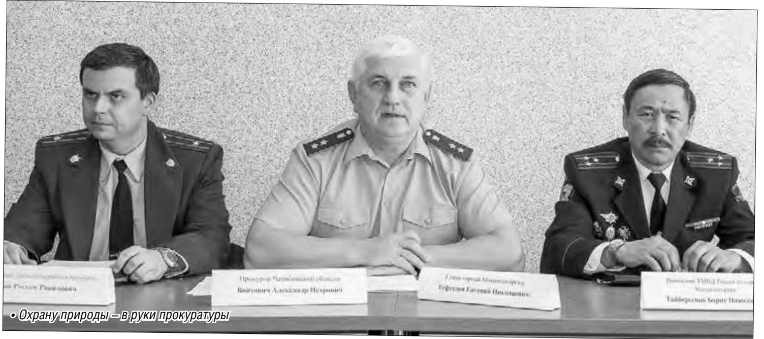
• Охрану природы – в руки прокуратуры

Прокурор Челябинской области побывал в Магнитогорске со специальной миссией