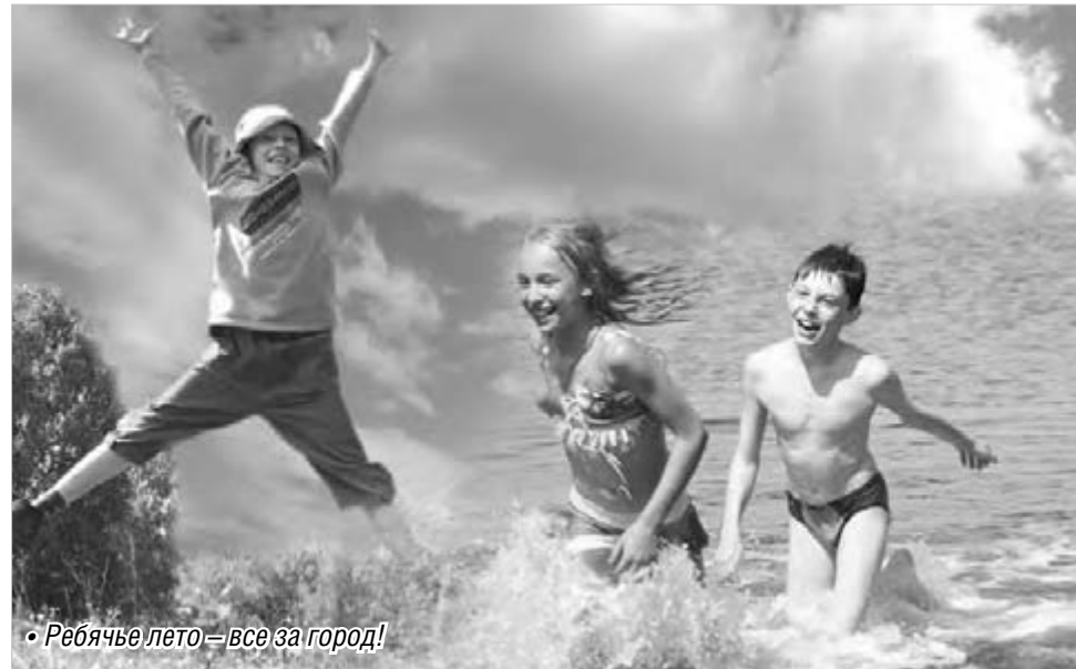
• Ребячье лето – все за город!

Загородные базы отдыха практически готовы к заезду юных магнитогорцев