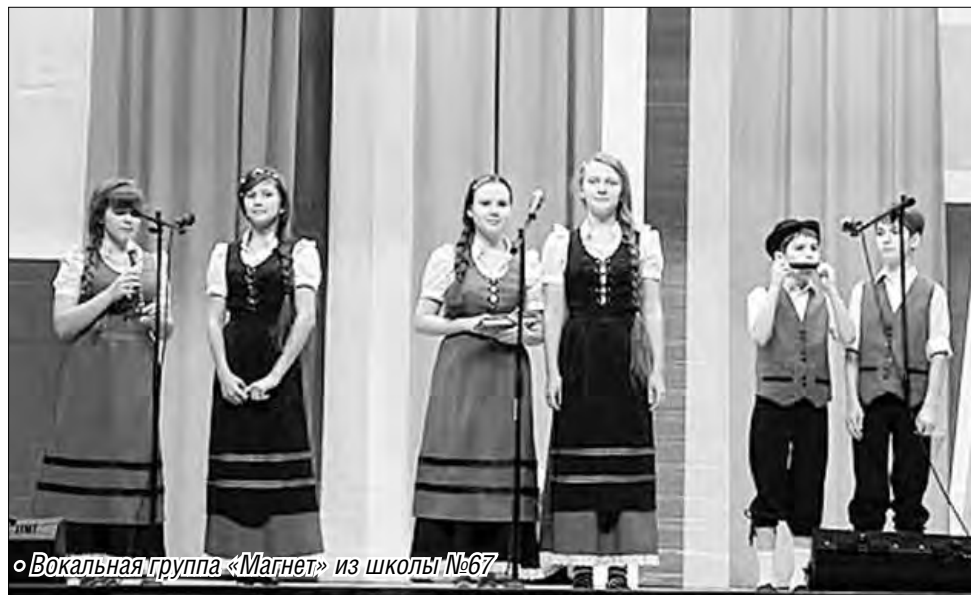
• Вокальная группа «Мagnet» из школы №67