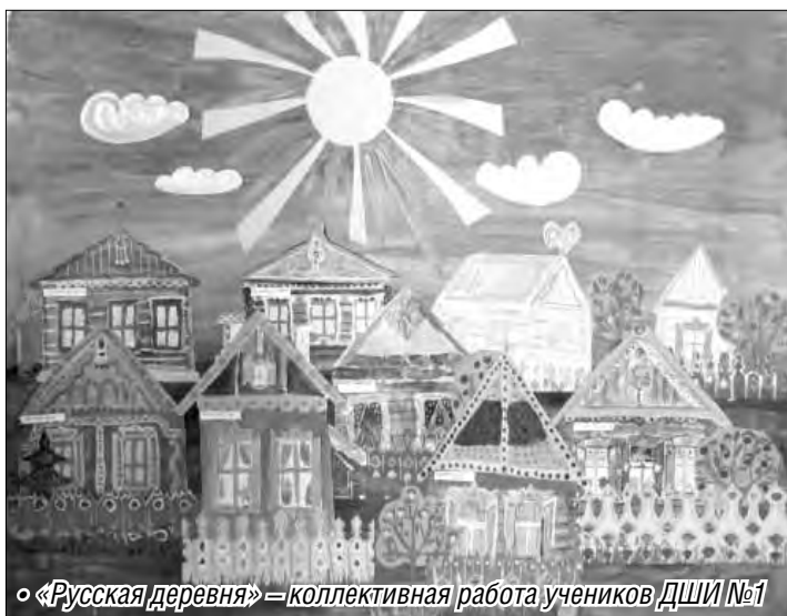
«Русская деревня» – коллективная работа учеников ДШИ №7

От детской кисти и карандаша Дни славянской культуры постепенно переходят и в другие свои формы. Это тематические стенды в библиотеках, конкурсы и праздники на-