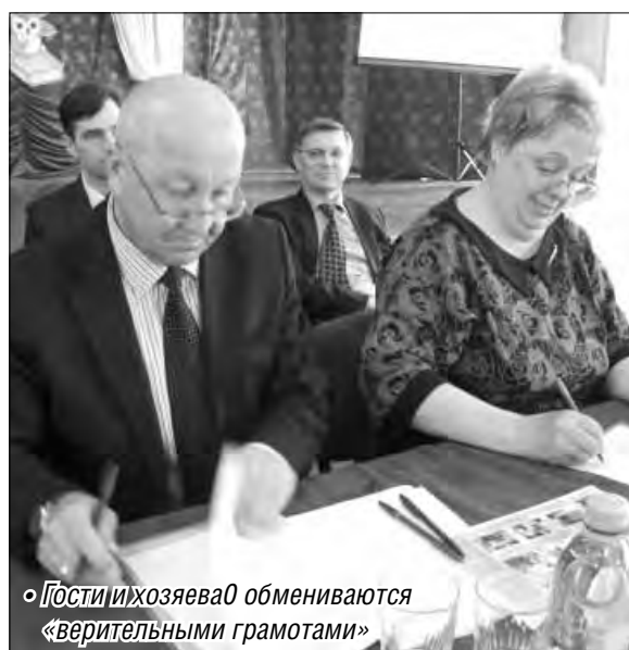
• Гости и хозяева обмениваются «верительными грамотами»

Вопросов с трудоустройством у выпускников технических специальностей, как правило, не возникает. В этом году в МГТУ на высшее образование будут принимать