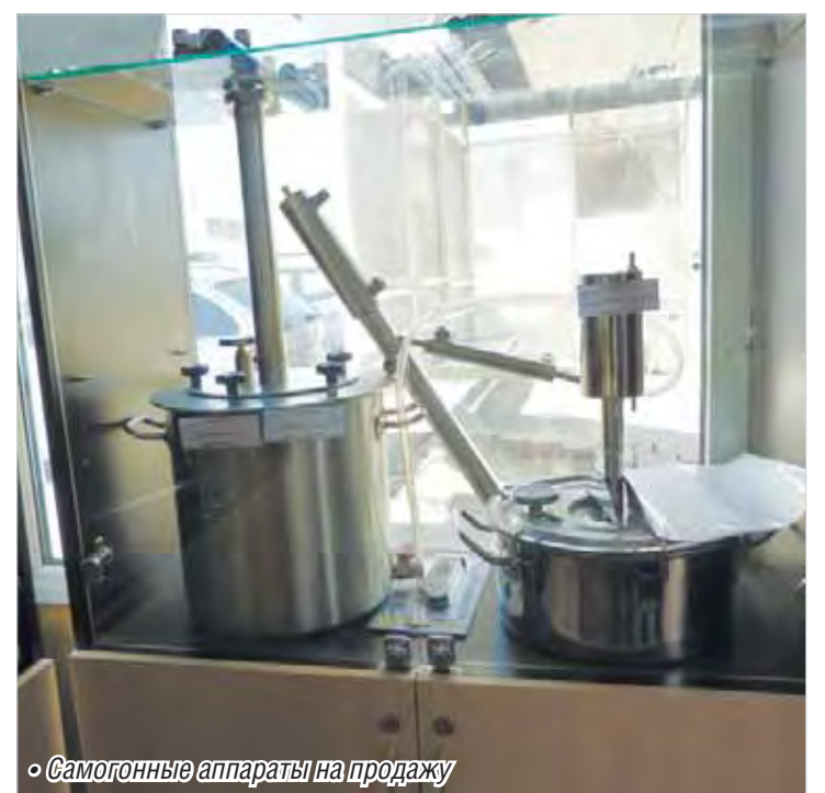
• Самогонные аппараты на продажу

Помимо этого представлен большой ассортимент сопутствующей продукции: спиртометры,