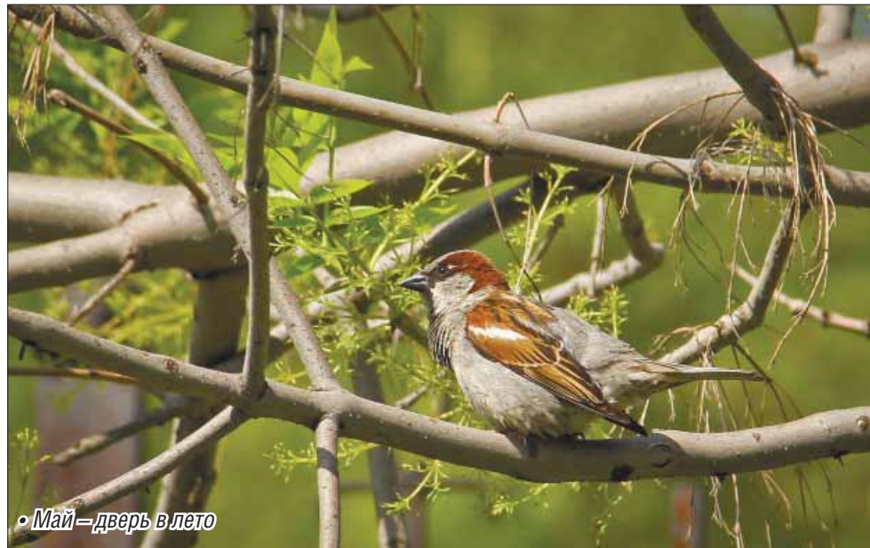
• Май – дверь в лето

Характер последнего месяца весны в этом году напоминает нрав капризной девушки