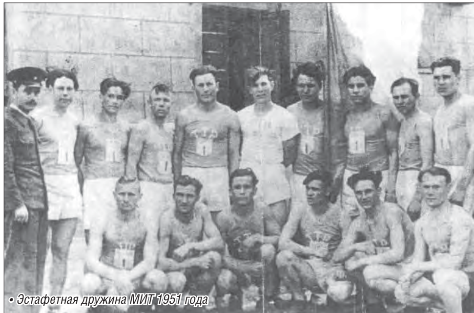
• Эстафетная дружина МИТ 1951 года