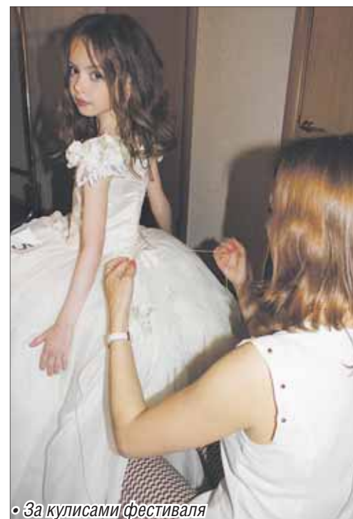
• За кулисами фестиваля