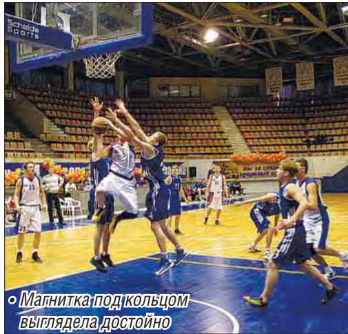
Магнитка под кольцом выглядела достойно

По итогам финала дивизиона УрФО чемпионата России по баскетболу среди мужских команд первой лиги второе место у сборной ММК, третье – у «молодежки» БК «Магнитогорск». Второй год на первом месте баскетбольный клуб «BRG Basket» из Березовского.