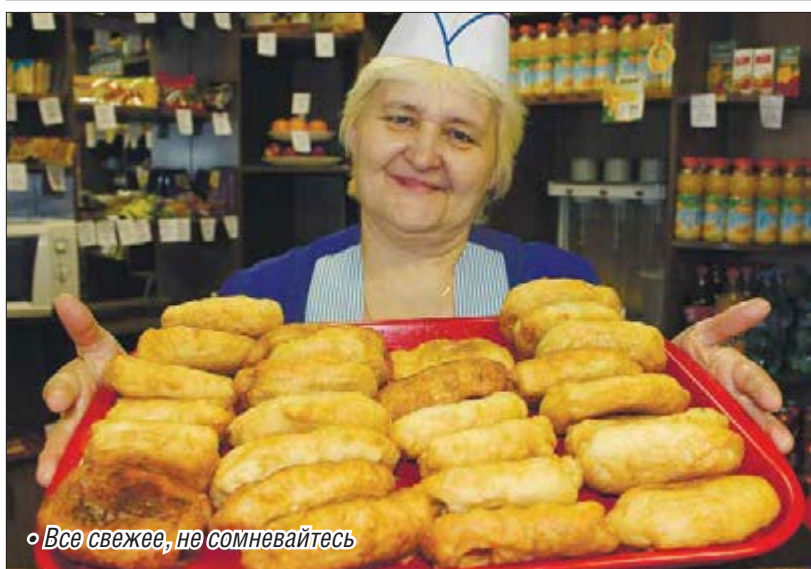
• Все свежее, не сомневайтесь