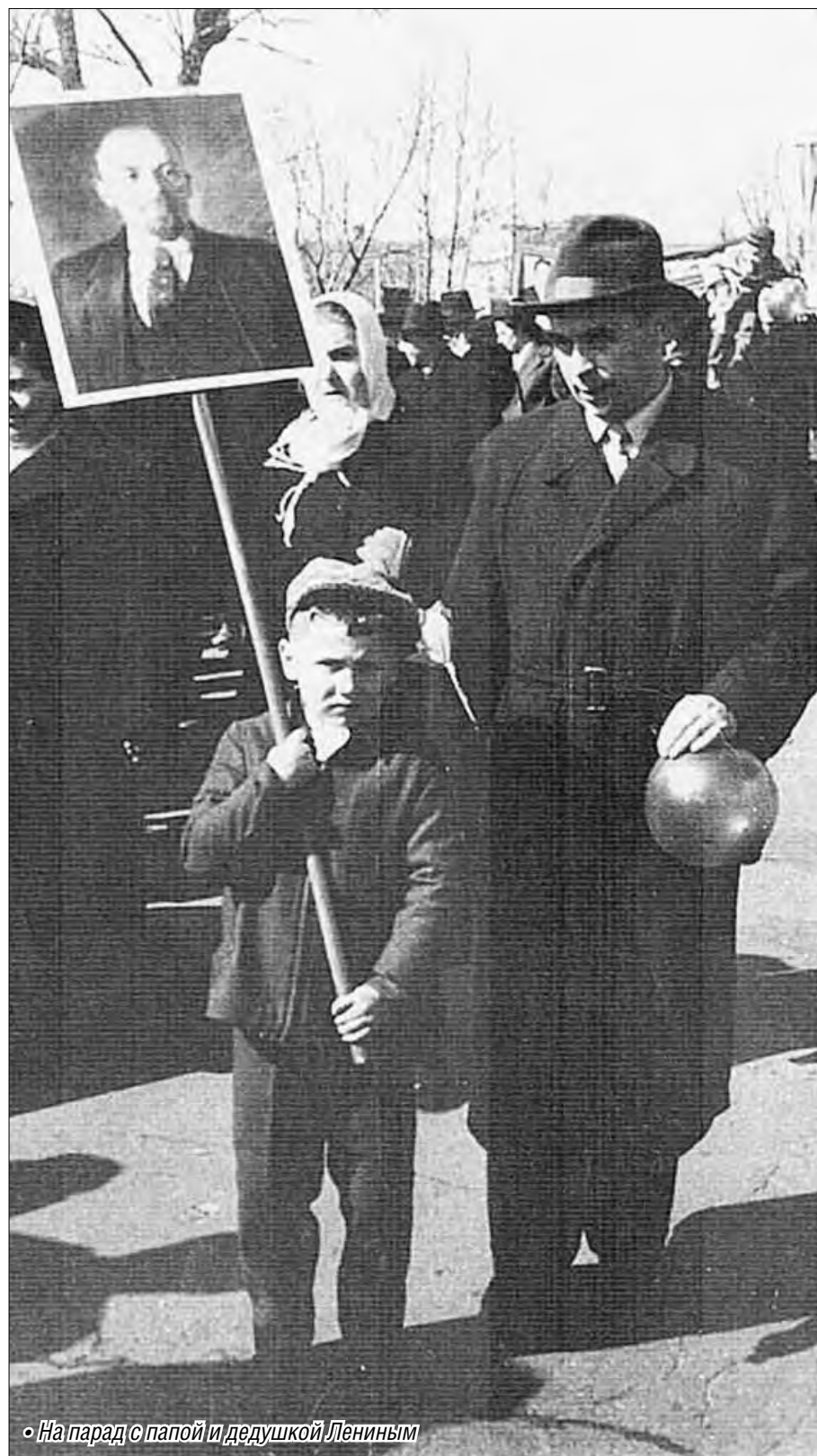
• На парад с папой и дедушкой Лениным