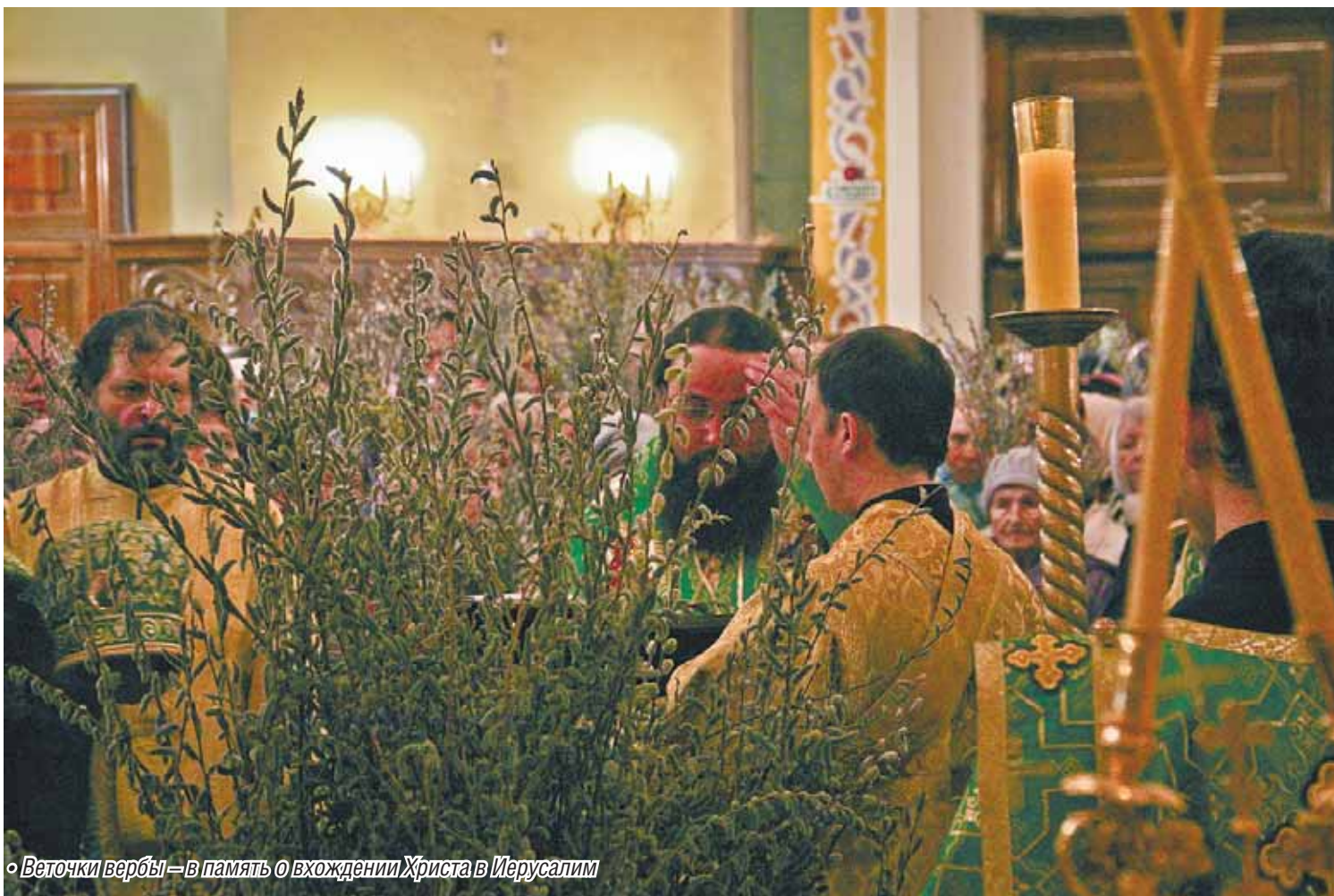
«Веточки вербы» — в память о вхождении Христа в Иерусалим

В последнее воскресенье перед Пасхой верующие рекой текли в храм Вознесения Господня.