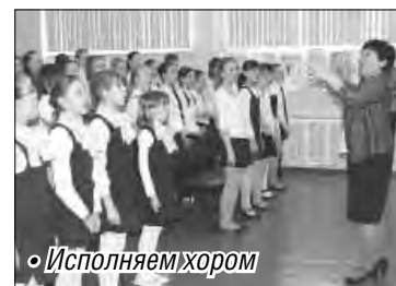
◦ Исполняем хором

Это не битва хоров и не смотр-конкурс, призванный определить лучшую певческую команду определенной школы.