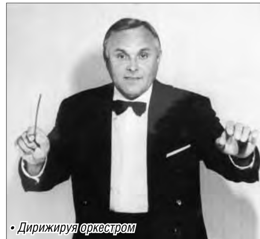
• Дирижируя оркестром