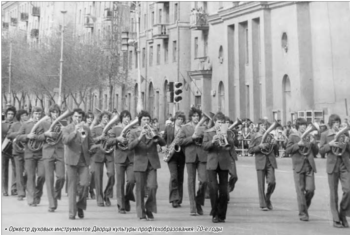
• Оркестр духовых инструментов Дворца культуры профтехобразования. 70-е годы

По главным улицам города на Первомай шли организации со своими собственными оркестрами