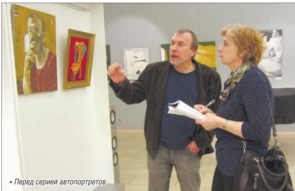
• Перед серией автопортретов