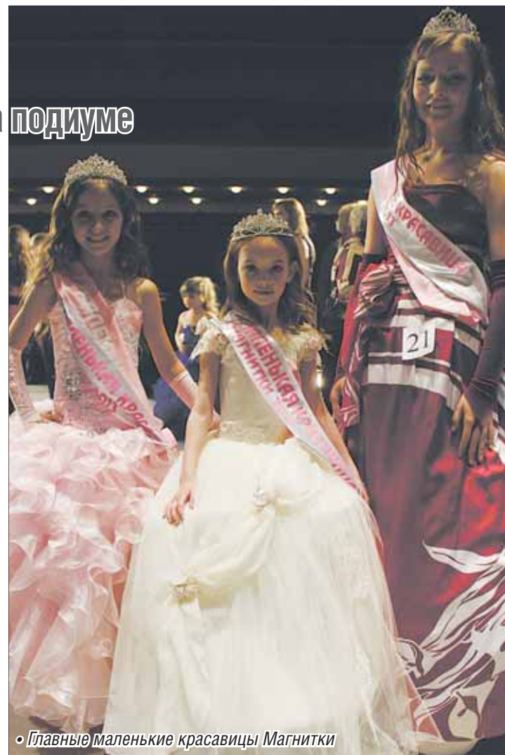
• Главные маленькие красавицы Магнитки

Отблестала «Жемчужина Магнитки», следом состоялся финальный отборочный тур для участия в национальном конкурсе «Краса России-2013». И вот очередной проект. Во Дворце культуры металлургов им. С. Орджоникидзе проведен фестиваль обаяния в детском варианте – «Маленькая красавица Магнитки». 28 участниц распределили по трем категориям: с пяти до восьми лет, средняя возрастная группа с 8 до 12 и, соответственно, старшая от 12 до 14.