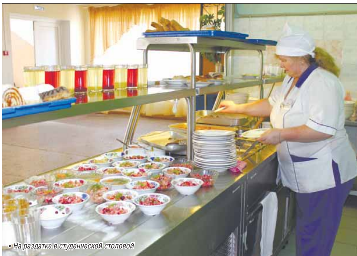
• На раздатке в студенческой столовой

Общественные «столовки» издавна у нас были притчей во языцех