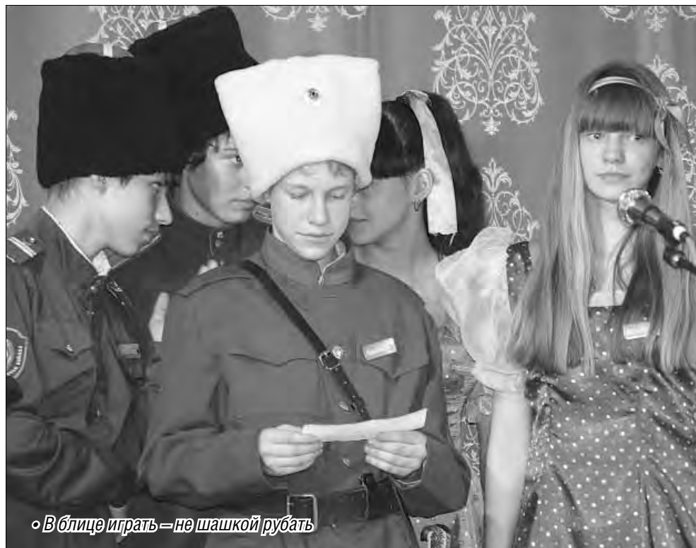
◦ В близе играть – не шашкой рубать