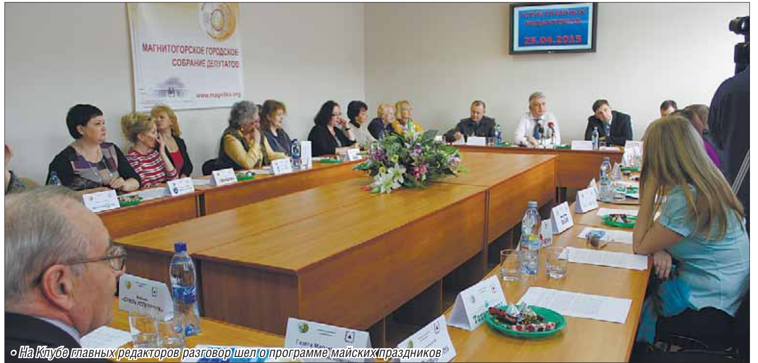
• На Клубе главных редакторов разговор шел о программе майских праздников

Так уж повелось, что мы не мыслим последний весенний месяц без праздников