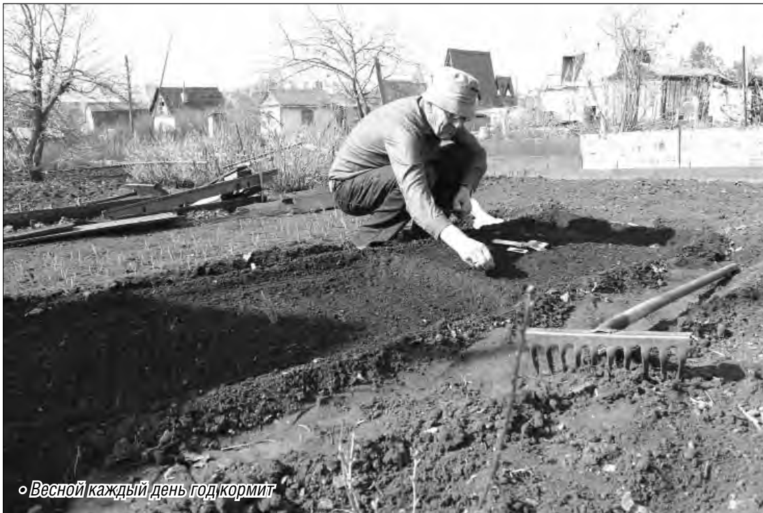
«Весной каждый день год кормит»

Сейчас самое время для появления на поверхности зелененьких стрелочек озимого чеснока. На моем участке они уже проклюнулись, да и у коллег тоже - повезло с зимой, она была не очень морозной и многоснежной, потому чеснок и не пострадал. А ростки его не боются небольших минусовых температур - помните, как мы сажали его осенью, когда уже пальцы мерзли? Пора продолжить начатую работу. Если вы хотите получить большие урожаи полезных остреньких зубчиков, нужно действовать уже сейчас. Начинать следует с рыхления почвы, чтобы на земле не образовалась корка. После этого замульчируйте почву пере-