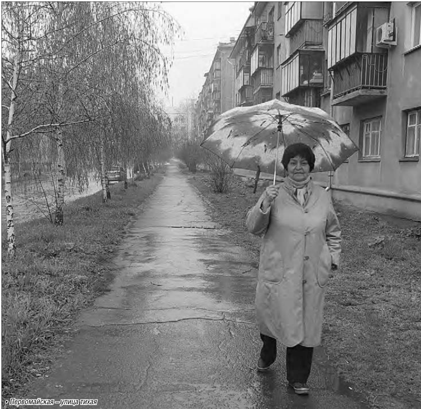
• Первомайская — улица тихая

Всегда интересно узнавать, откуда, когда, почему родилось то или иное название улицы. Хотя часто мы и не задумываемся над тем, в честь кого или чего получили они свое имя. Что касается улицы Первомайской, то тут вроде бы все понятно — привязка к празднику Весны и Труда вполне читается и без дополнительных объяснений. И все же оказалось, что докопаться до первоисточника — самой истории возникновения в городе этой улицы, не так то и просто.