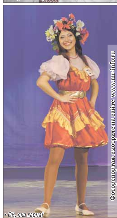
• Ой, яка гарна!