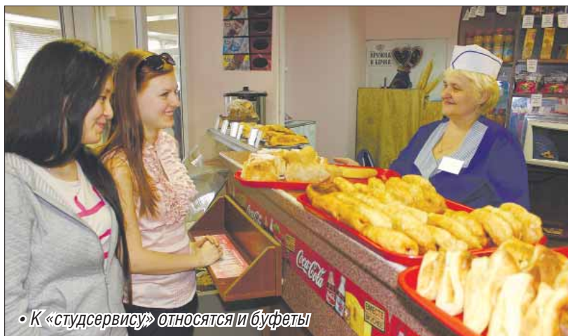
• К «студсервису» относятся и буфеты