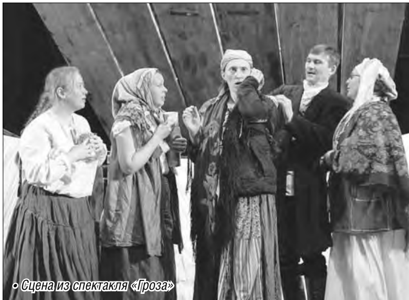
◦ Сцена из спектакля «Гроза»

5 мая в зале Магнитогорского театра оперы и балета дети смогут посмотреть сказку «День рождения кота Леопольда». Забавная история про мышью и доброго кота начнется в 12 часов. Через пару дней, 7 мая состоится выступление уже для тех, кто постарше. При поддержке управления культуры администрации Магнитогорска и РБК-ТВ в оперном театре пройдет концерт «Музыка Вселенной». Два интересных исполните-