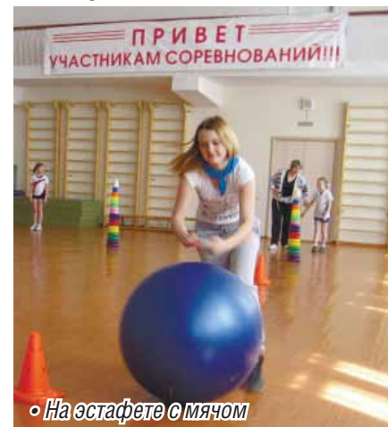
◦ На эстафете с мячом

В городе проходит смотр-конкурс среди детских клубов по месту жительства «Семья и социум».