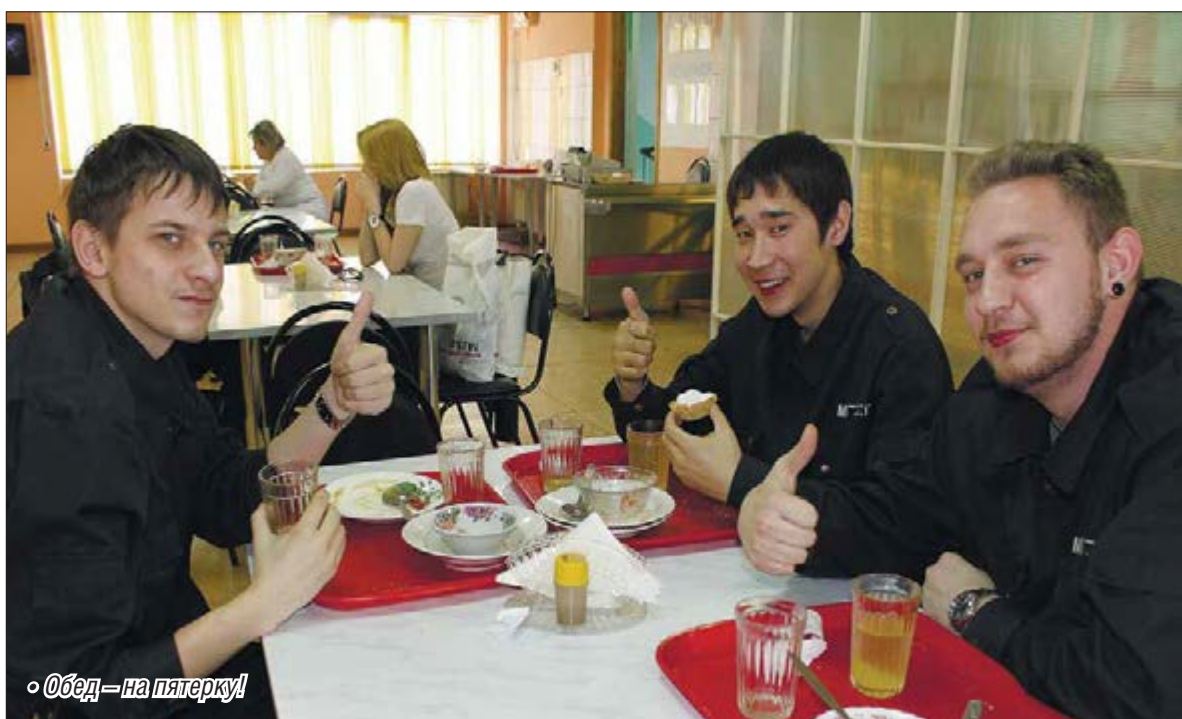
• Обед – на пятерку!