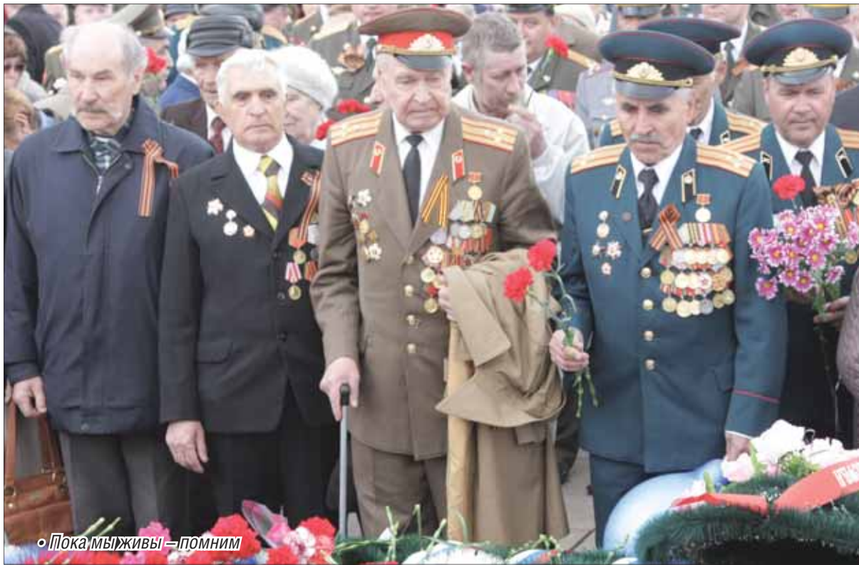
«Пока мы живы – помним»

В Магнитогорске началась подготовка к торжественной акции «Маршрут памяти»