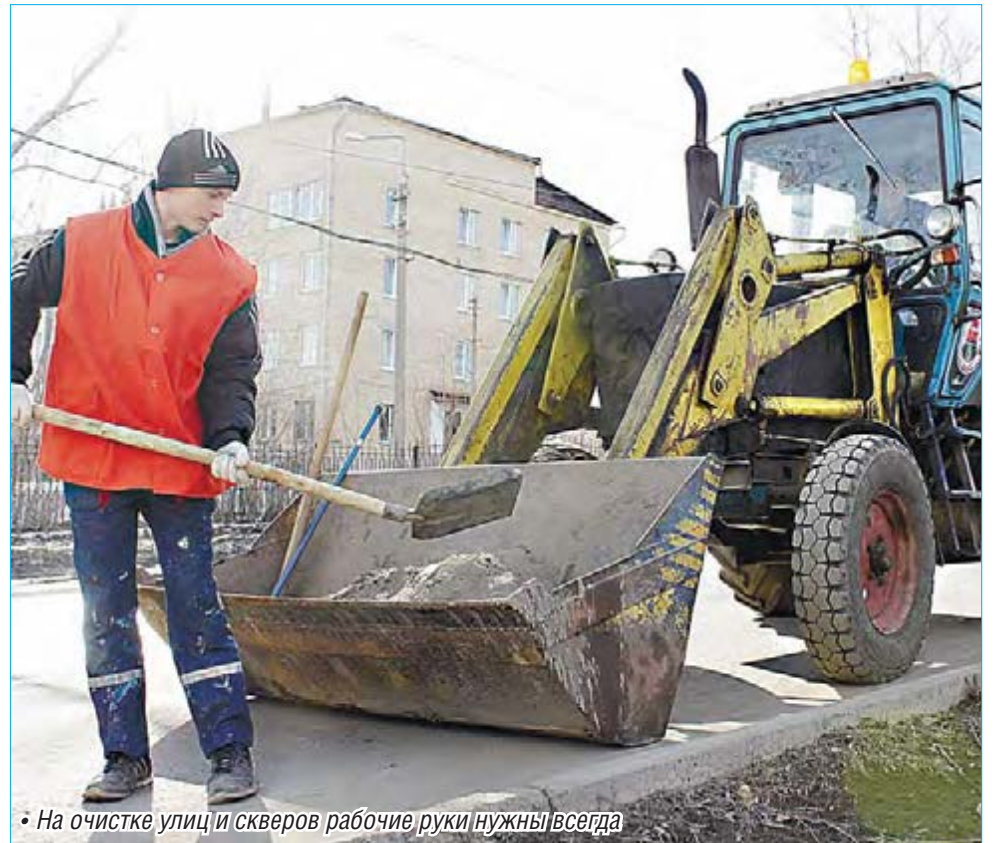
• На очистке улиц и скверов рабочие руки нужны всегда