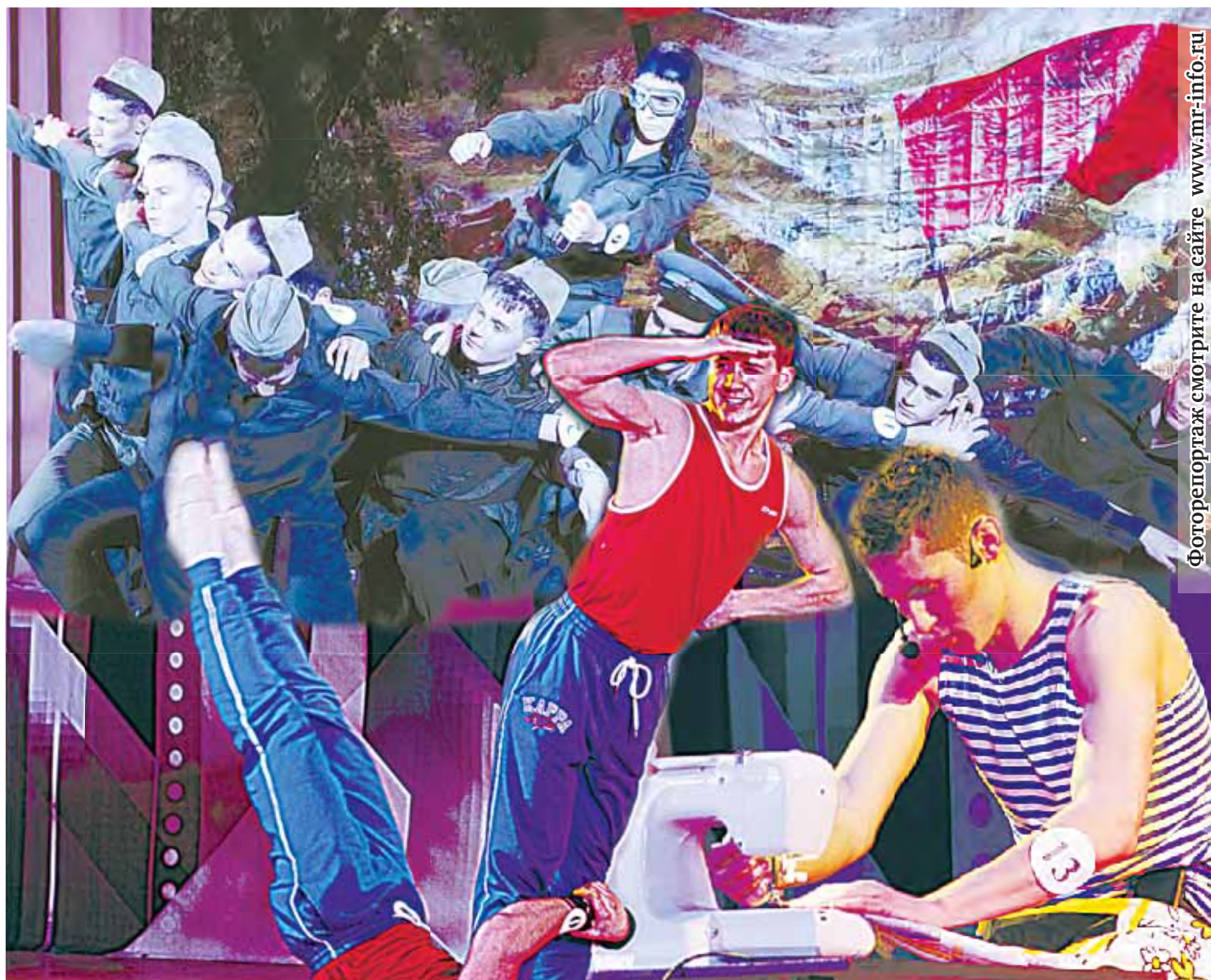
Фотоотчет смотрите на сайте www.mr-info.ru

Это зрелище заслуживало большего: зала вместительней и зрителей помногочисленней