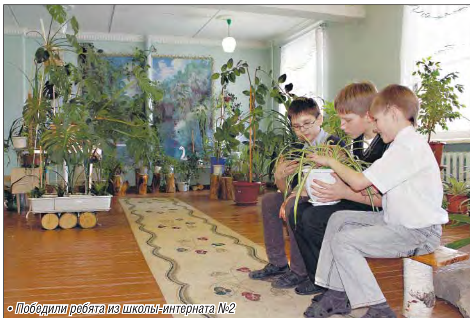
• Победили ребята из школы-интерната №2

Первое место занял общественно полезный проект школы-интерната №2 «Оазис для души». Здесь за школьным зим-