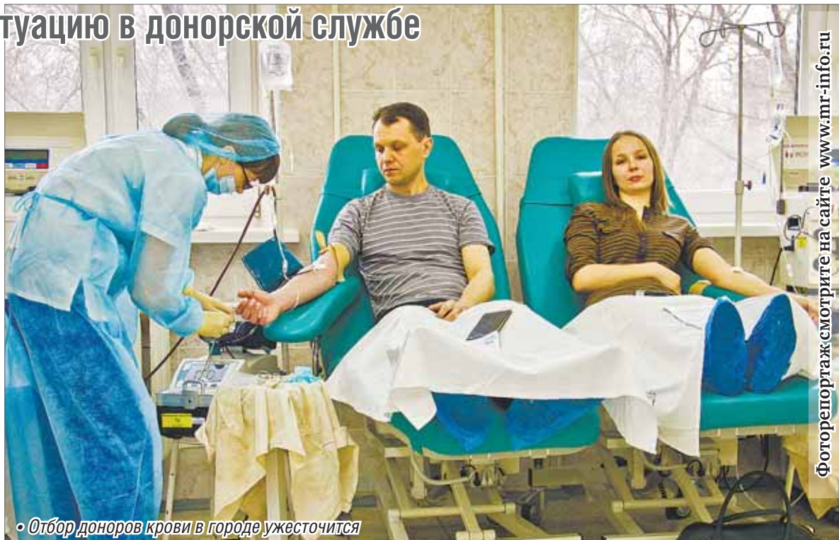
• Отбор доноров крови в городе ужесточится

Новый закон обострил критическую ситуацию, которая сложилась в последнее время, считает он. Количество доноров уменьшается с каждым годом. Сокращение