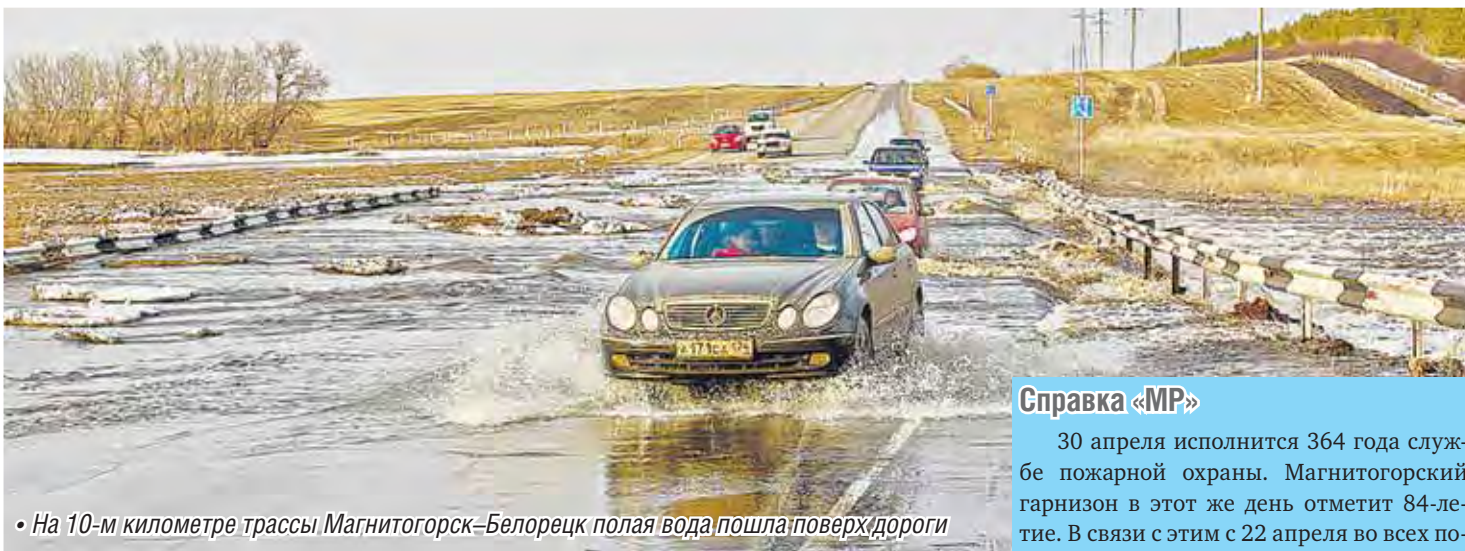
• На 10-м километре трассы Магнитогорск–Белорецк полая вода пошла поверх дороги

Обильное снеготаяние и лесные пожары – под контролем