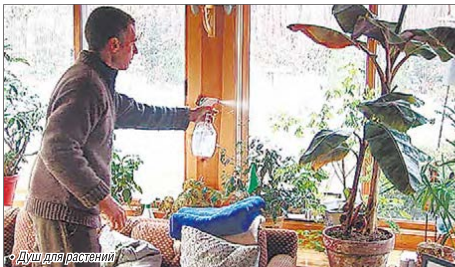
• Душ для растений

Для растения важен не только полив, но и доступ воздуха к корням. Поэтому на дно горшка нужно всегда класть керамзит, а землю в горшках необходимо регулярно рыхлить.