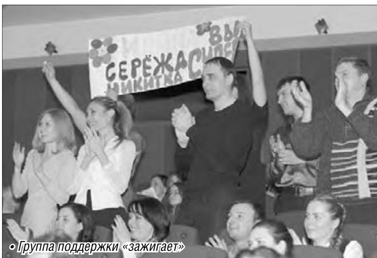
• Группа поддержки «зажигает»