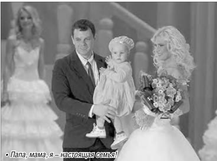
• Папа, мама, я – настоящая семья!

Мужчины смотрят на представительниц прекрасного пола как на теннисный матч, только водят глазами не слева направо, а сверху вниз. Между прочим, эту фразу некогда «погрузила в вечность» редкостной красоты женщина – Марлен Дитрих, легендарная немецкая актриса и певица, создавшая один из совершеннейших кинематографических женских образов: ее «знойная леди со стальным позвоночником» до сих пор остается непревзойденной.