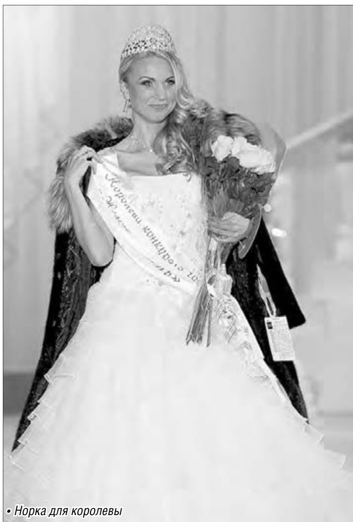
• Норка для королевы

Жюри едва не угодило в тупик: все десять красавиц действительно оказались красавицами