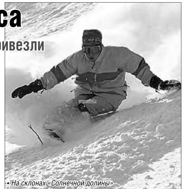
• На склонах «Солнечной долины»