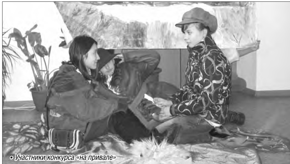
• Участники конкурса «на привале»

Особенно интересно прошел конкурс «Узнай картину», где участники проявили свои таланты в интерпретации картин известных художников «Опять двойка», «Кружевница»,