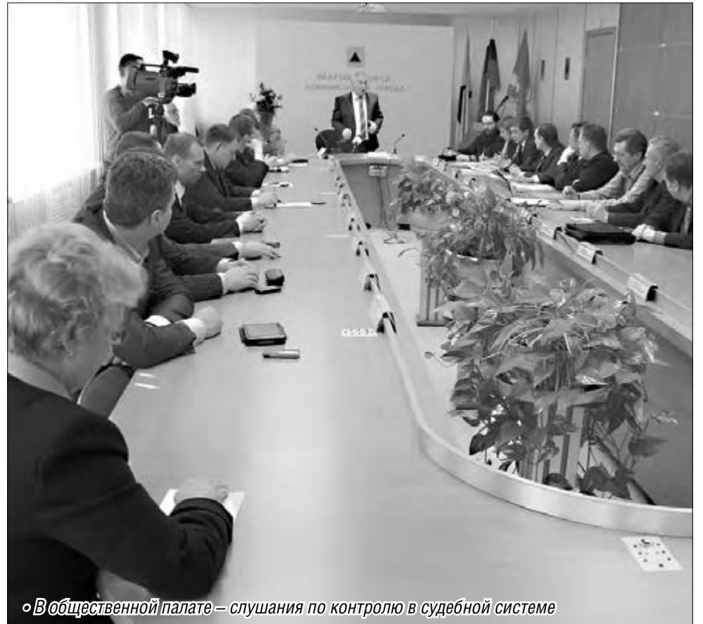
В Общественной палате – слушания по контролю в судебной системе