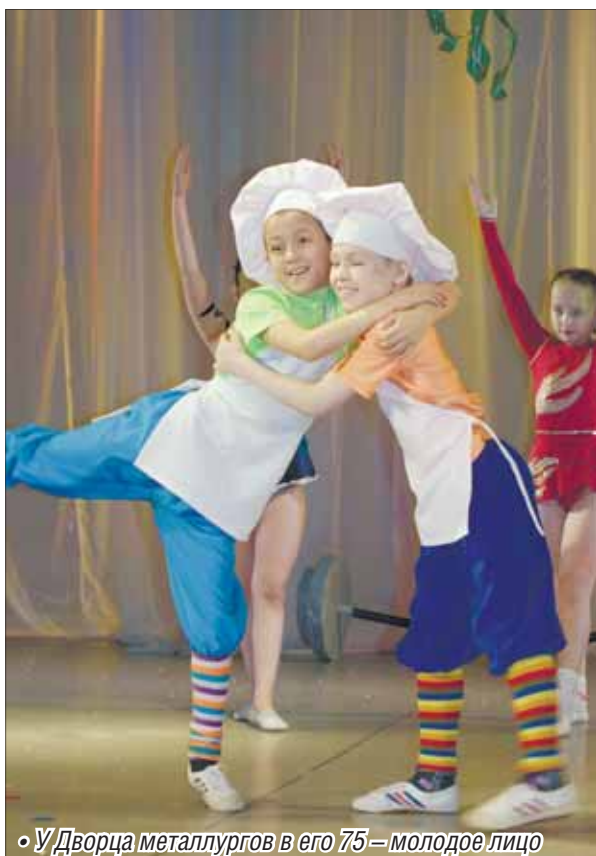
У Дворца металлургов в его 75-е молодое лицо

Магнитные бури в феврале: 8, 10, 13, 14, 18, 21, 22, 23, 25, 27.