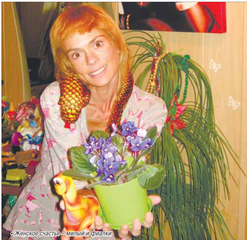
• Женское счастье – милый и фиалки

Вот так мы радовали друг друга до Рождества. Но перед Рождеством мой цветочек поник, приуныл, зимняя хандра взяла свое – цветы стали засыхать, листочки опадать. И меня вдруг осенило. Я искренне, по-детски верю, что под Рождество все желания и мечты сбываются. Вот и загадала, чтобы моя фиалочка ожила, воспарила духом, чтобы ее желания тоже исполнялись, ведь во всем живом есть своя душа. А еще, наверное, ей было скучно, и я посадила к ней в горшочек раскрашенную фарфоровую мини-лечечку для самополива цветов в виде змейки, символа года. Через несколько дней фиалка вновь набрала цвет, надела фиолетовое убранство. Теперь мы живем и радуемся: змейка и фиалка поглядывают на нас с любовью, а мы с мужем им подмигиваем с радостью, дабы показать, что мы одна семья: один за всех и все за одного. И такое хо-