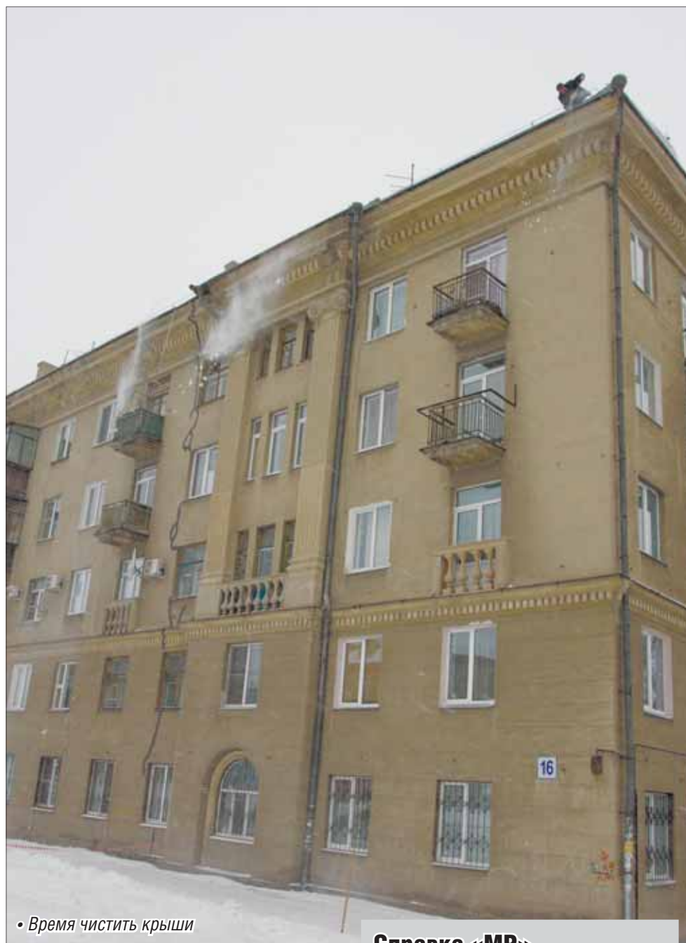
• Время чистить крыши