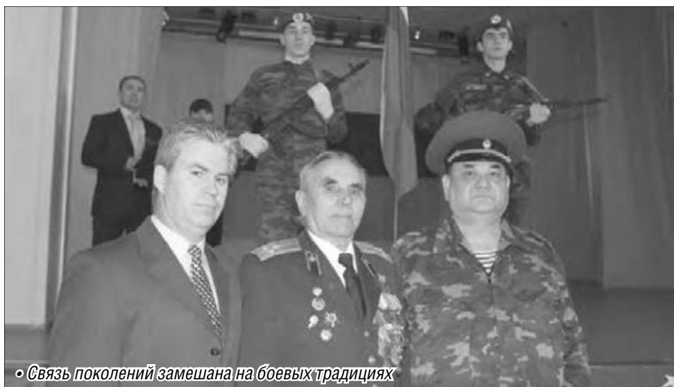
«Связь поколений замешана на боевых традициях»

– Во все времена Родина нуждалась в защите, и ее сыны грудью вставали, чтобы не пропустить врага, – обратился к ребятам ветеран. – Чтобы стать достойным членом общества, суметь, если нужно, постоять за страну, семью, близких людей, нужно быть к этому готовым. Быть сильным, смелым,