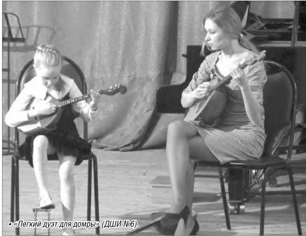
• «Легкий дуэт для домры» (ДШИ №6)

– Конечно, с мамой, ведь она заглушает мои фальшивые места своей игрой, – получила в ответ.