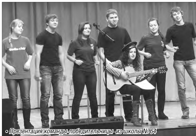
• Презентация команды-победительницы из школы №64