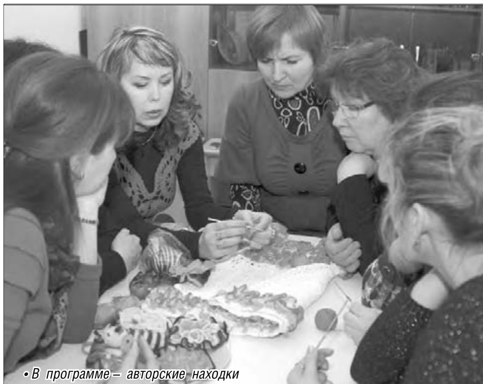
• В программе – авторские находки