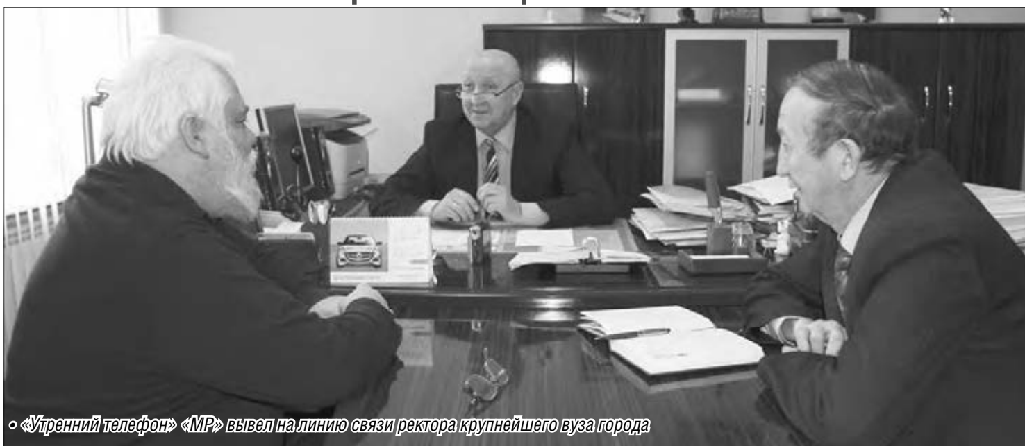
«Утренний телефон» «МР» вывел на линию связи ректора крупнейшего вуза города

В Татьянин день ректор МГТУ по традиции провёл сеанс «горячей телефонной связи»