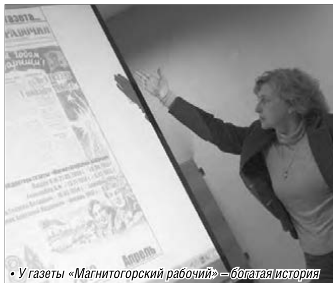
• У газеты «Магнитогорский рабочий» – богатая история

Тягу к созданию «своих газет» показал состоявшийся в МаГУ III городской фестиваль школьных СМИ «Зоркое сердце», в котором приняли участие около 200 делегатов от 20 школ города.