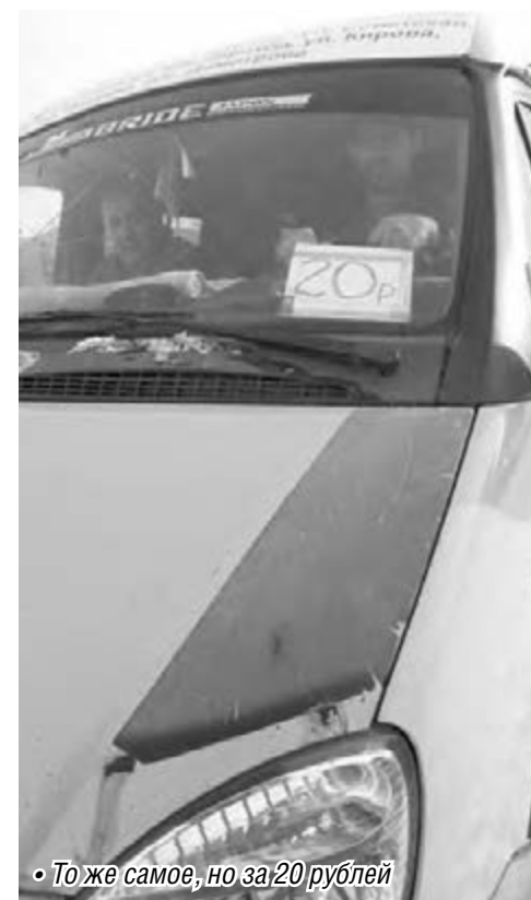
• То же самое, но за 20 рублей

Предпочтут горожане в качестве средства передвижения трамвай либо муниципальный автобус, будет известно уже в феврале. Но в защиту муниципального транспорта стоит назвать статистические данные. Стоимость проезда в трамваях и автобусах для школьников и студентов составляет шесть рублей, у частных перевозчиков не предусмотрено предоставление льгот для пенсионеров или учащихся. С 1 августа проезд в трамвае вырос до 15 рублей, но это цена одной поездки. Приобретая проездной билет и имея возможность в течение часа пересаживаться на другие маршруты, горожанин значительно снижает затраты на поездку. Кроме того, подчеркнул Александр Георгиевич, до августовского повышения стоимости проезда в муниципальном транспорте ежемесячно только билетов на трамвай «Маггортранс» реали-