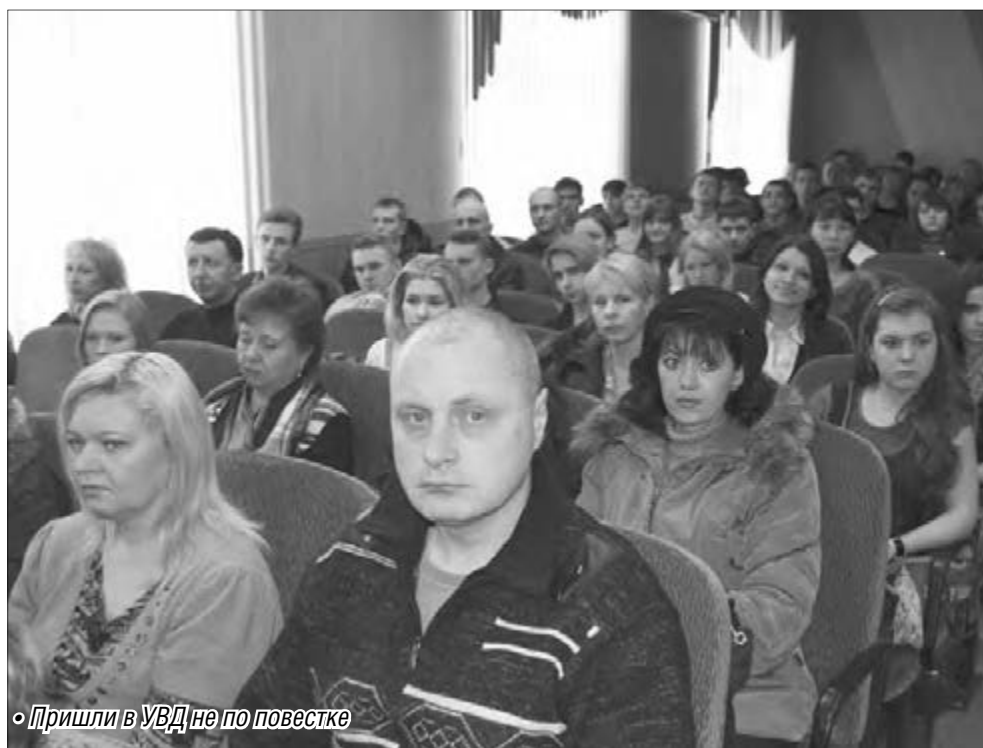
• Пришли в УВД не по повестке

Такого огромного числа желающих приобщиться к будням правоохранителей актовый зал здания управления полиции еще не видывал. Обычно скромное мероприятие привлекало не больше сотни школьников, в этом же году их было в три-четыре раза больше. Мы побеседовали с ребятами, пришедшими в управление МВД.