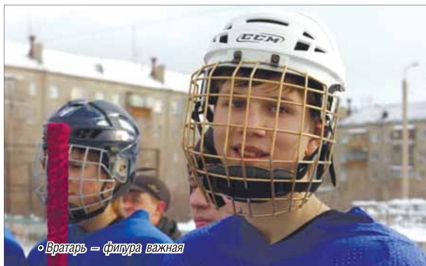
• Вратарь — фигура важная