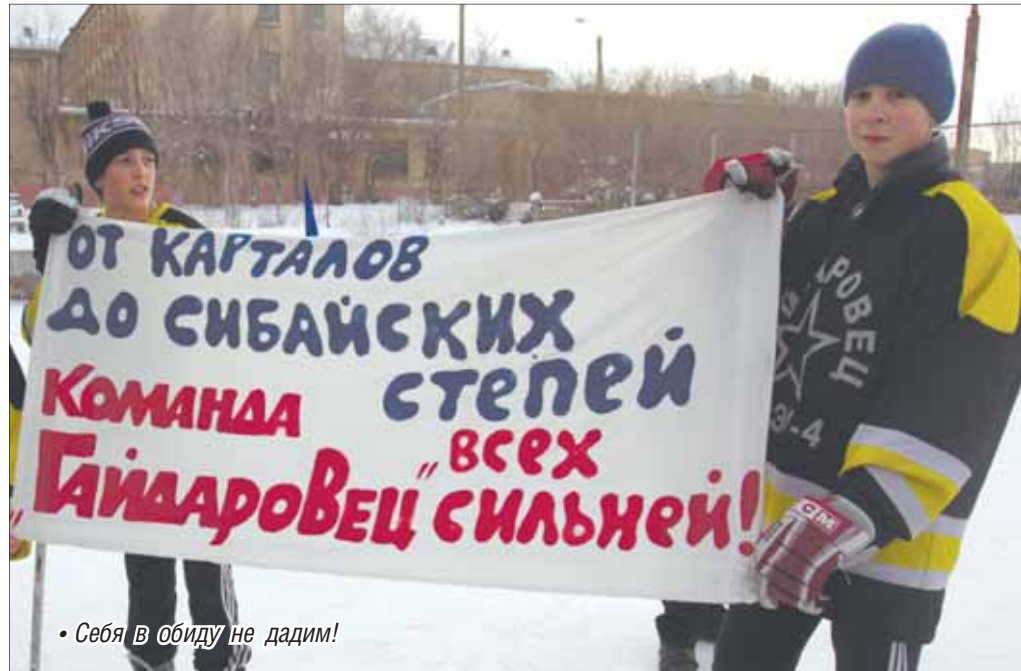
• Себя в обиду не дадим!