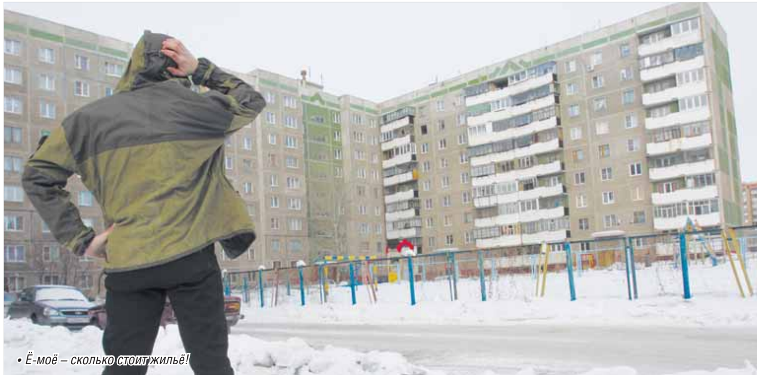
• Ё-моё – сколько стоит жильё!

Иметь собственное жильё – всем ли по карману эта мечта?