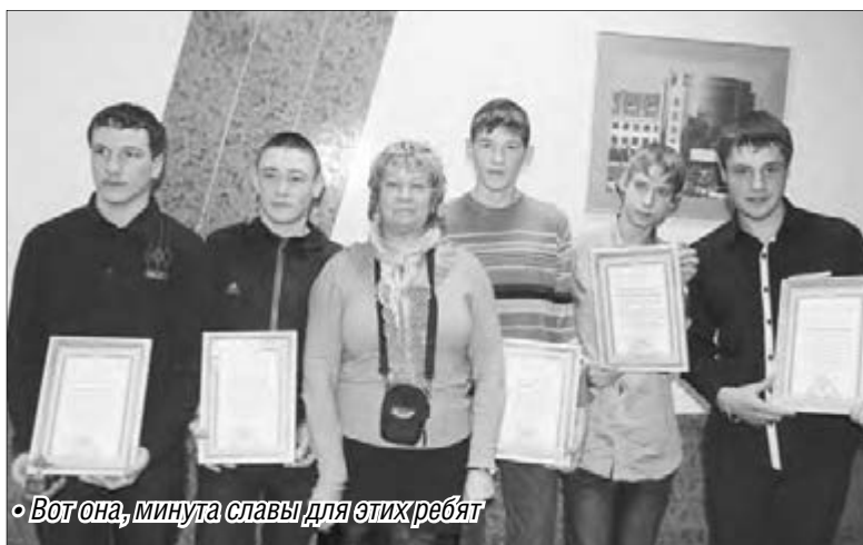
• Вот она, минута славы для этих ребят

Сотрудникам правоохранительных органов удалось задержать всех участников нападения на пятиклассника. Как выяснили