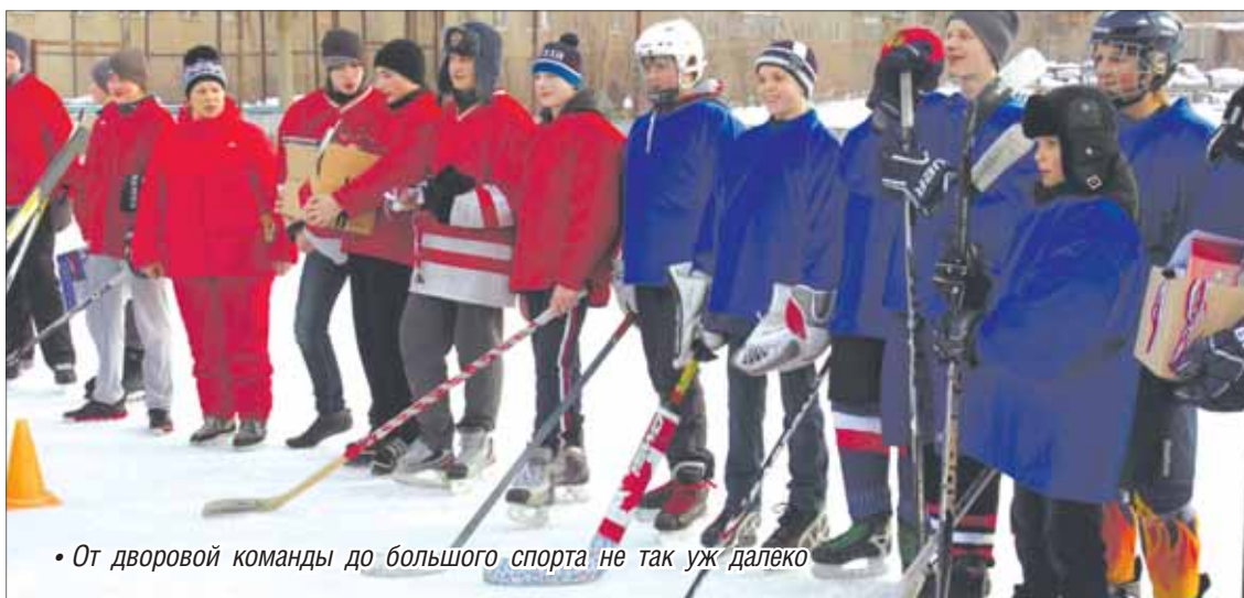
• От дворовой команды до большого спорта не так уж далеко