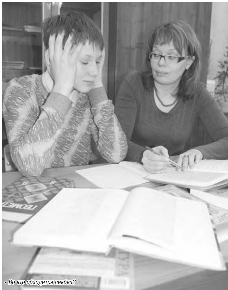
• Во что обходится ликбез?

Но заплатить репетитору – это одно, гораздо важнее найти хорошего педагога, который за взятые деньги даст гарантированно хорошие знания. Где найти отличного специалиста? Лучше всего – по «сарафанному радио»: нет большей гарантии, чем добрая слава, подтвержденная хорошо сданными подопечными экзаменами. А вот стоит ли брать дополнительные платные уроки со своим «собственным» школьным учителем – вопрос спорный. И в процессе обсуждения поправок к новому Закону «Об образовании» он поднимался на заседаниях Общественной палаты страны.