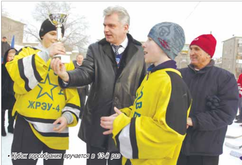
• Кубок горсобрания вручается в 13-й раз

Можно ли стать настоящим спортсменом, играя всего лишь в дворовой команде? Вполне!