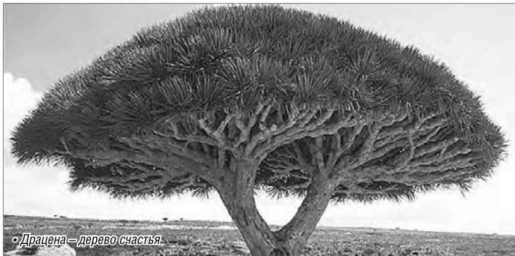
• Драцена – дерево счастья

Боги всегда были на стороне любви. И произошло чудо – из сухой палки пробился робкий росток, а на следующий день вся она была покрыта зелеными листьями. Юноша, не веря своим глазам, побежал к жрецу, чтобы рассказать ему о случившемся. Жрец, как и обещал, отдал Тетцкаоматль свою дочь. И всю жизнь Келькацкуотль и Тетцкаоматль приходили к тому дереву и благодарили богов за дарованное им счастье.