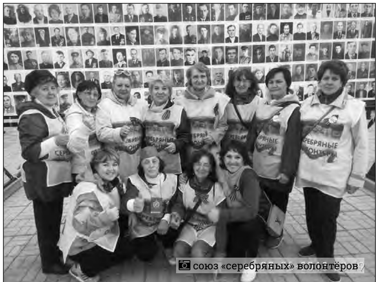
союз «серебряных» волонтеров

В Магнитогорске открылся региональный центр «серебряного» волонтерства