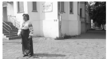
Улица Н. Шишки