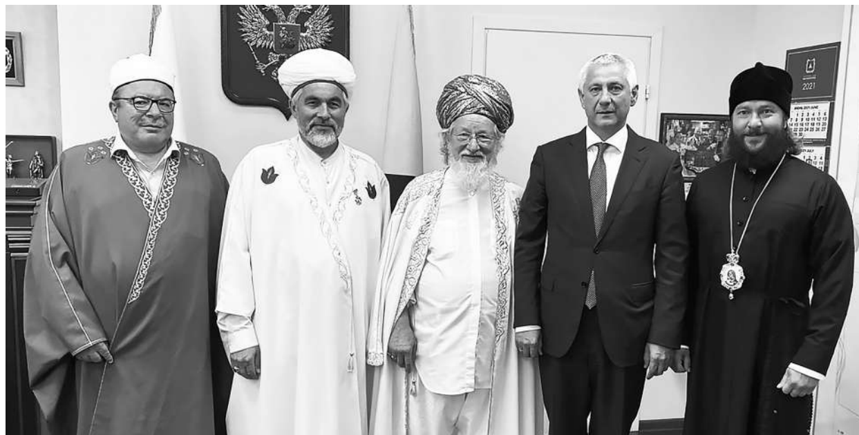
пресс-служба администрации города