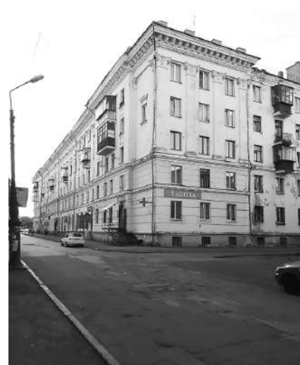
Улица А. Рубинштейна