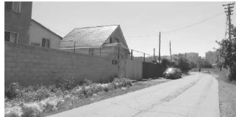
Улица Салавата Юлаева