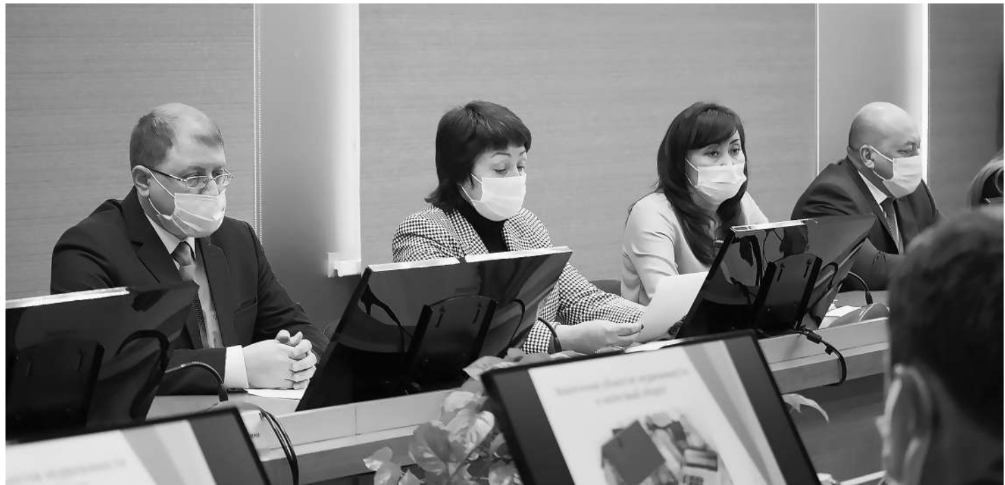
пресс-служба администрации города