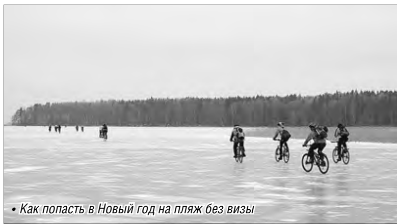
• Как попасть в Новый год на пляж без визы

Через десять минут я в заповеднике Деда Мороза. С крутого ската мемориального комплекса открывается прелестный вид. Заиндевшие стволы деревьев разбегаются в стороны, открывая взгляду белую ленту берега. Ее ограничивает стена облаков – испарения теплой воды за косой. На сплошном снежном поле берего-