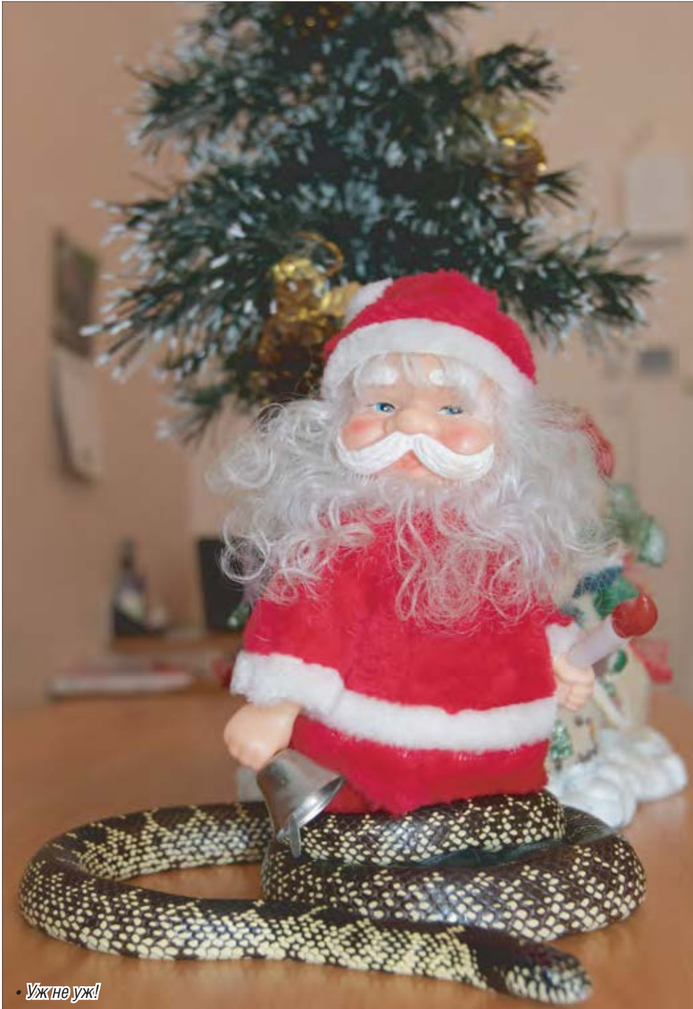
• Ужине уж!

Символ нового года живет на станции юннатов