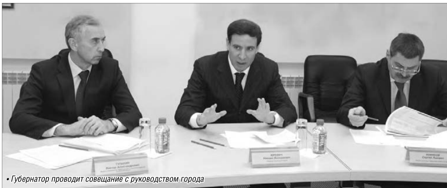
Губернатор проводит совещание с руководством города

Местное строительство жилья – в фокусе региональной власти