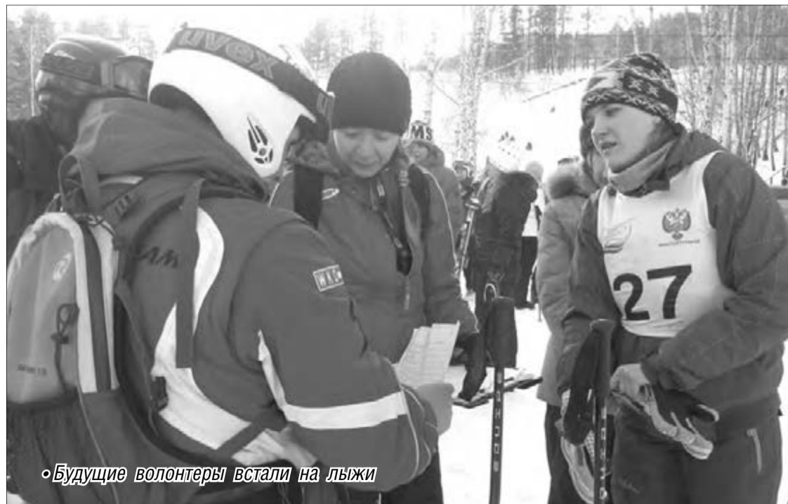
• Будущие волонтеры встали на лыжи