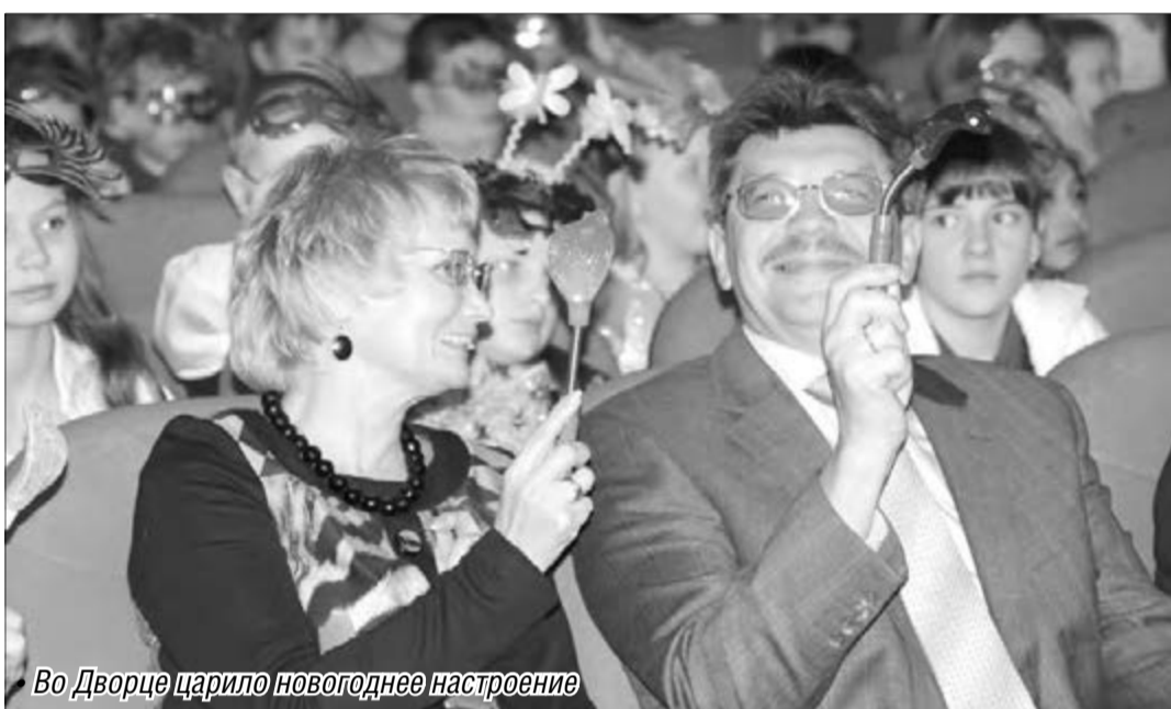
Во Дворце царил новогоднее настроение