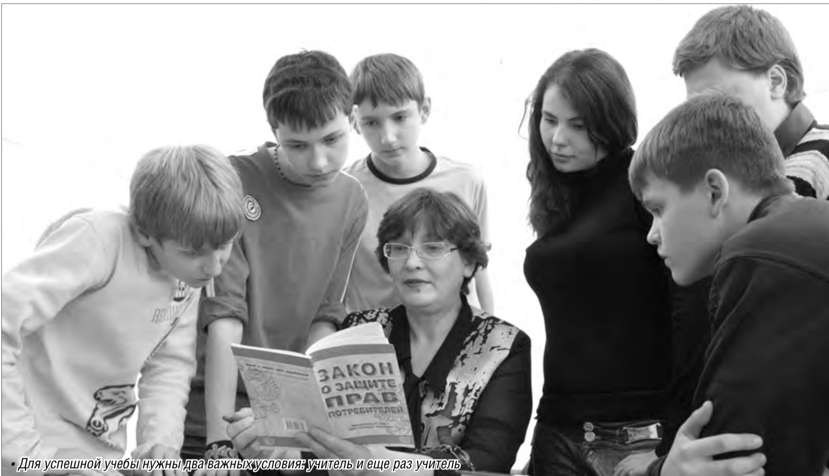
Для успешной учебы нужны два важных условия: учитель и еще раз учитель

О системе образования Магнитогорска в цифрах и фактах