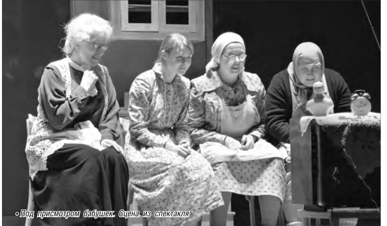
Под присмотром бабушек. Сцена из спектакля

Таково краткое содержание спектакля, который поставил художник-постановщик Алексей Вотяков. Впервые он выступил в роли режиссера, поэтому «Время женщин» можно считать его успешным дебютом. Почему так уверенно об этом говорю? Да потому что все, кто побывал на первом спектакле, выходили из театра, потрясенные увиденным. И мысленно благодарили режиссера за то, что во главу