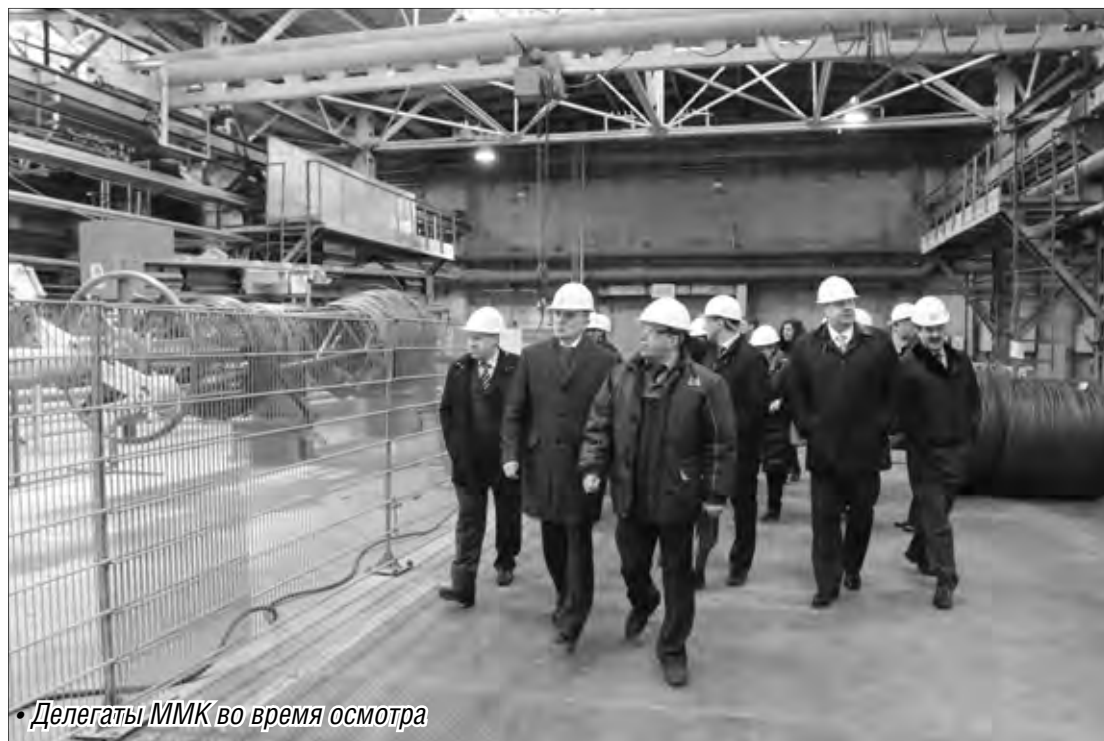
Делегаты ММК во время осмотра

Основной инвестиционной площадкой стал сталепроволочно-канатный цех завода. С него и началось посещение руководством комбината производственной площадки. Делегация осмотрела девятикратный прямоточный волочильный стан для производства высокоуглеродистой проволоки, применяемой для передельной заготовки арматурных канатов и высокопрочной арматуры; линию для производства стабилизированных арматурных канатов, применяемых в строительстве; прямоточные станы для производства высокоуглеродистой проволоки для метизной промышленности, машиностроения; агрегат патентирования катан-