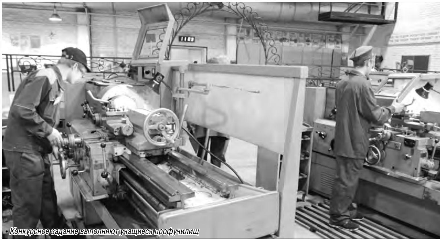
Конкурсное задание выполняют учащиеся профучилищ

На Урале взялись за возрождение престижа рабочих профессий