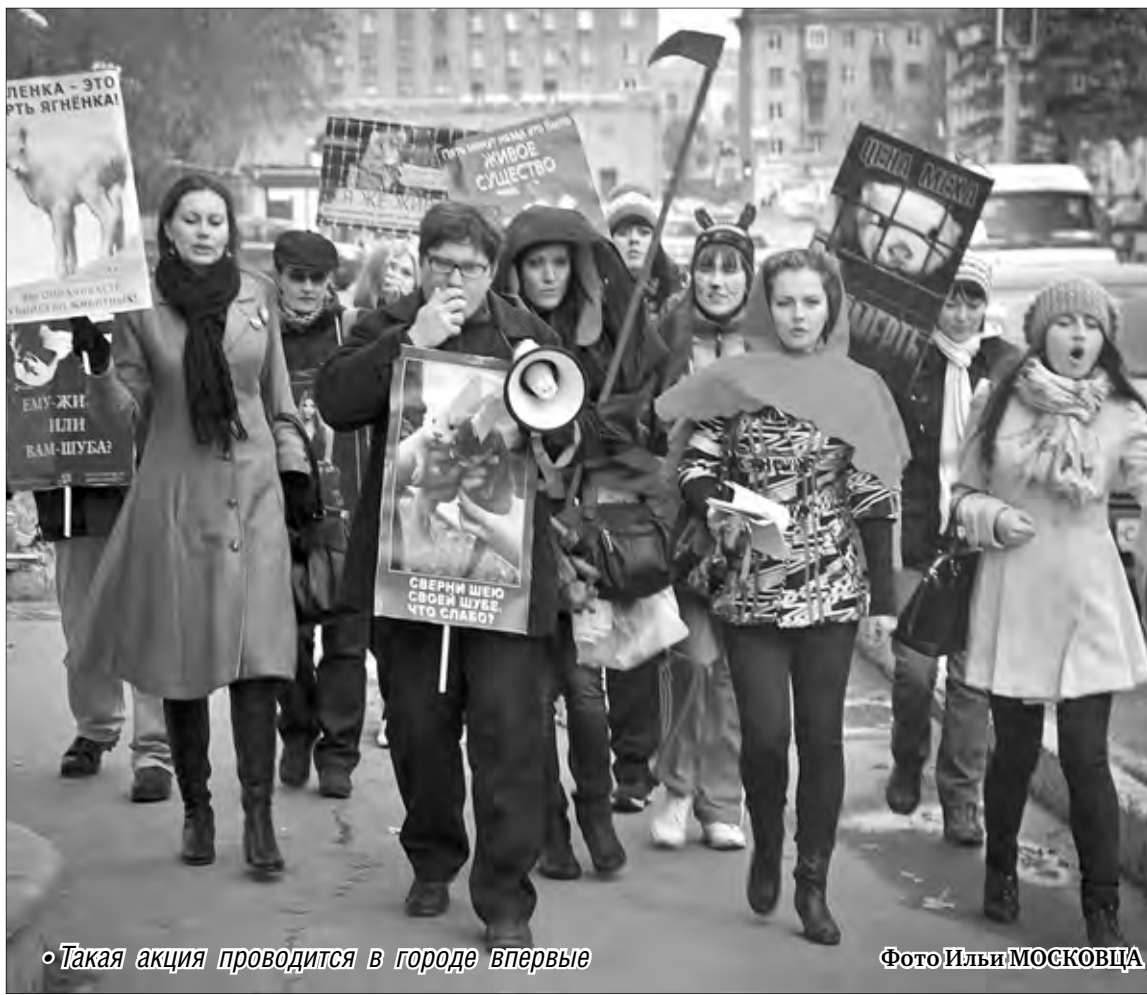
Такая акция проводится в городе впервые

Есть разные виды дискриминации: по национальному, половому признаку, расизм, сексизм... А здесь дискриминация по видовому признаку – это видовой шовинизм или специцизм, который опи-