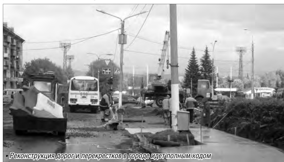
• Реконструкция дорог и перекрестков в городе идет полным ходом

Подготовлено Валентиной СЕРДИТОВОЙ