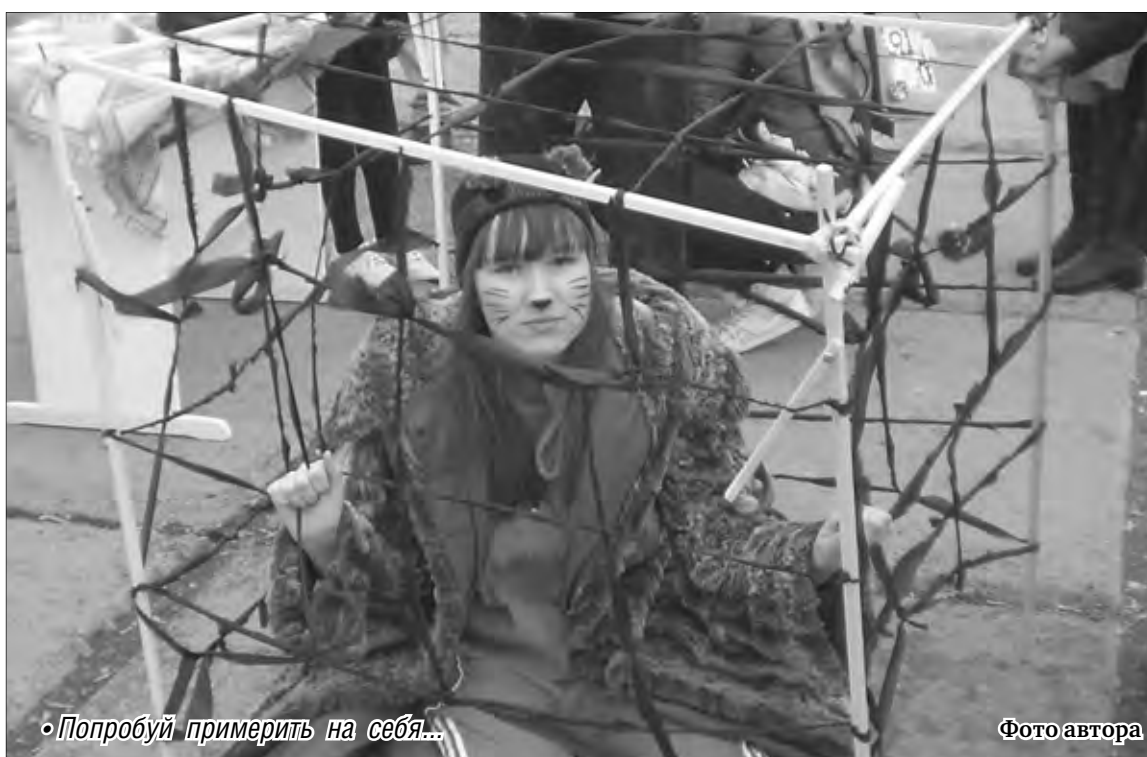
Попробуй примерить на себя...