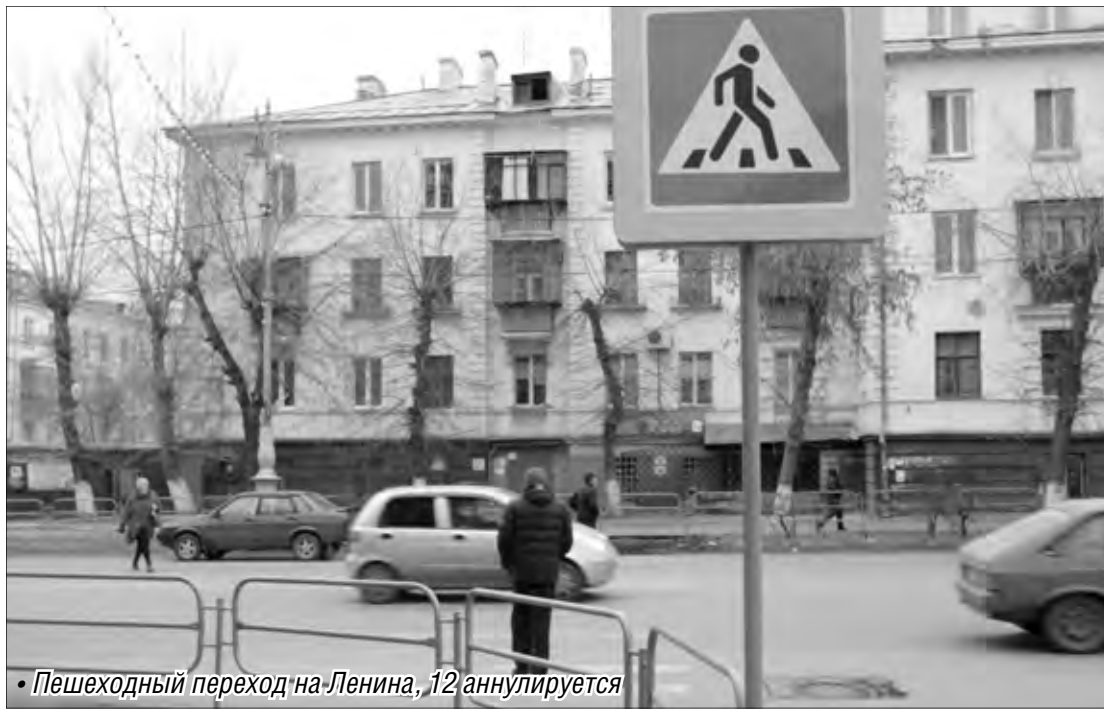
• Пешеходный переход на Ленина, 12 аннулируется

провели специалисты управления инженерно-обеспечения, транспорта и связи администрации города, они же на совещании при заместителе главы города Олеге Грищенко доложили о небезопасности семи пешеходных переходов. После этого коллегиально было принято решение о ликвидации «зебр» на аварийно-опасных участках.