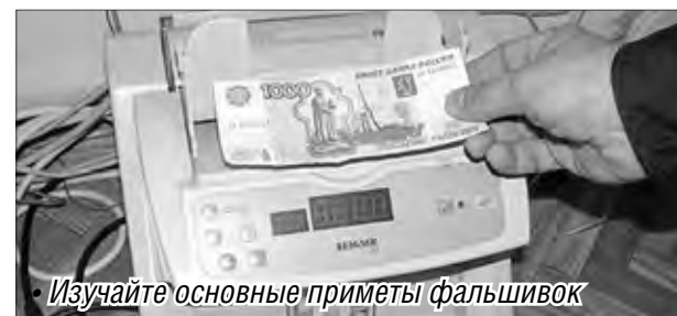
Изучайте основные приметы фальшивок

Транспортная полиция Южного Урала напоминает: всегда проверяйте подлинность купюр крупного достоинства. Если предлагаемая вам банкнота вызывает сомнения в подлинности, не отказывайтесь от нее и не возвращайте ее сбытчику. Незамедлительно вызовите сотрудников полиции, под любым предлогом (например, отсутствия сдачи) постарайтесь задержать сбытчика до прибытия сотрудников органов внутренних дел либо запомните приметы этого человека, транспорт, на котором он приехал. Не пытайтесь сами сбывать поддельную банкноту! Не забывайте: человек, сбывший купюру, несет уголовную ответственность, сообщает пресс-служба Южно-Уральского ЛУ МВД России на транспорте.