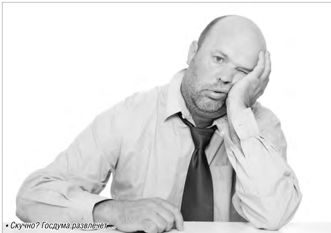
• Скучно? Госдума развлечет...