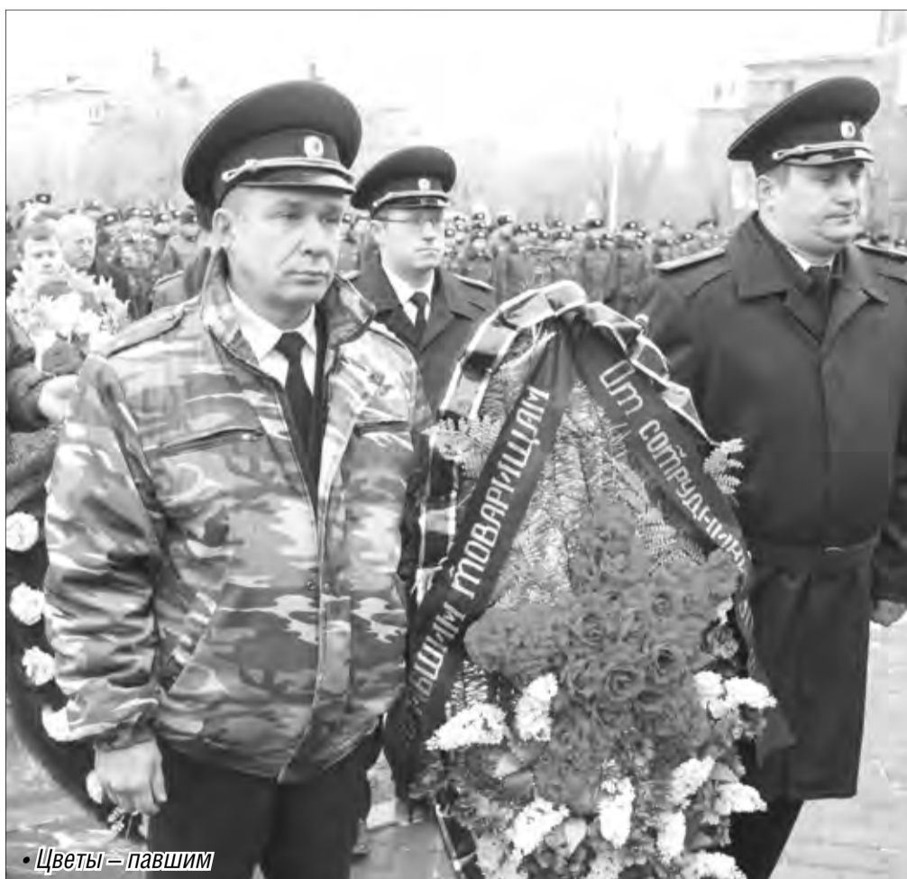
• Цветы – павшим

В Магнитогорске прошёл митинг памяти погибших при исполнении служебного долга