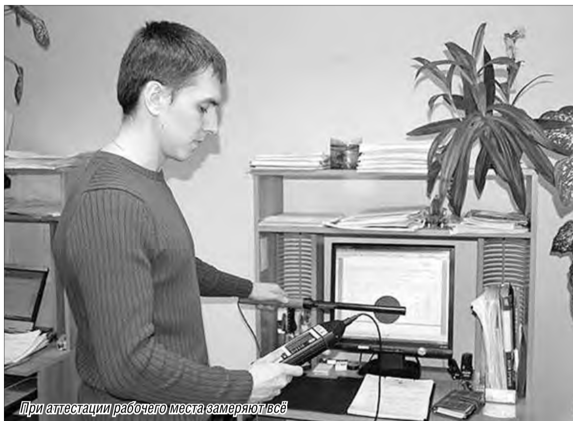
При аттестации рабочего места замеряют всё

В нашем городе в настоящее время аттестацией занимается несколько организаций, получивших аккредитацию в Минздравсоцразвития России: Центр охраны труда (по улице Московской), Центр экспертизы (по улице Ворошилова), независимые технические центры «Диагностика», «Специалист-