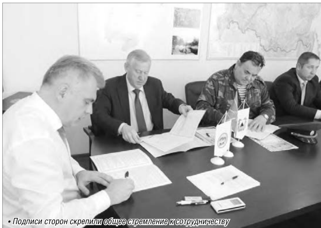
Подписи сторон скрепили общее стремление к сотрудничеству

Подписано соглашение о сотрудничестве между администрацией города, местным отделением «Единой России» и советом ветеранов погранвойск