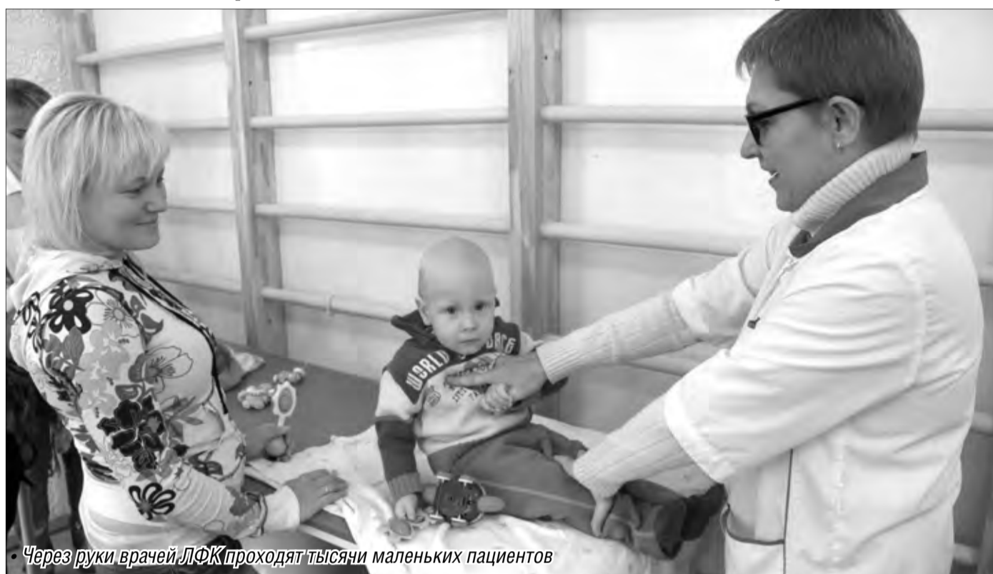
Через руки врачей ЛФК проходят тысячи маленьких пациентов

Здесь при лечении используются в основном немедикаментозные методы восстановления. Хотя при центре работает дневной стационар, где при необходимости дети по назначению врача получают курс медикаментозной терапии.