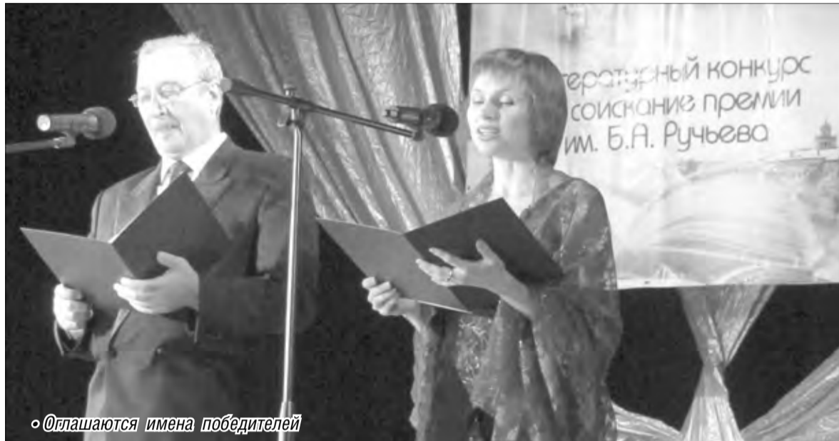
Оглашаются имена победителей

Церемония награждения подошла к кульминации. И вот назван первый победитель в номинации