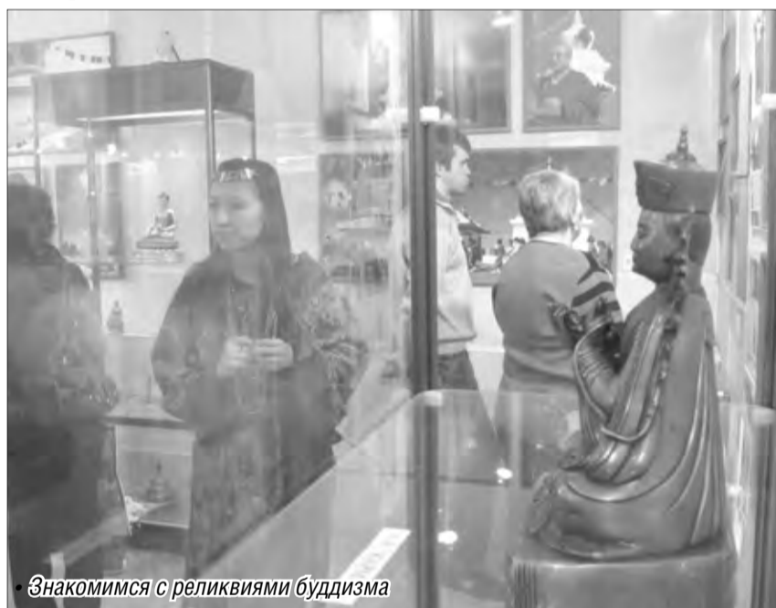
Знакомимся с реликвиями буддизма

Довелось и мне на открытии проекта походить вокруг волшебной ступы, которая по своему названию напомнила об аналогичном «инструменте» Бабы-Яги из русских народных сказок. Но вот в буддизме считается, что ступы – это монументы, способствующие сохранению мира, будем считать, что свой вклад в это хорошее дело внесла и я. А также все участники открытой выставки культовых предметов и фотоматериалов, которое состоялось на прошлой неделе в