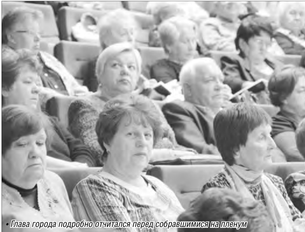
Глава города подробно отчитался перед собравшимися на пленум

Прошедший в четверг пленум городского совета ветеранов собрал огромное число участников