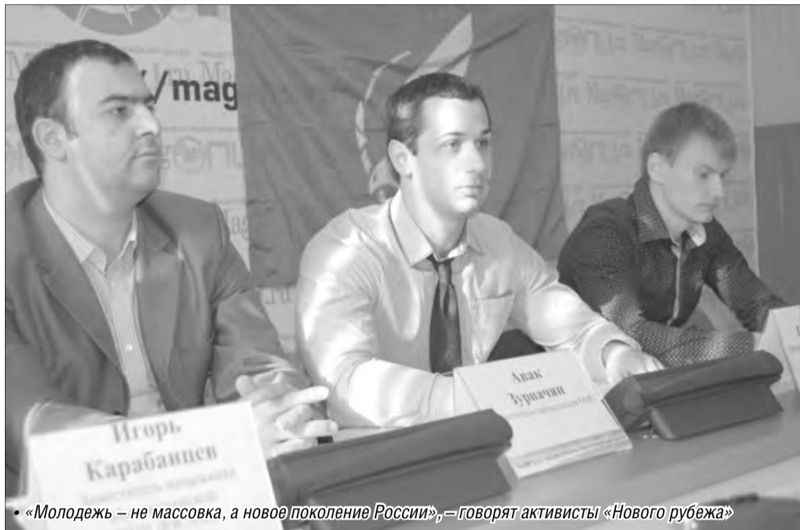
«Молодежь – не массовка, а новое поколение России», – говорят активисты «Нового рубежа»

В общественно-политическом центре официально объявлено об открытии местного отделения межрегиональной общественной организации «Новый рубеж»