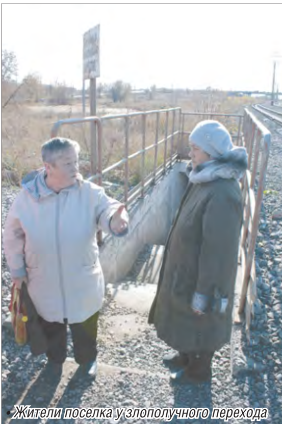
Жители поселка у злополучного перехода

Неурядицы левобережных посёлков хорошо известны – это отсутствие нормальных дорог, освещения, мест для проведения спортивных состязаний и отдыха, проблемы с питьевой водой