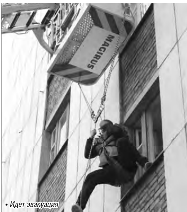
• Идет эвакуация