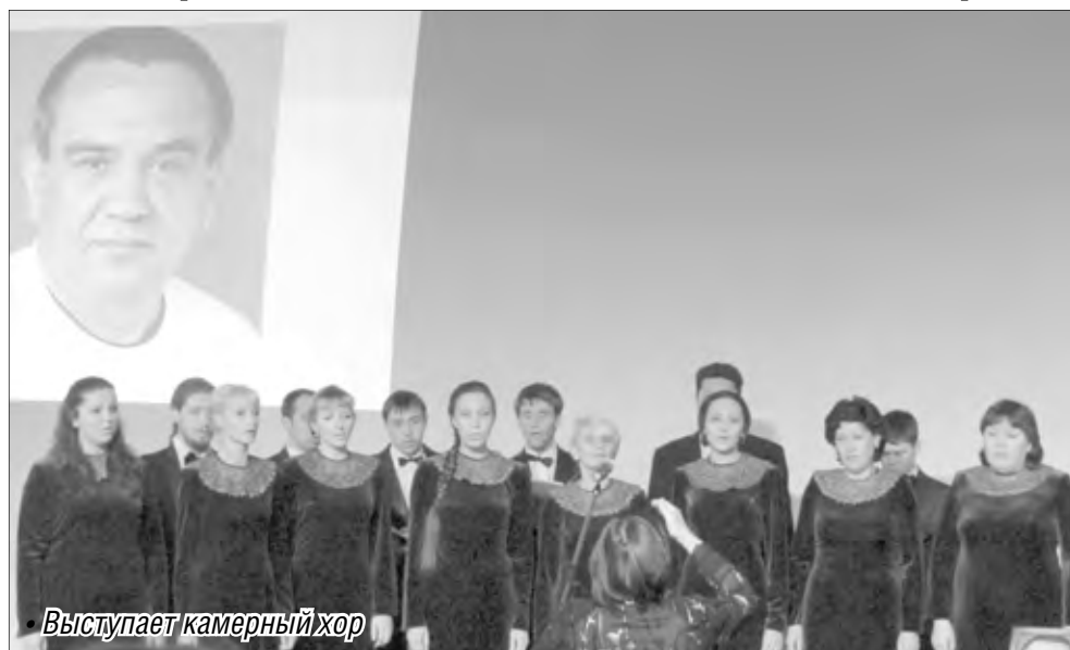
• Выступает камерный хор