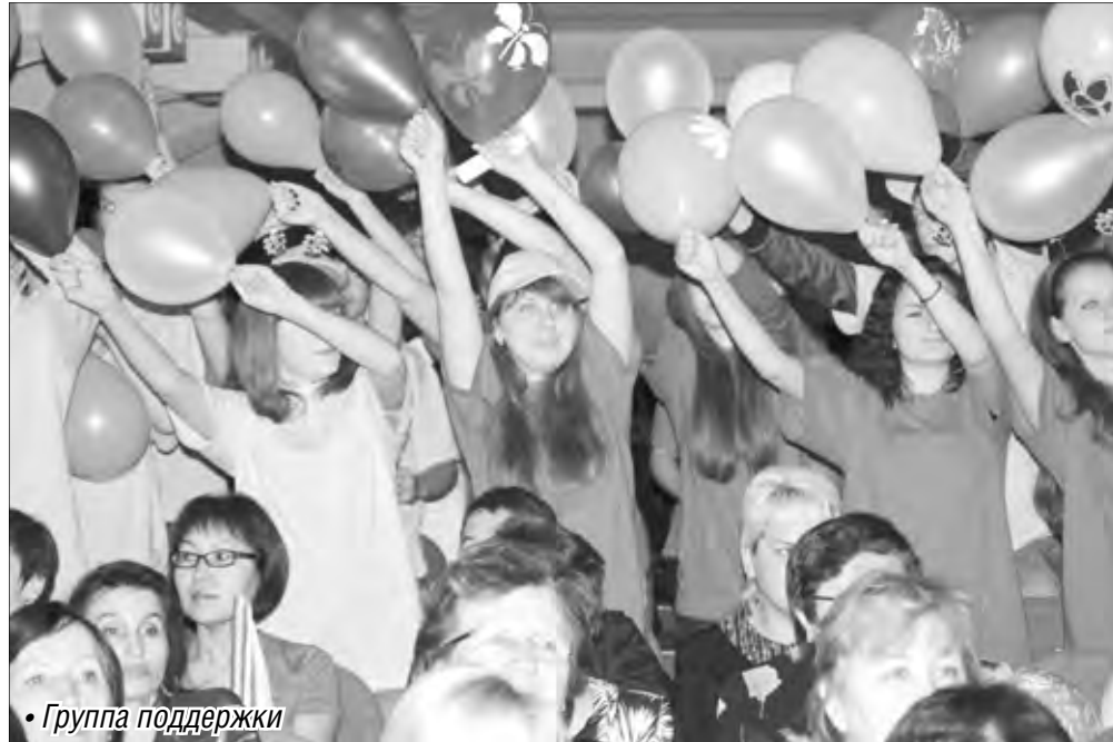
• Группа поддержки