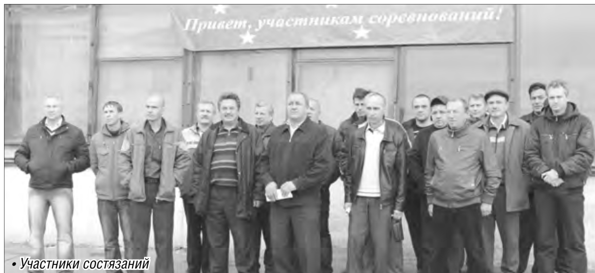
• Участники состязаний