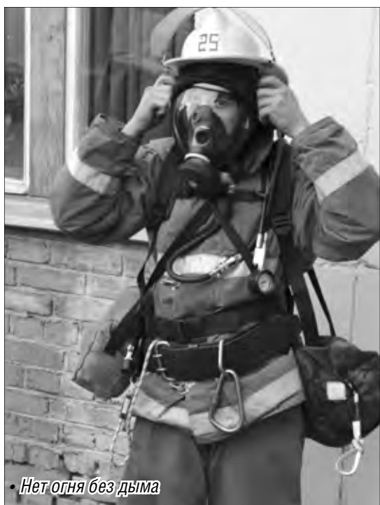
• Нет огня без дыма

Первыми на место прибывают расчеты ПЧ №25. В это время центральный пост вызывает на подмогу дополнительные пожарные силы, аварийные коммунальные службы, «скорую помощь», полицию. Автомобиль, оснащенный лестницей, останавливается в пяти метрах от общежития. Водитель перебирается в будку управления лестницей, которая через пару секунд оказывается у окна, за которым мечутся люди. Первой в специальном мешке эвакуируют девушку. Еще дважды спасатель возвращается на этаж, чтобы помочь покинуть помещение еще