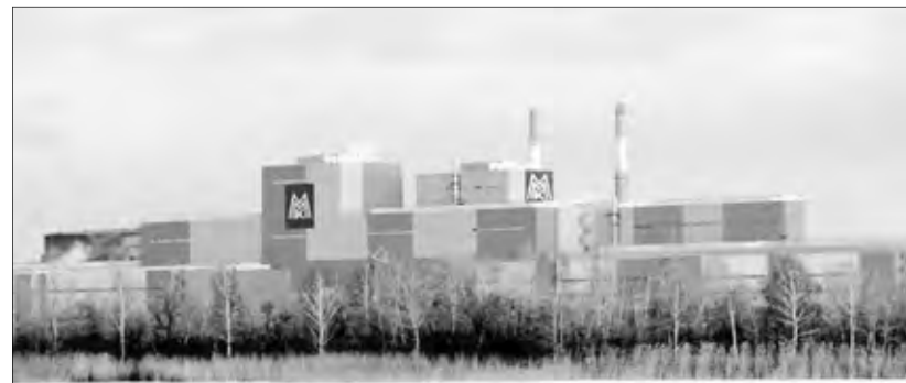
• Борьба с выбросами на ММК – в ряду приоритетных

Удельные выбросы загрязняющих веществ за шесть месяцев по сравнению с январем-июнем 2011 года уменьшились на 6,1 процента и составили 19,6 кг/тону, а валовые выбросы загрязняющих веществ в атмосферу в первом полугодии текущего года сократились на 0,31