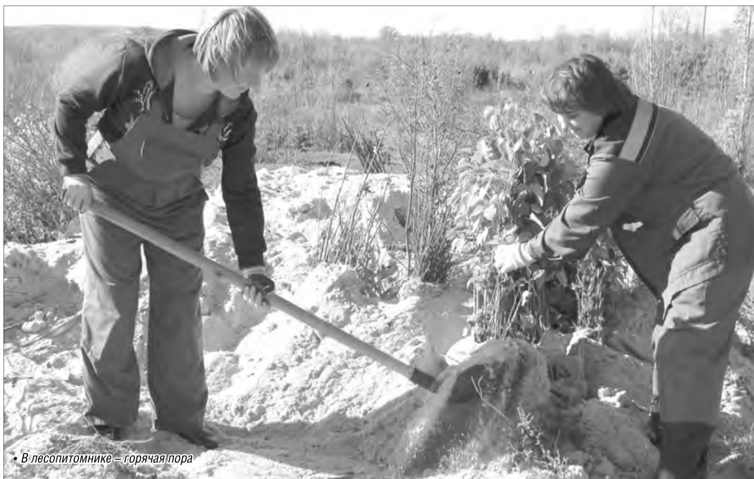
• В лесопитомнике – горячая пора

В городе стартовала плановая осенняя посадка саженцев