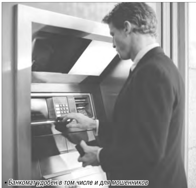
Банкомат удобен в том числе и для мошенников

Как же изменит новшество практику ежедневных платежей россиян, за чей счет будут погашаться все риски? Сразу же отметим, что подобно законам, защищающим права потребителей, данный акт также направлен на сохранение прав обычных граждан. При этом все риски и негативные последствия от действий мошенников станут головной болью исключительно финансовых учреждений. В соответствии с общим правилом банк будет обязан возместить денежные средства. При условии, что до этого момента клиент известил