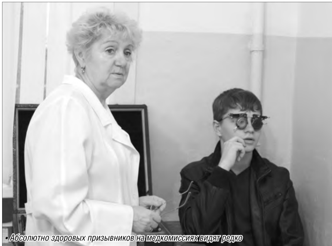
• Абсолютно здоровых призывников на медкомиссиях видят редко

– По опыту работы могу сказать, что около пятидесяти процентов призывников вообще не хотят служить. Оставшаяся часть немногим от них отличается. Для одних это повинность – «надо, так надо», и лишь малая доля парней действительно нацелена на службу. Традиционно магнитогорцы хотят попасть в десантные войска. Причина на поверхности: именно десантники самые смелые и умелые бойцы, и только они так шумно отмечают свой профессиональный праздник. Но надо понимать, что для службы в этих войсках должно быть не только идеальное соответствие физических данных, но и моральная, психическая устойчивость. Были случаи, когда парень уже на сборном пункте, поговорив с представителями