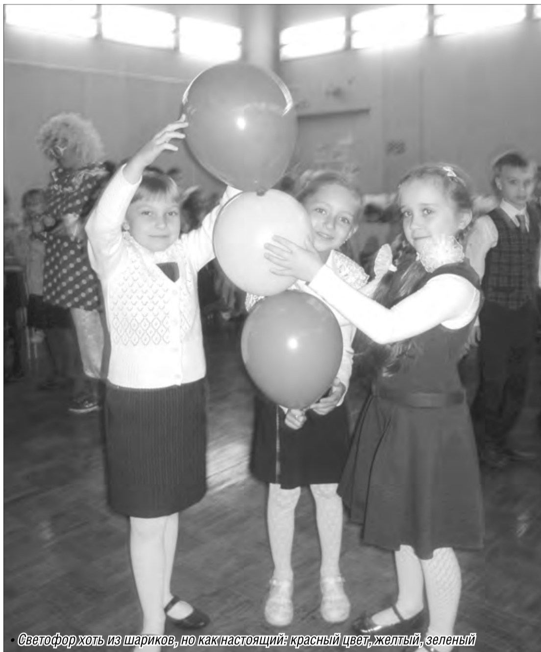
Светофор хоть из шариков, но как настоящий: красный цвет, желтый, зеленый