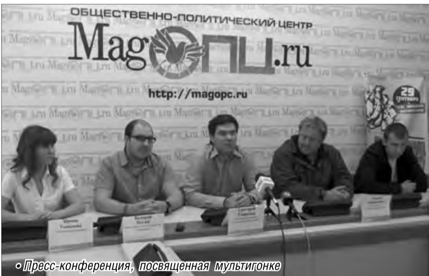
Пресс-конференция, посвященная мультигонке

Впервые подобные соревнования прошли в прошлом году, на тот момент в нашем регионе Магнитогорск стал единственным городом, который не побоялся предложить своим жителям