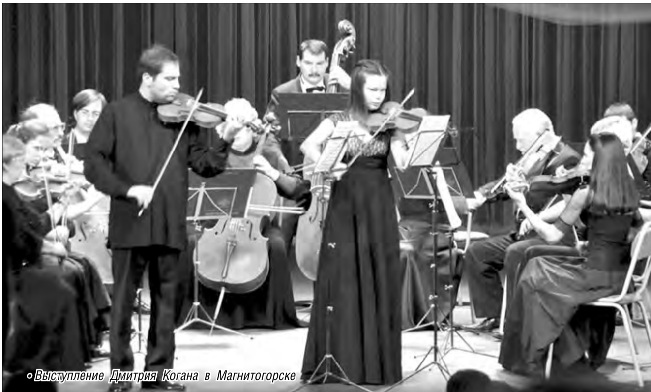
Выступление Дмитрия Когана в Магнитогорске