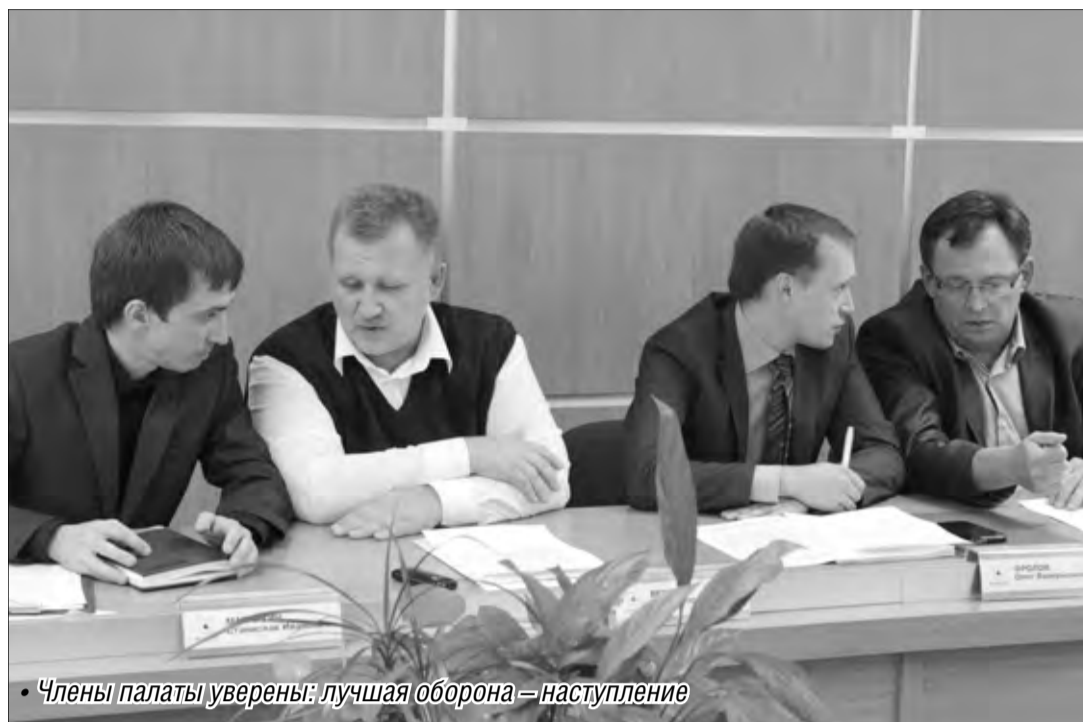
• Члены палаты уверены: лучшая оборона – наступление