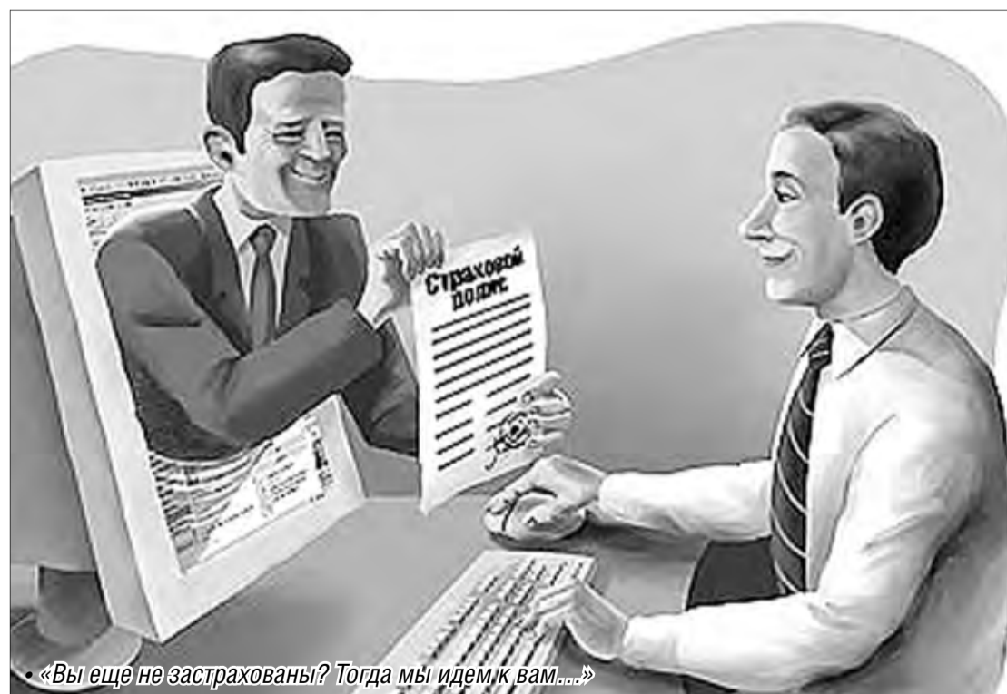
«Вы еще не застрахованы? Тогда мы идем к вам...»

Повысить здоровую конкуренцию между страховыми компаниями, а также выявить ту, которая добилась высоких результатов в предоставлении услуг клиентам, поможет конкурс «Лучшая страховая компания Магнитогорска-2012». Сегодня в городе работают 26 компаний, предоставляющих широкий спектр страховых услуг. Это и очень крупные компании, и небольшие. Учитывая это, организаторы будут рассматривать работу страховых фирм по разным критериям и номинациям. Несколько компаний уже подали заявки на участие в конкурсе, который продлится до декабря. Есть ряд критериев, который учитывается при отборе конкурсантов: защита прав работников (сотрудников компании), социальная ответственность, корпоративная культура, информационная открытость и коммуникации, сервисное сопровождение деятельности. Создана конкурсная комиссия, в состав которой входят независимые эксперты, в том числе