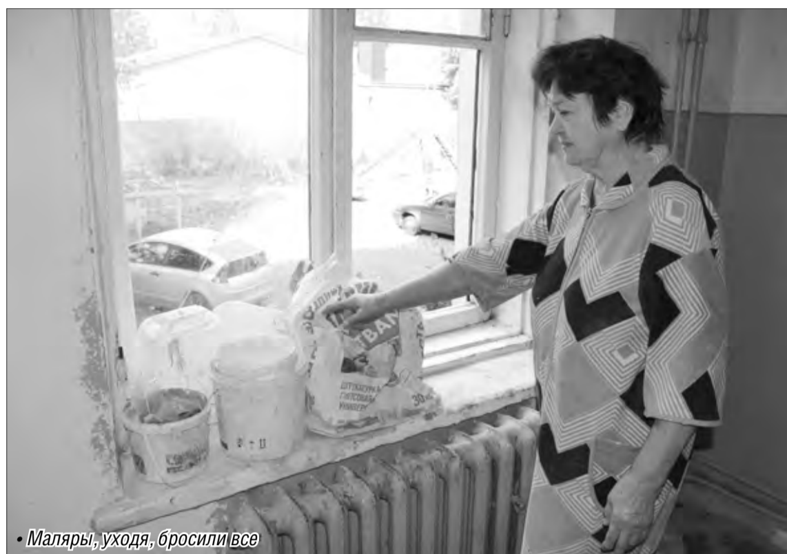
• Малярши, уходя, бросили все

– Да, ремонт остановлен. Проблема лежит на