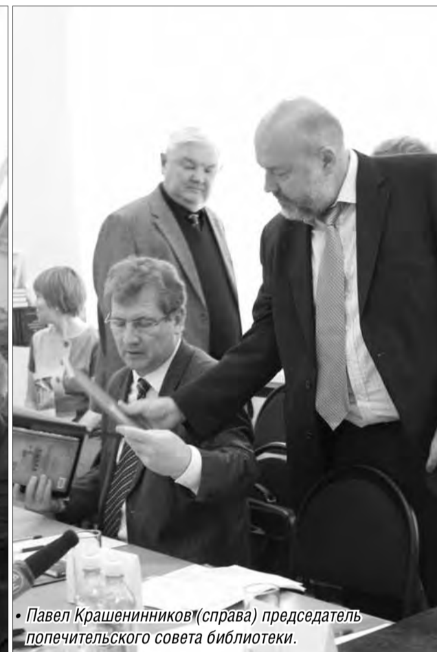
• Павел Крашенинников (справа) председатель попечительского совета библиотеки.

Возможно ли, чтобы на празднование дня рождения городской библиотеки съезжались депутаты Госдумы, министры и заместители министров, видные юристы и другие высокие гости? В Магнитогорске – возможно.