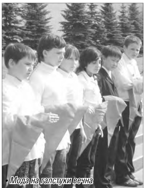
• Мода на галстуки вечная