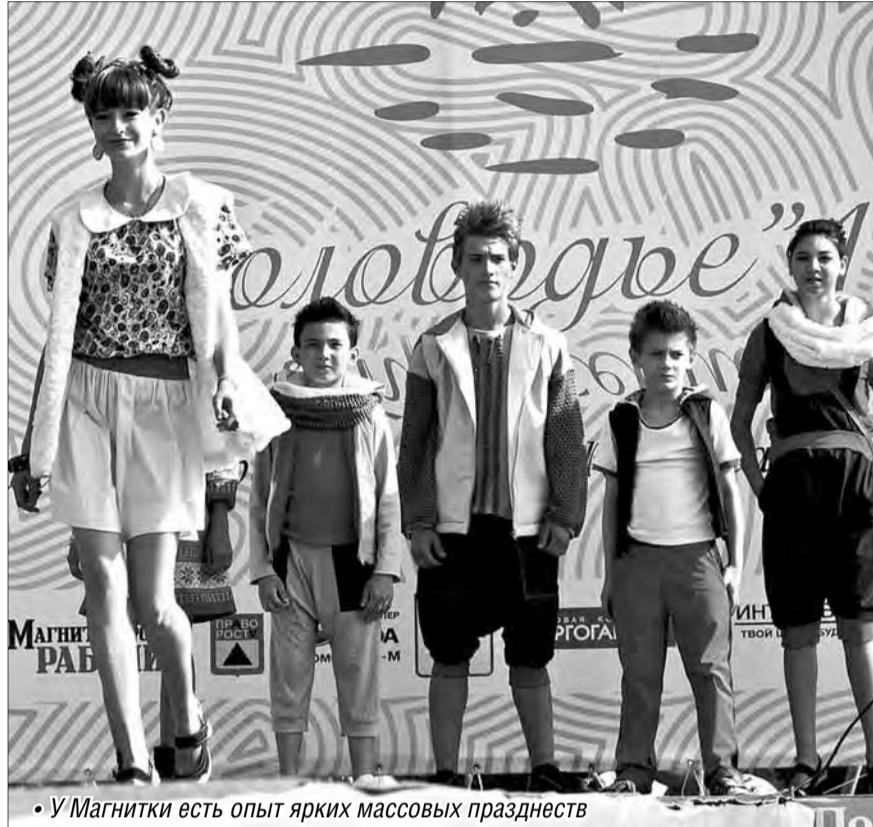
У Магнитки есть опыт ярких массовых празднеств