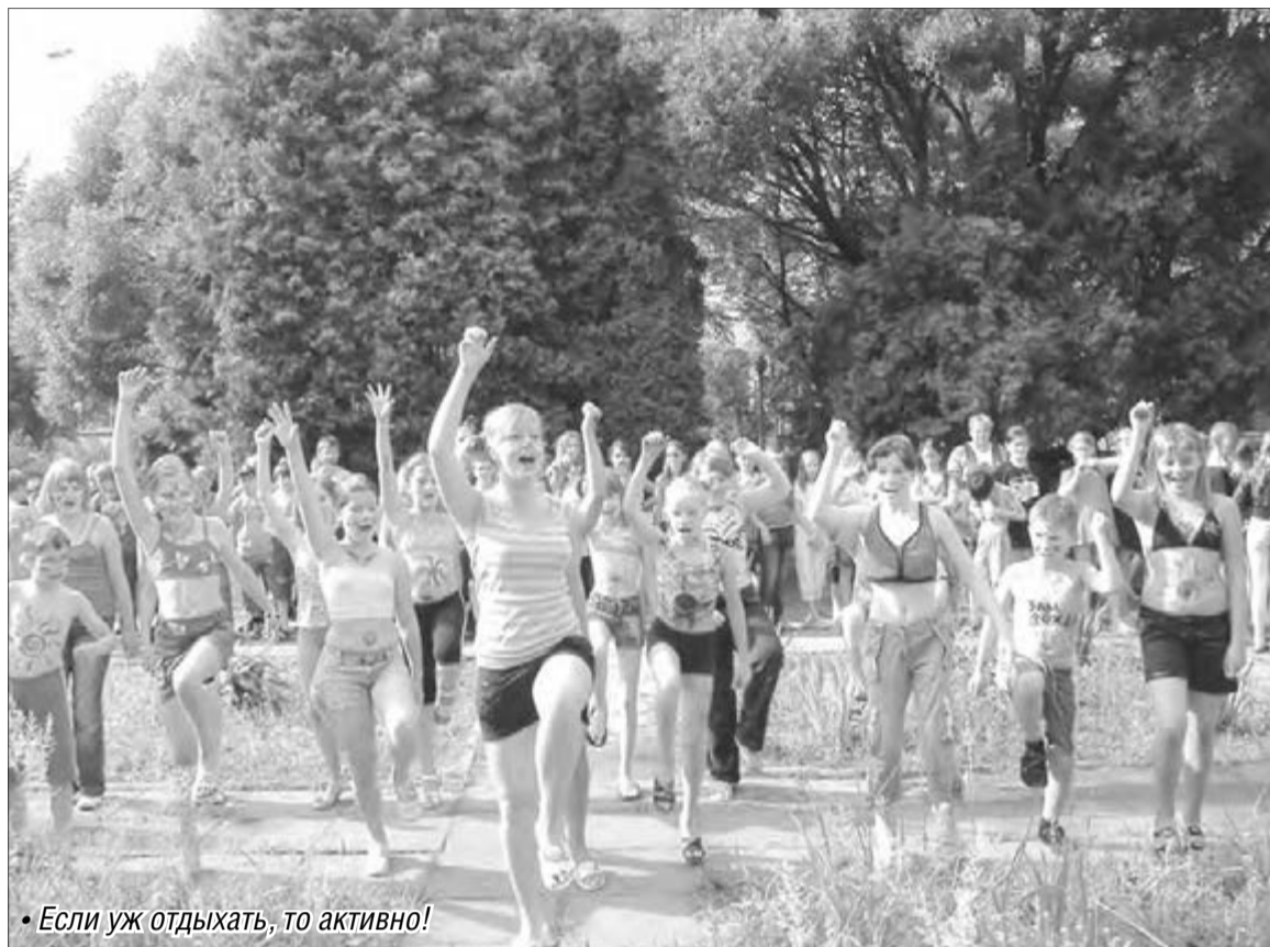
• Если уж отдыхать, то активно!