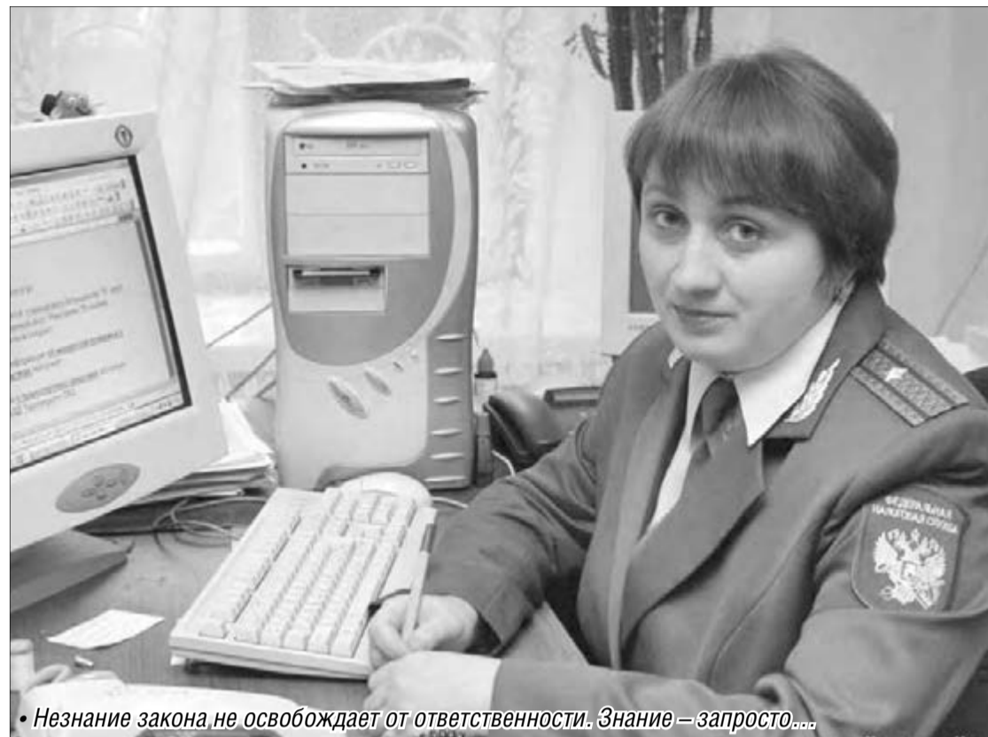
• Незнание закона не освобождает от ответственности. Знание — за просто...

Поправки в законы и различные ведомственные акты готовятся в рамках общей кампании по укреплению финансов, прежде всего налоговой дисциплины как одной из защитных мер на случай наката новой волны экономического кризиса. Здесь каждому контролеру отводится своя роль, но некоторым навязывается чужая. Например, Центральный банк уже обязал коммерческие банки с октября проверять своих клиентов – российские компании на предмет своевременного поступления на их счета средств из-за рубежа во исполнение внешнеэкономических сделок. Ибо неполучение экспортной вы-