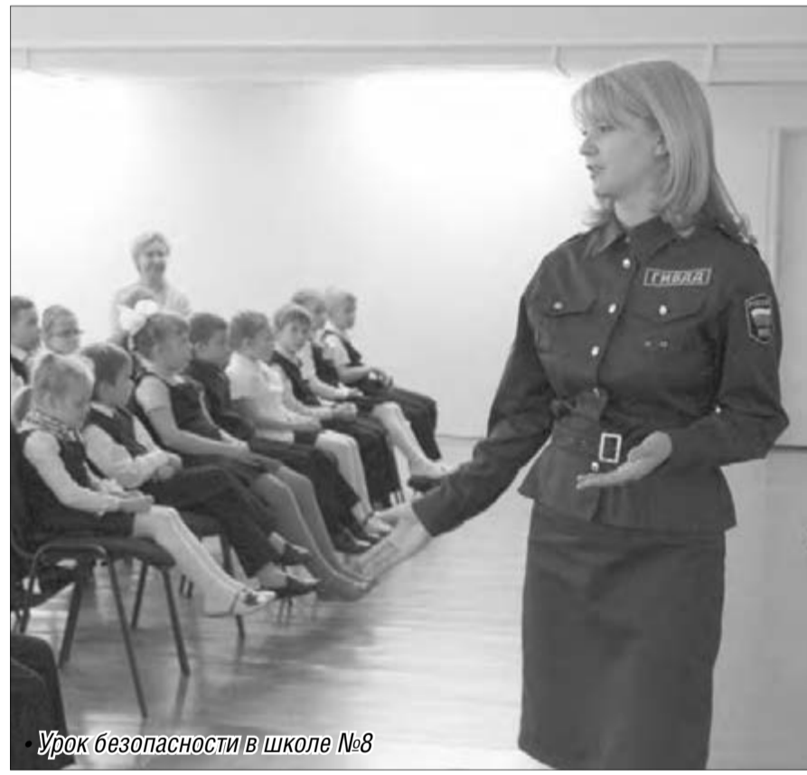
Урок безопасности в школе №8

Валентина СЕРДИТОВА