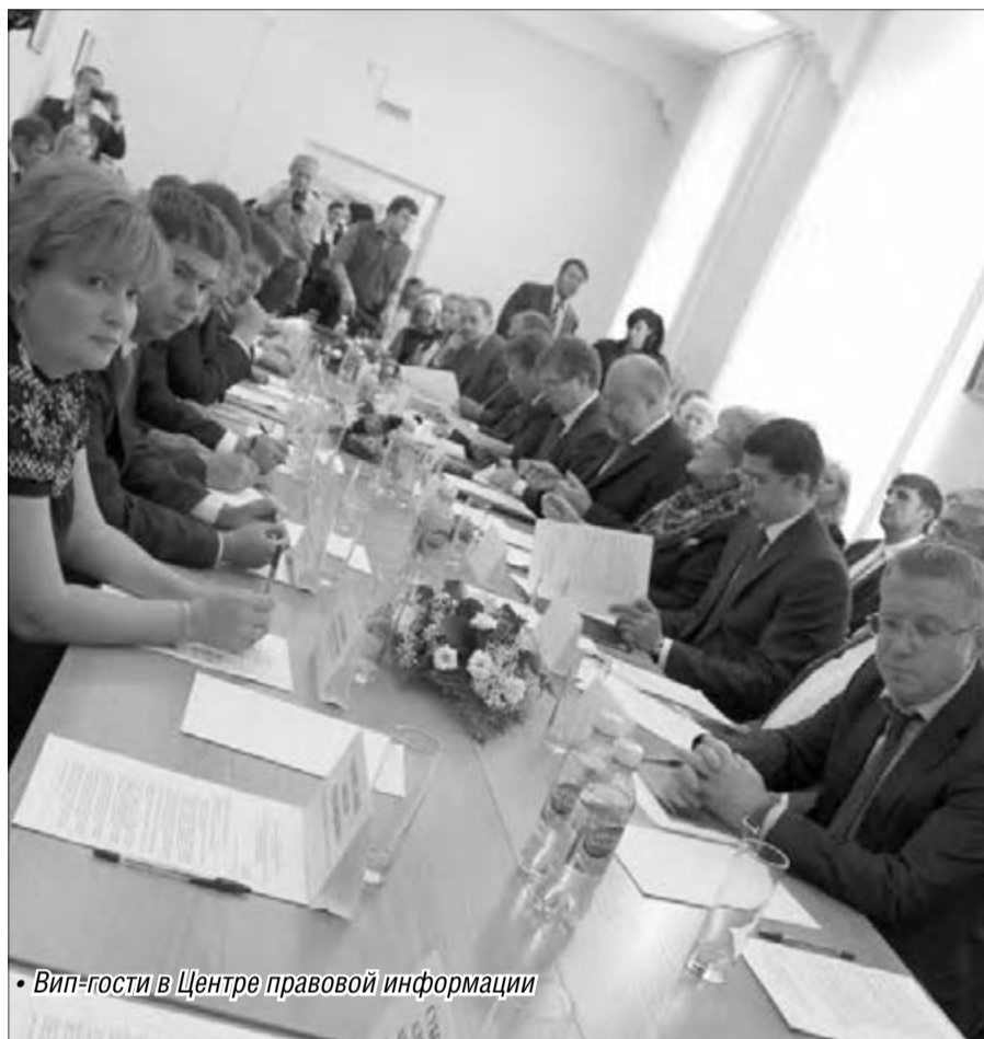
• Вип-гости в Центре правовой информации

Хорошая библиотека – книжное отражение Вселенной