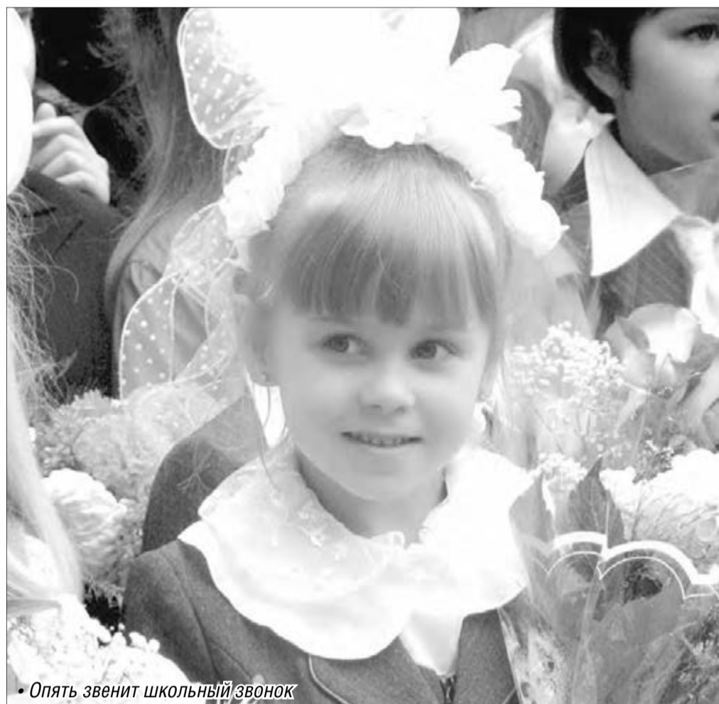
• Опять звенит школьный звонок

– Комиссия, куда входили представители управления образования, Роспотребнадзора, Госпотнадзора, УВД, муниципального предприятия «Горторг», специалисты учреждений здравоохранения, оценивала общее состояние объекта, состояние пожарной и антитеррористической безопасности, санитарно-эпидемиологическое, гигиеническое и медицинское обеспечение, выполнение мероприятий надзорных органов. Особое внимание уделялось проведению противоаварийных и ремонтных работ в зданиях, выполнению требований комплексной безопасности, модернизации учебно-лабораторной, учебно-производственной и информационно-коммуникационной базы школ для обеспечения нового качества обра-