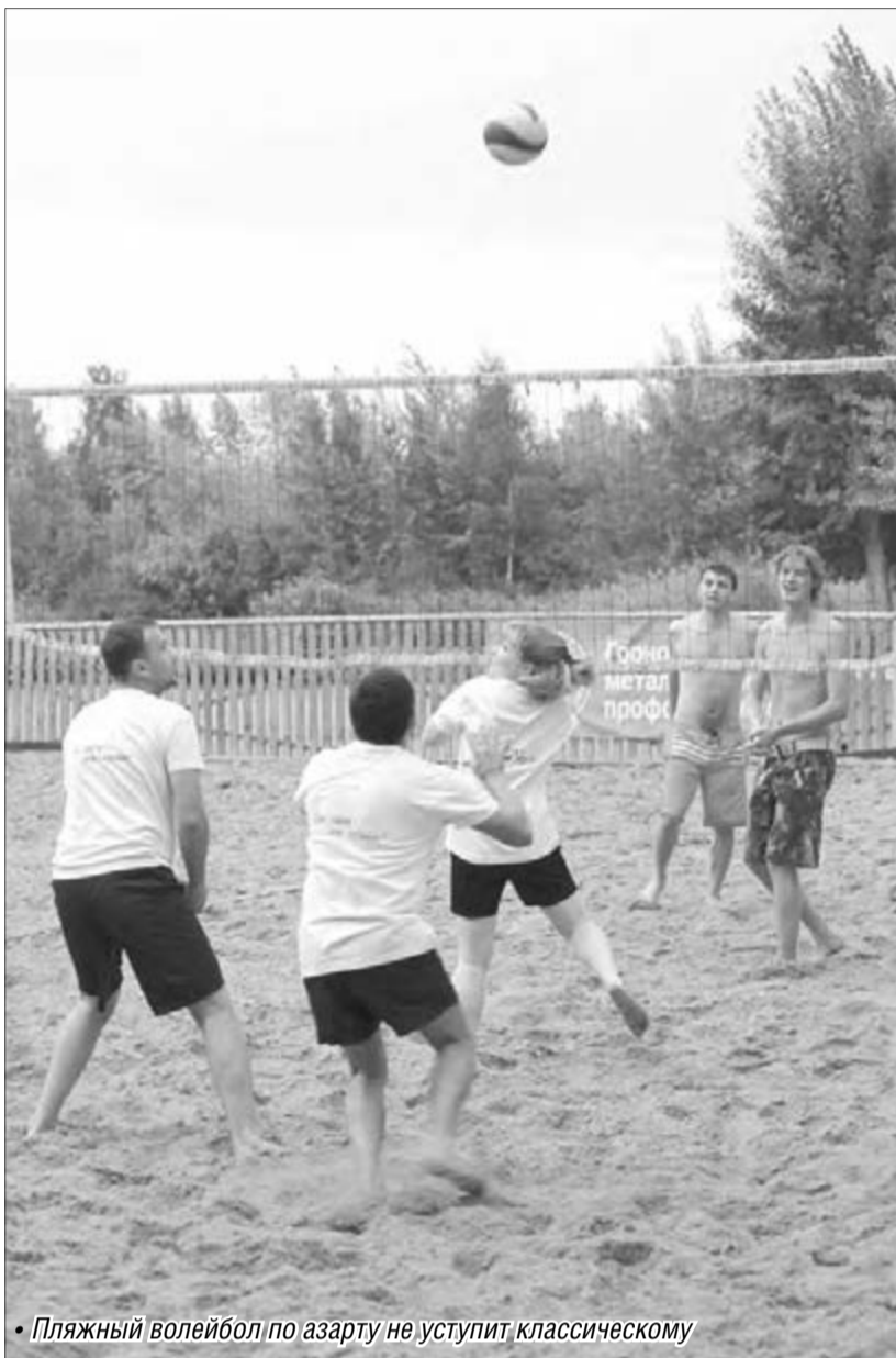
• Пляжный волейбол по азарту не уступит классическому

Летний этап турнира «Медийный кубок-2012» между средствами массовой информации завершился