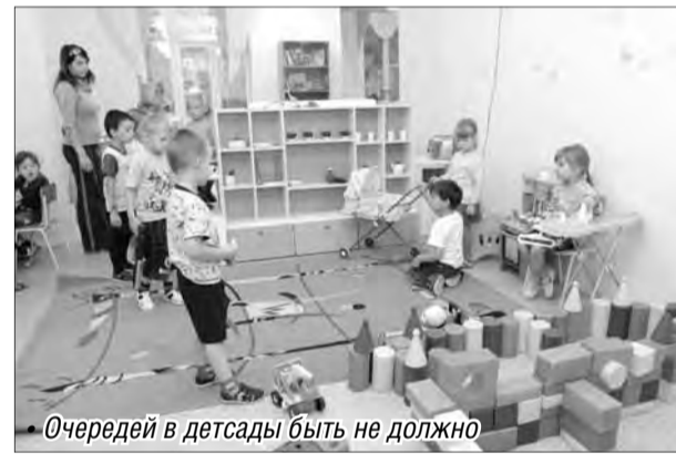
• Очередней в детсады быть не должно

Завершился большой педагогический совет награждением лучших педагогов и поздравлениями от учеников.