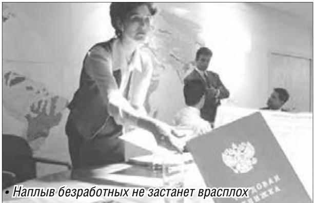
• Наплыв безработных не застанет врасплох

Также в план мероприятий включены внеочередные заседания Клуба кадровиков, выезды мобильного офиса, максимальное привлечение компьютерного оборудования и программного обеспечения.