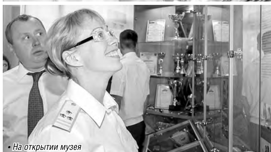
• На открытии музея

Идея создания музейной комнаты возникла, когда таможня переехала в собственное здание.