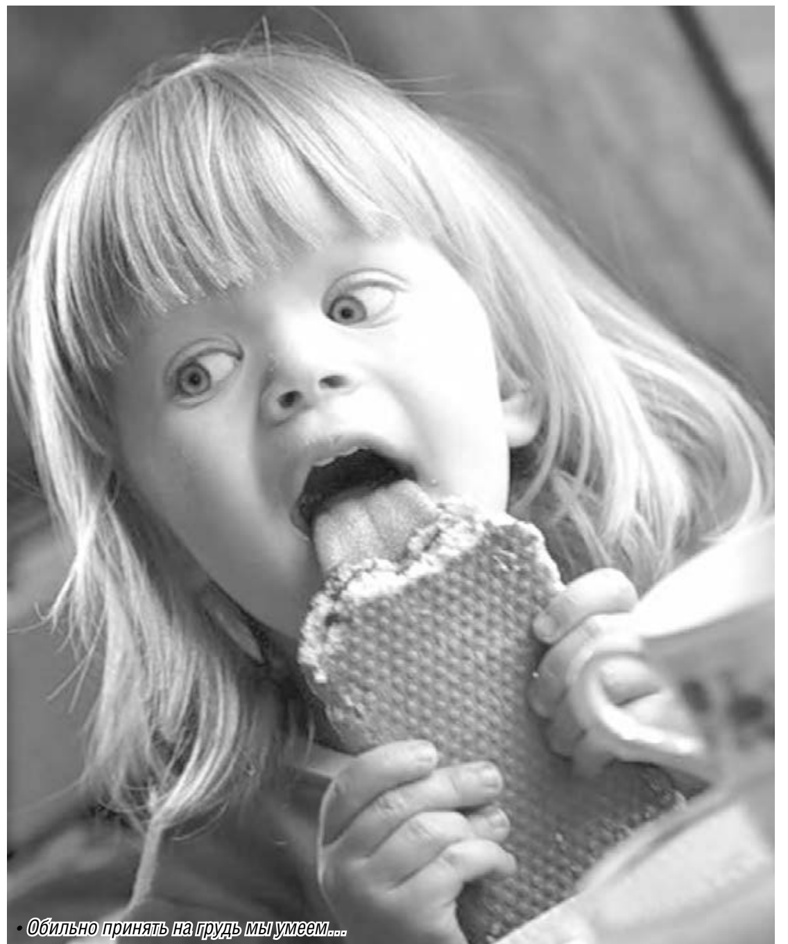
• Обильно принять на грудь мы умеем...

Но вот что интересно: в июле этого года участники исследования стали покупать значительно меньше продуктов питания (расходы на «съедобную» категорию упали на 26,5 процента) и бросились приобретать непродовольственные товары повседневного спроса (траты на них выросли сразу на 60 процентов). В целом доля продуктов питания в общих повседневных расходах снизилась с 72 до 54 процентов, а доля непродовольственных товаров выросла с 28 до 46 процентов, более