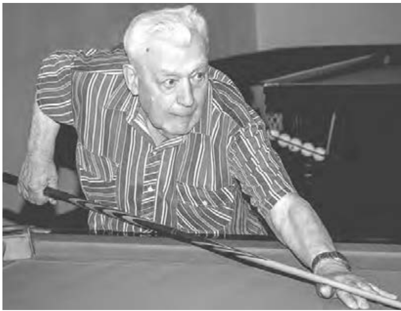
ко, ставший обладателем специального приза.