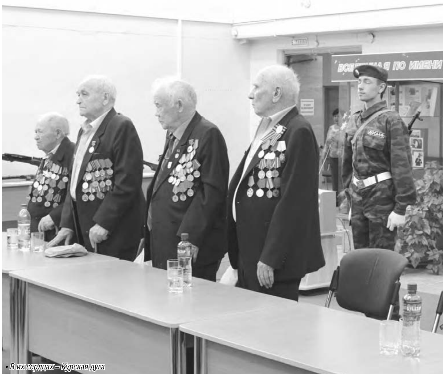
В их сердцах – Курская дуга

Память – это то, что не дает нам забыть подвиги дедов, отстоявших независимость страны