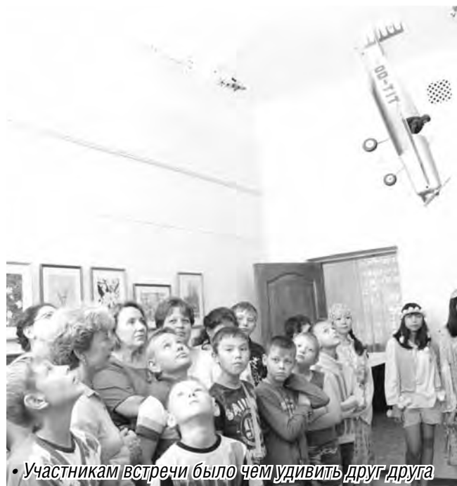
• Участникам встречи было чем удивить друг друга

Чтобы преодолеть 9585 километров от Владивостока до Санкт-Петербурга, экспедиции понадобилось пять тонн бензина