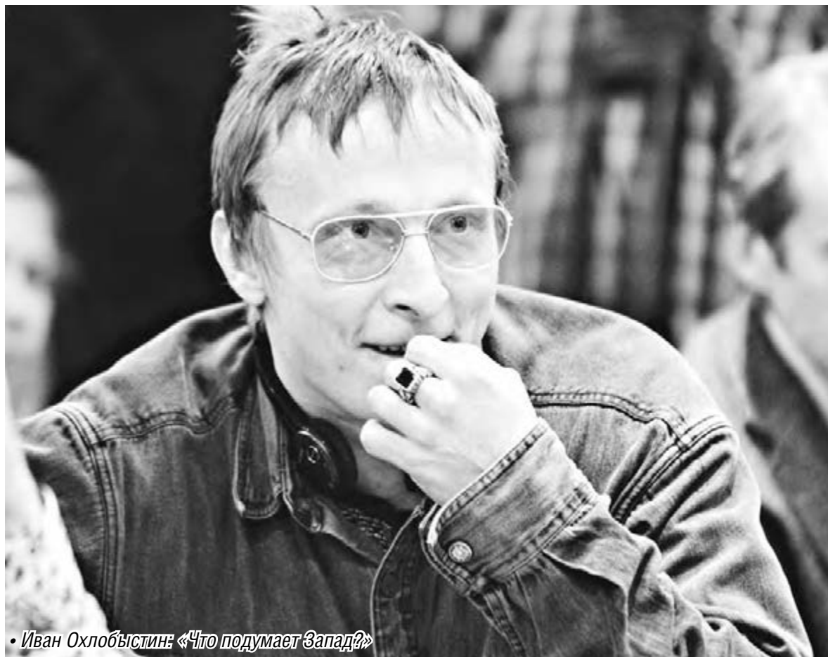
• Иван Охлобыстин: «Что подумает Запад?»

– Нужно было их выпороть и выгнать. Раньше этим дворник занимался. Хулиганки, и все. И забыть о них, – сказал Охлобыстин.