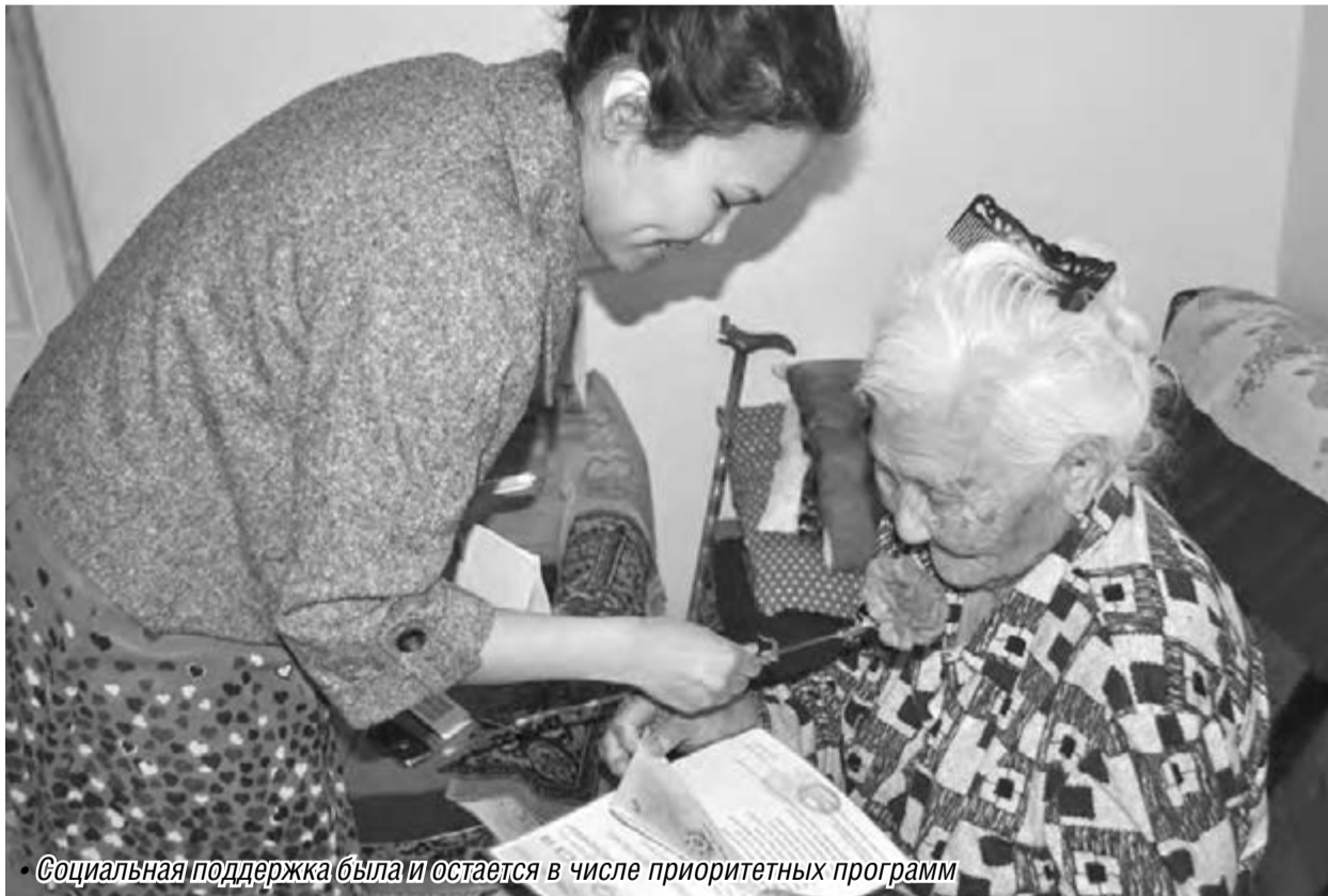
Социальная поддержка была и остается в числе приоритетных программ

ММК продолжает реализацию социальных программ