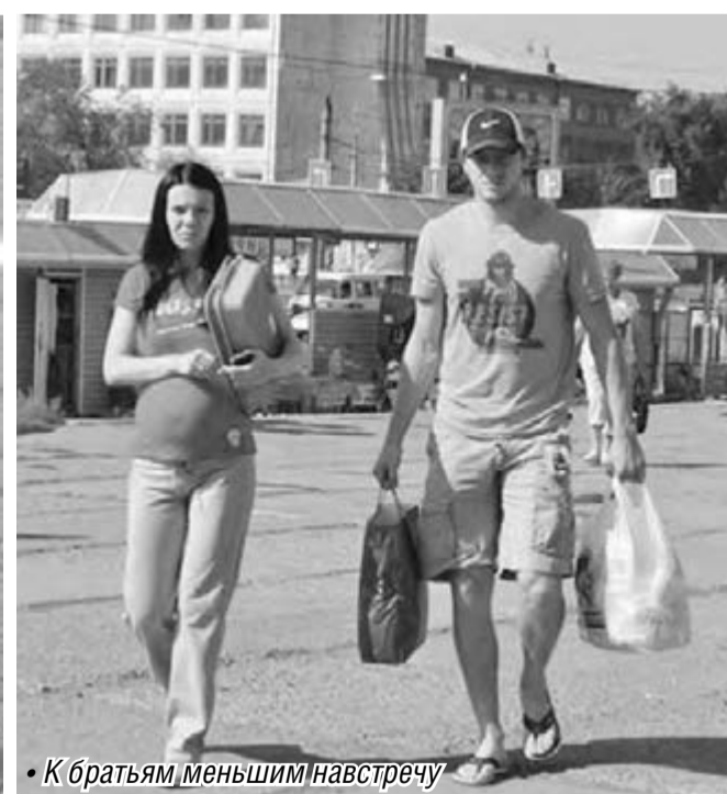
• К братьям меньшим навстречу

Так заявляют активисты некоммерческой благотворительной организации «Зоозабота». В прошлую субботу они собрались около здания цирка, чтобы привлечь внимание горожан к проблеме бродячих животных.