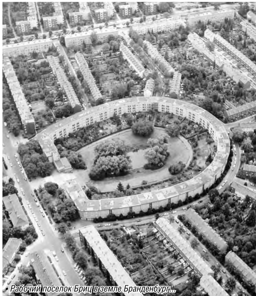
Рабочий поселок Бриц в земле Бранденбург...

Знаменитый немецкий архитектор оставил своё наследие в Магнитогорске