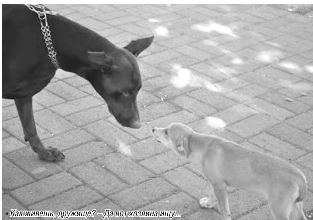
• Как живешь, дружище? – Да вот хозяйина ищущу...

«Животные – не ресурс, не еда, не расходный материал, а соседи по планете»