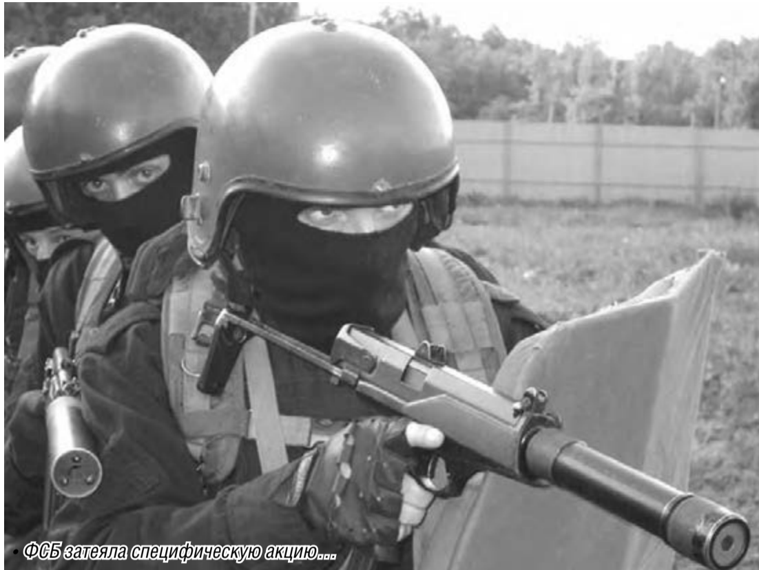
ФСБ затеяла специфическую акцию...

Все сотрудники Федеральной службы безопасности (ФСБ), гражданский персонал и кандидаты в чекисты с 1 ноября этого года будут в обязательном порядке проверяться на употребление наркотиков.