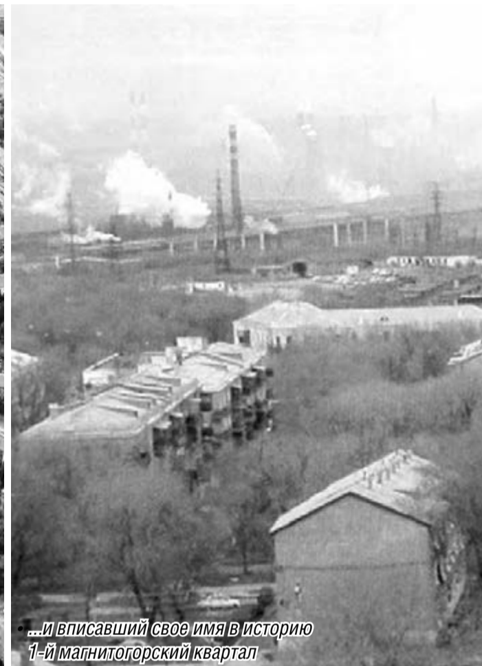
...и вписавший своё имя в историю 1-й магнитогорский квартал