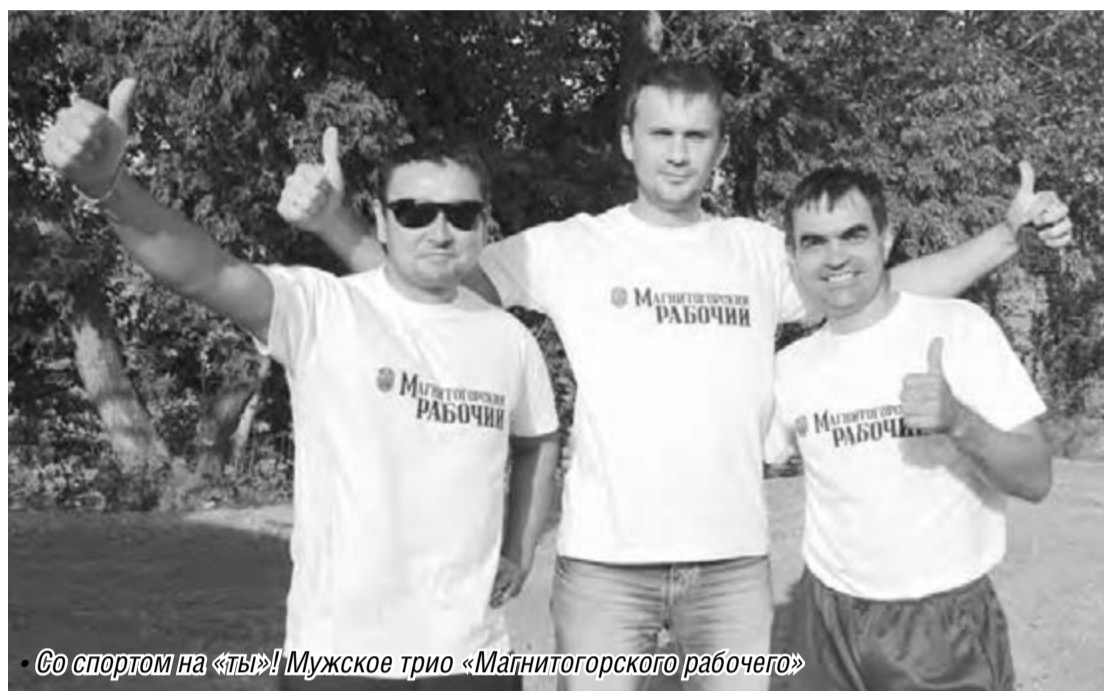
Со спортом на «ты!» Мужское трио «Магнитогорского рабочего»

ки СМИ имеют прекрасную физическую форму. Это показали предвзвешенная тренировка и сами соревнования.