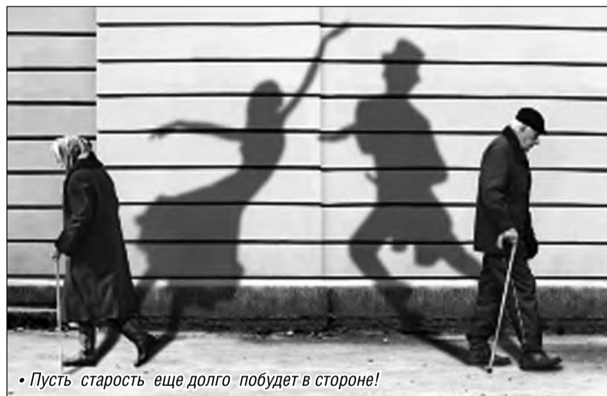
Пусть старость еще долго побудет в стороне!

Увы, над процессом физиологического увядания мы не властны, поэтому нам остается только заменить жалобное оханье «где мои 17 лет» на жизнеутверждающее «мои года –