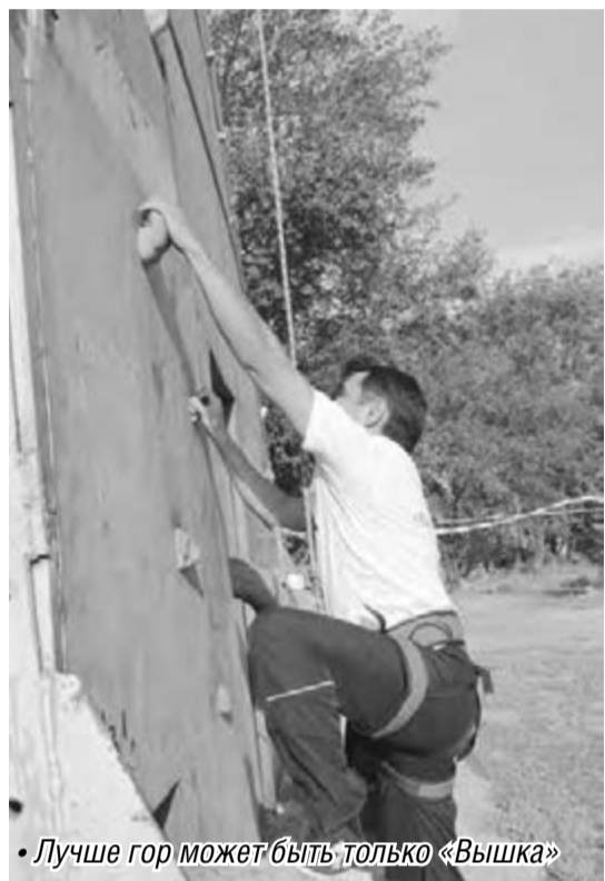
• Лучше гор может быть только «Вышка»