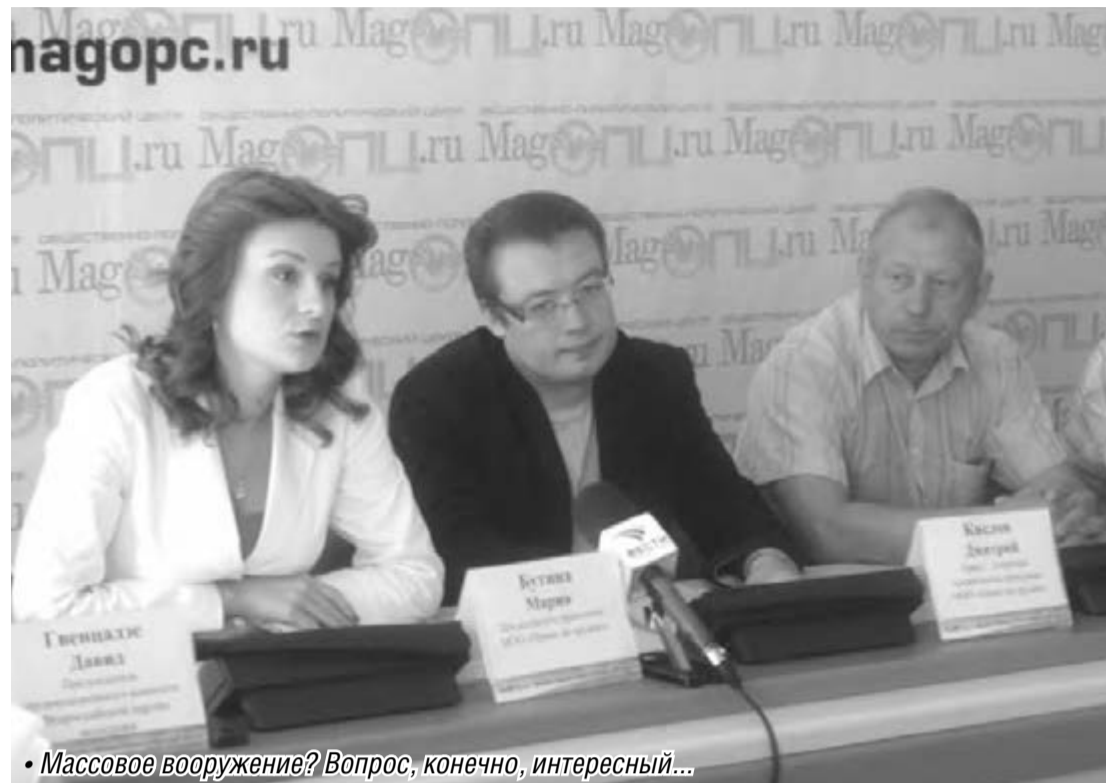
• Массовое вооружение? Вопрос, конечно, интересный...

Приблизительно так можно интерпретировать идею экспертной группы под руководством первого заместителя Председателя Совфеда российского парламента Александра Торшина.