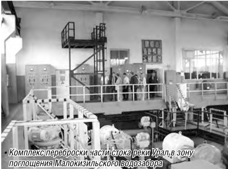
Комплекс переборки части стока реки Урал в зону поглощения Малокизильского водозабора