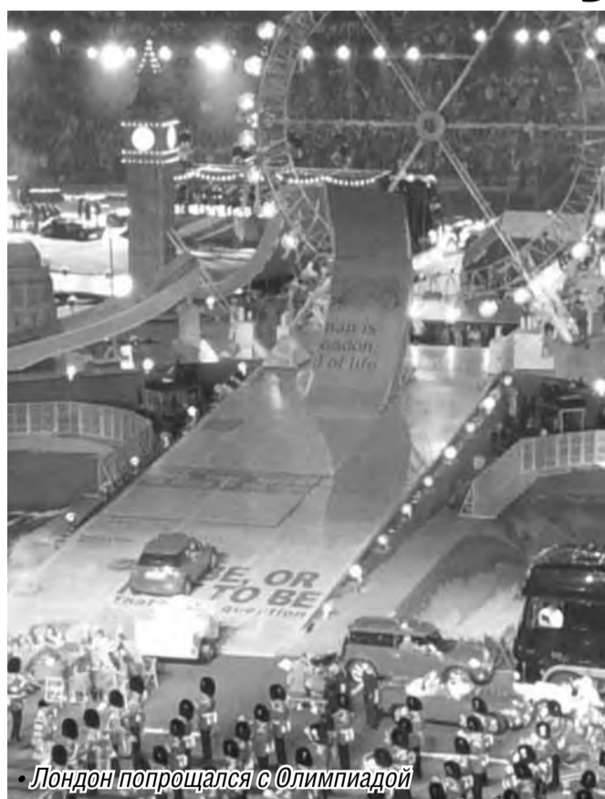
• Лондон попрощался с Олимпиадой

На церемонии закрытия Олимпиады, длившейся три часа, выступили группы Muse, Pet Shop Boys, Take That, The Who и Spice Girls.