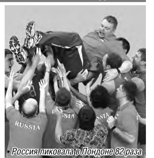
• Россия ликовала в Лондоне 82 раза

Глава Олимпийского комитета Рогге, объявивший Игры закрытыми, поблагодарил спортсменов за то, что они вписали свою имена в историю олимпийского движения, а лондонцев – за гостеприимность. «Мы все сделали правильно», – заявил глава оргкомитета Игр Себастьян Коу, обративший особое внимание на работу волонтеров и служб безопасности.