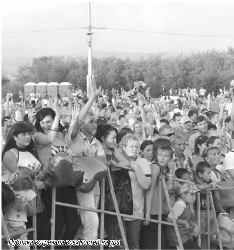
Публика встречала всех гостей на ура

В минувшую пятницу город отметил День строителя