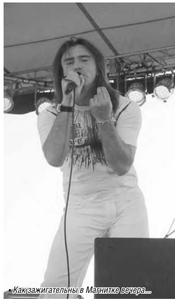
Как зажигательны в Магнитке вечера...

С недавних пор этот праздник стали отмечать так же массово, как День города и День металлурга.