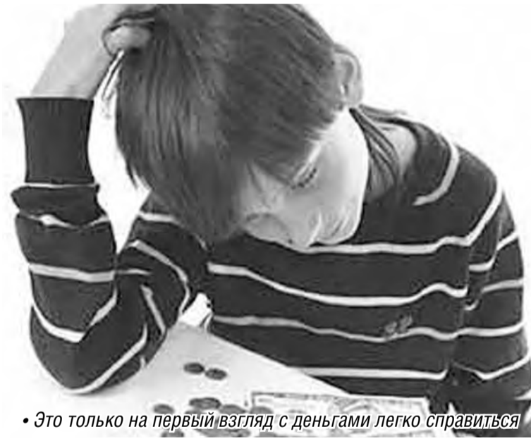
• Это только на первый взгляд с деньгами легко справиться