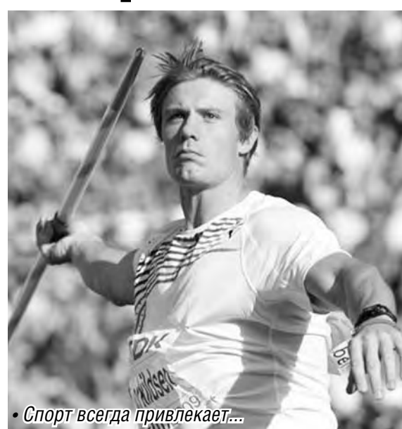
• Спорт всегда привлекает...