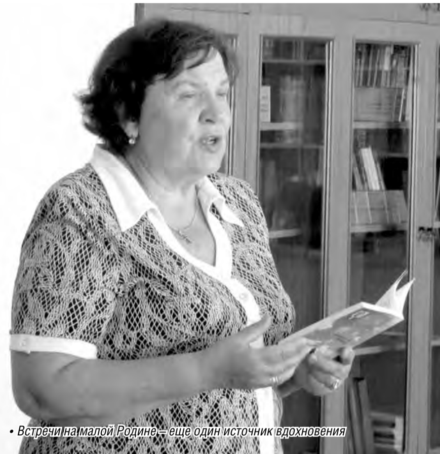
• Встречи на малой Родине – еще один источник вдохновения