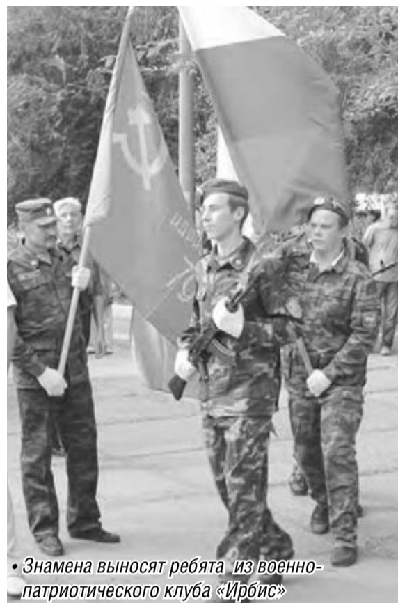
Знамена выносят ребята из военно-патриотического клуба «Ирбис»

По красному календарю он идет вслед за Днем железнодорожника – и это имеет для нас особый смысл. После того, как первый поезд прибыл в Магнитострой, тысячи людей в невероятно сложных условиях приступили к строительству металлургического комбината и большого города. Именно с первостроителей началась наша история. Великие проекты воплотились в жизнь.