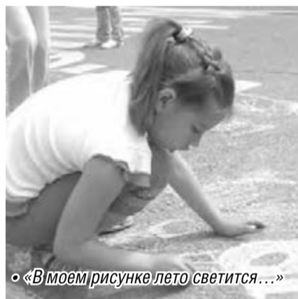
«В моем рисунке лето светится...»

Много самых разнообразных мероприятий провели работники лагеря для