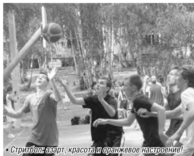
Стритбол: азарт, красота и оранжевое настроение!

Девушки. 1 место – СДЮСШОР-10. 2. «Фуфики». 3. «НикаК». Юноши. 1. «Джутаоо». 2. «Агонь». 3. «Щеглы».