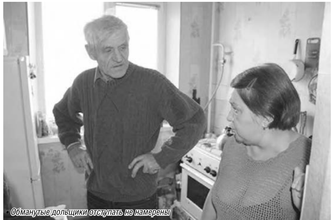
Обманутые дольщики отступать не намерены

«В приемную УПЧ (уполномоченного по правам человека) Магнитогорска продолжают обращаться граждане, пострадавшие от недобросовестных риелторов. Причем речь идет об одних и тех же ри-