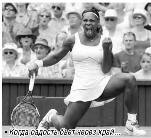
Когда радость бьет через край...