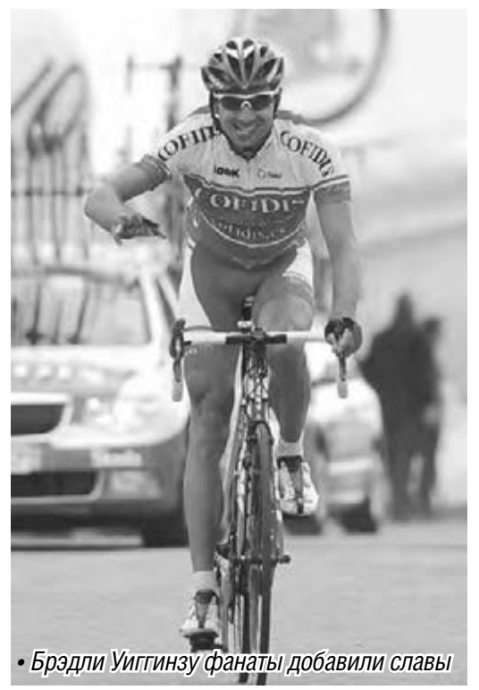
Брэдли Уиггинзу фанаты добавили славы

Как уже сообщала наша газета, у победителя в велогонке с раздельным стартом британца Брэдли Уиггинса «благодарные» подданные королевы украли шорты, когда он находился в сауне Олимпийской деревни. Спортсмен выложил эту новость в своем блоге, отметив, что не собирается придавать факту кражи значения, чтобы «не сорисорить с болельщиками». Однако история эта получила неожиданное продолжение. Через сутки шорты были выставлены для продажи на интернет-аукционе. В тот же день неизвестный покупатель приобрел чемпионские трусы на виртуальном рынке за вполне реальные...12 тысяч фунтов.