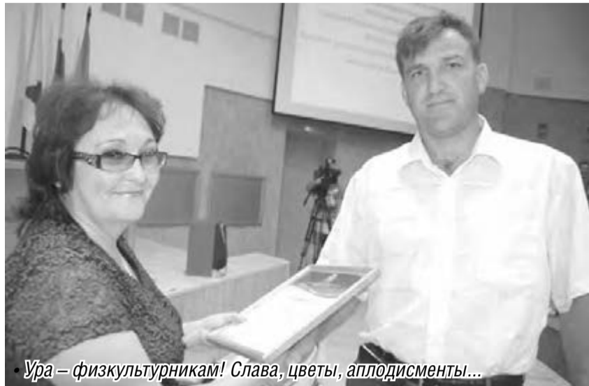
Ура – физкультурникам! Слава, цветы, аплодисменты...

Вдох глубокий, руки шире, не спешите – три-четыре... Магнитка готовится отметить День физкультурника