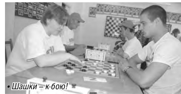
Шашки – к бою!