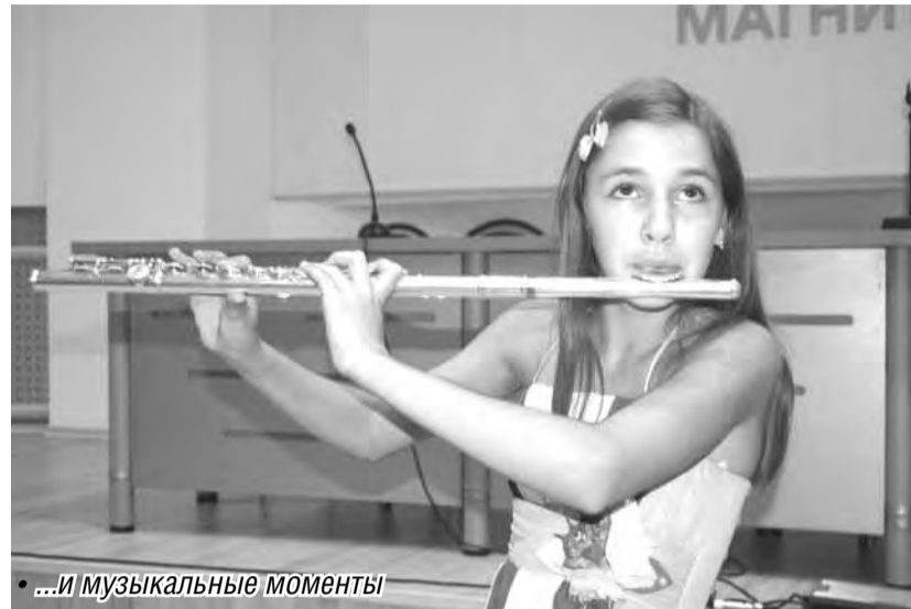
...и музыкальные моменты

Напомним, День физкультурника отмечается в России во вторую субботу августа на основании Указа Президиума Верховного Совета СССР.