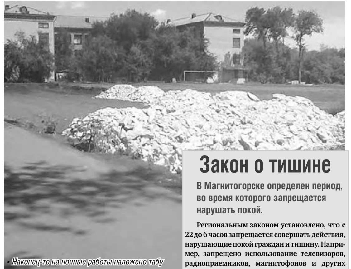
• Наконец-то на ночные работы наложено табу