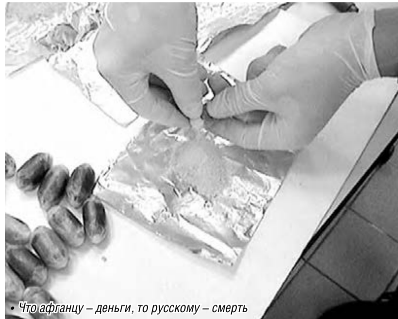
• Что афганцу – деньги, то русскому – смерть

На заседании было отмечено, что Афганистан остается планетарным центром производства героина. Наряду с этим в Россию поступает поток синтетических психоактивных веществ из Китая и Юго-Восточной Азии, сбываемых под видом курительных смесей, солей и удобрений. Таких веществ в России стали изымать в два раза больше, в нашей области – в 4,7 раза. Эта тенденция свидетельствует о перестройке наркорынка.