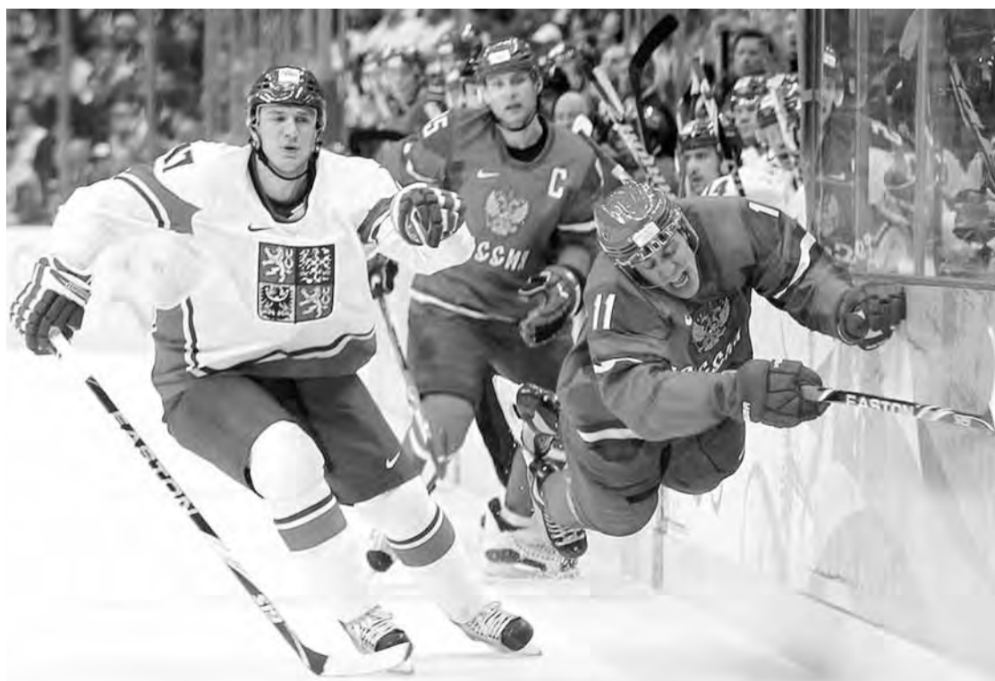
• У звезд хоккея из России в случае локаута в НХЛ есть поле для маневра

Ситуация в НХЛ сложная, а недавно возглавивший профсоюз Дональд Фер сделает все, чтобы по максимуму отстаивать права игроков. Если