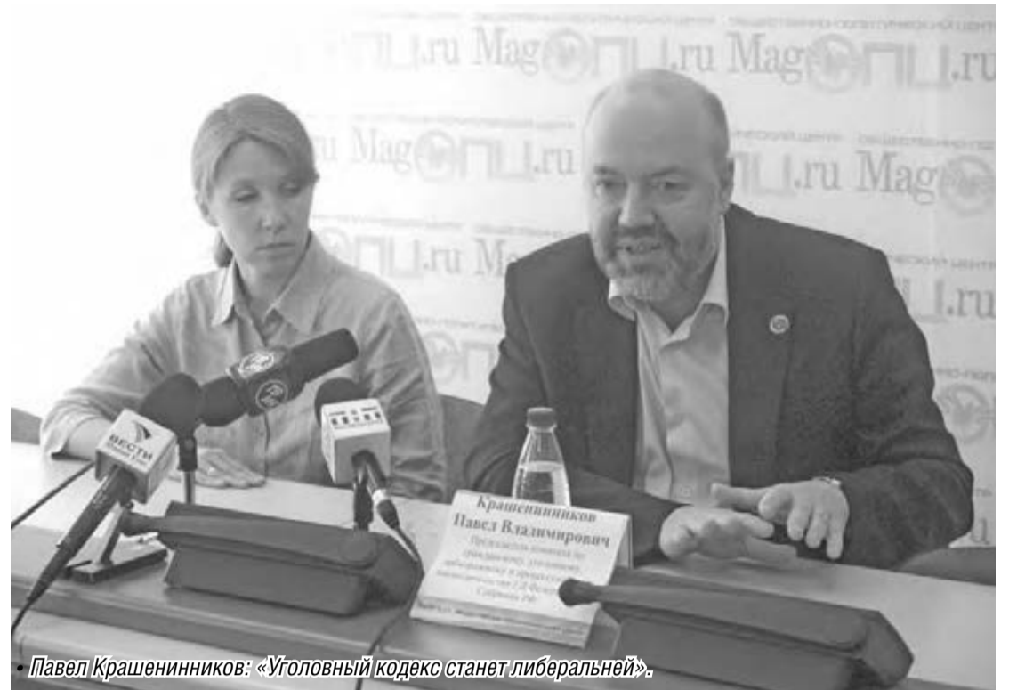
Павел Крашенинников: «Уголовный кодекс станет либеральней».

В целом законопроект предлагает массу новшеств в нашей жизни. Например, вводит отсутствовавший ранее в гражданском законодательстве институт владельческой защиты – предоставление упрощенной юридической защиты от самоуправства. У нас до сих пор владение имуществом, например землей, фактически плохо защищено. Поэтому случается, когда кто-то врывается на чужую территорию и говорит: «Это мое». Поскольку споры вокруг собственности могут тя-