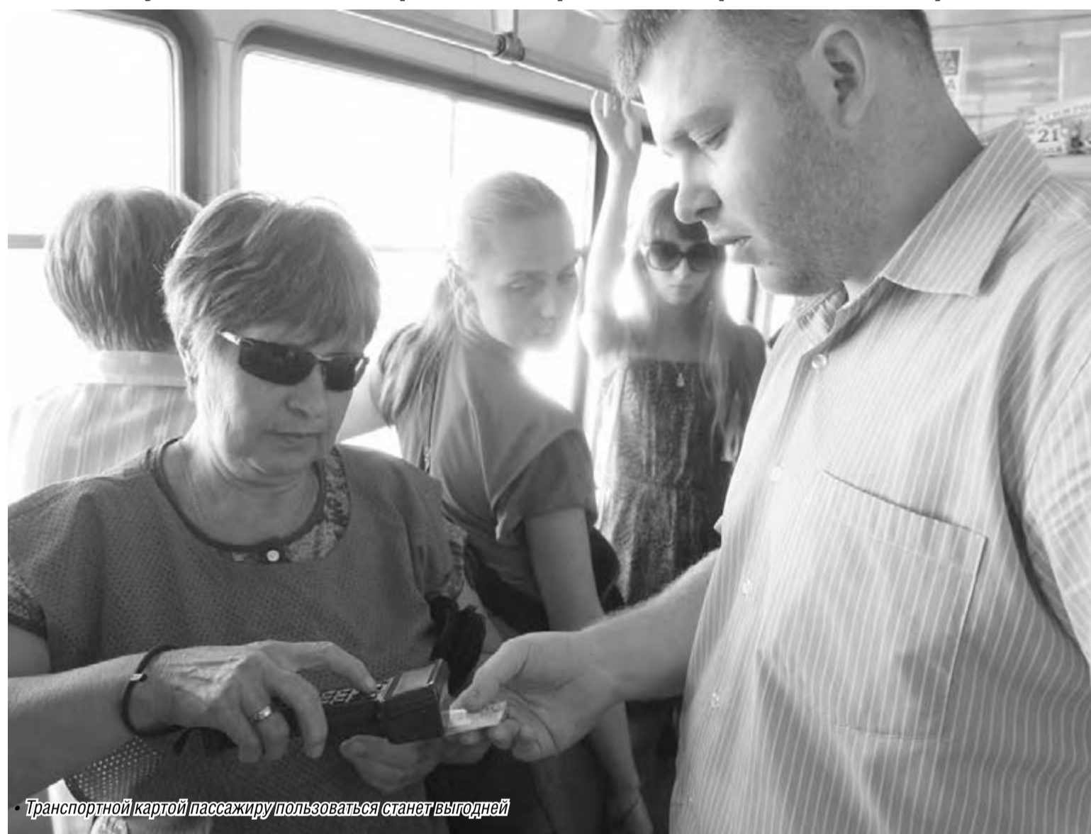
Транспортной картой пассажиру пользоваться станет выгодней

С 1 августа стоимость проезда в трамвае вырастет на 50 процентов