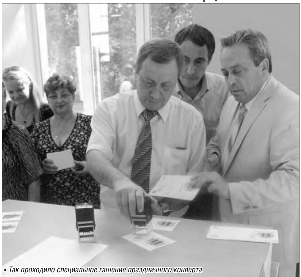
• Так проходило специальное гашение праздничного конверта

В канун Дня города и Дня металлурга почтовики преподнесли магнитогорцам несколько подарков