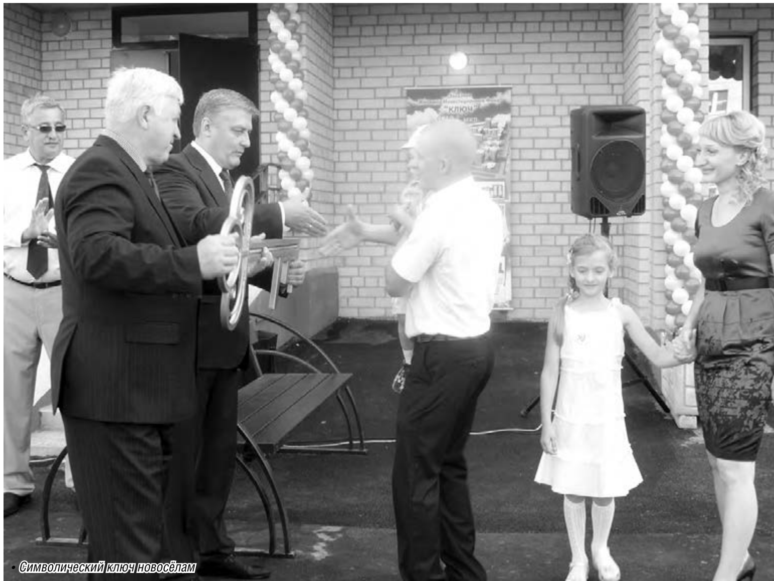
Символический ключ новосёлам

В канун профессионального праздника семьи работников ОАО «ММК» получили новые квартиры