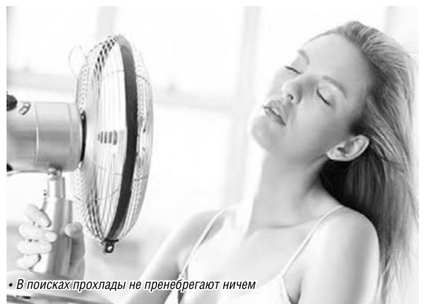
• В поисках прохлады не пренебрегают ничем

Медики советуют соблюдать сложные рекомендации для того, чтобы снизить негативное влияние высокой температуры воздуха на организм. По возможности не стоит выходить на улицу с 11 до 17 часов, когда солнце наиболее активно. В помещении необходимо поддерживать прохладу, закрывать окна плотной тканью. Несколько раз в день по возможности принимать