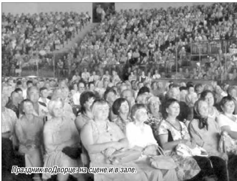
Праздник во Дворце: на сцене и в зале.