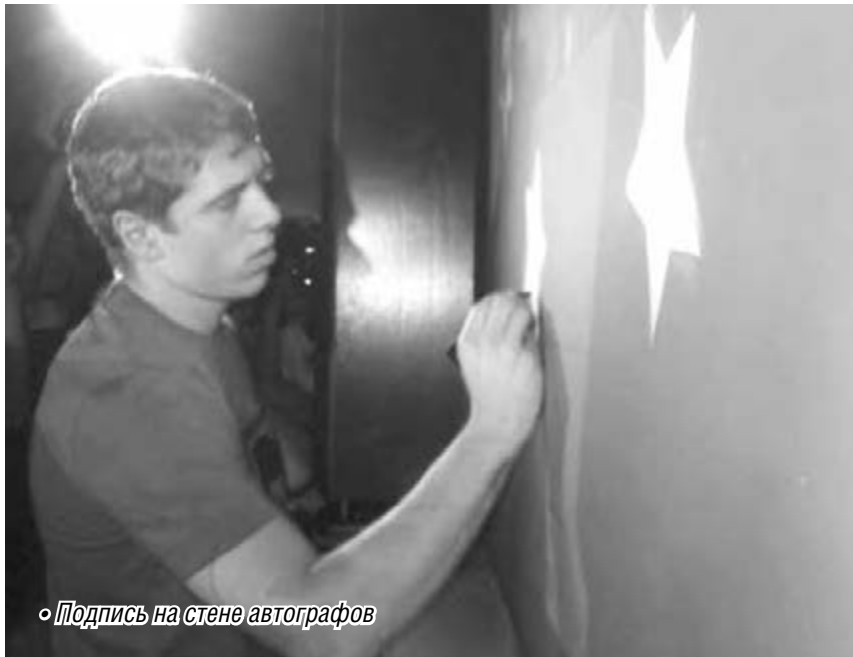
Подпись на стене автографов

– Вы семейные люди. Доверяют ли вам жены?