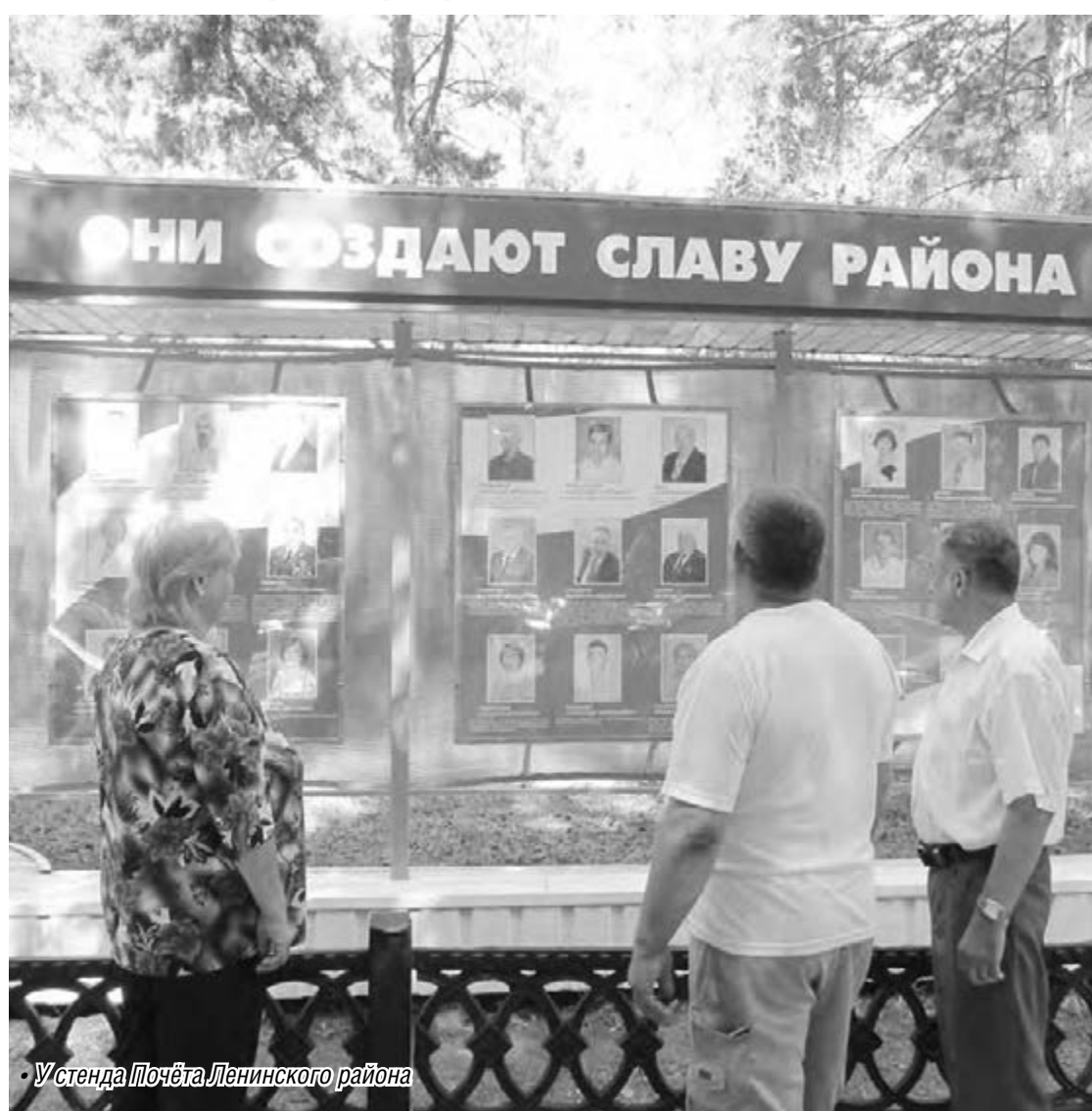
• У стенда Почета Ленинского района